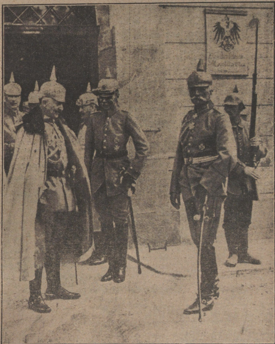
LOS JEFES DE ESTADO MAYOR EN LA GUERRA.—El Emperador Guillermo durante su visita al Cuartel general del mariscal alemán von Mackensen.

La Diputación y el Ayuntamiento han tomado acuerdos en igual sentido.