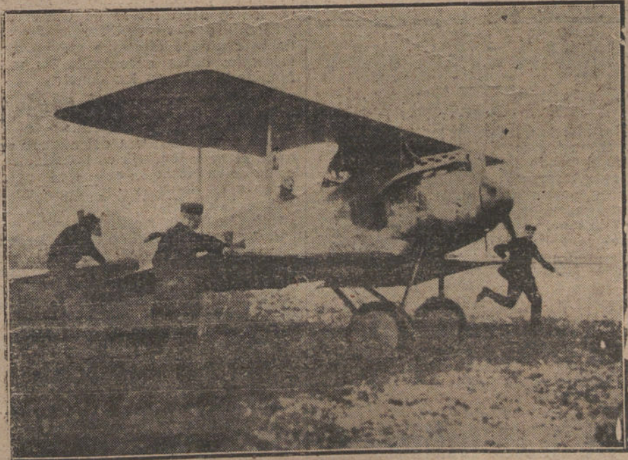
LA GUERRA EN EL AIRE.—El Principe Federico Carlos de Prusia, en el aeroplano construido por él mismo.

Confirmó el Sr. Dato que S. M. la Reina se ha interesado mucho en favor del