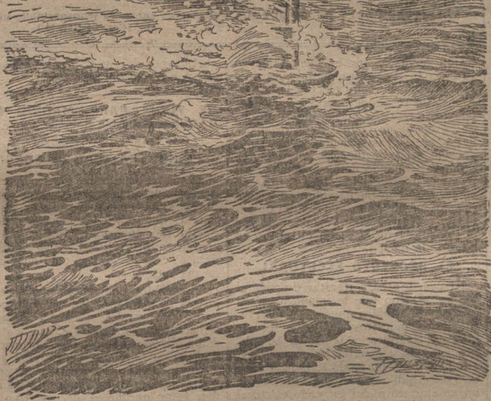
Un submarino observando la operación de unos cruceros.

Esta mañana rechazamos una incursión alemana al Noreste de Gouzeaucourt con pérdidas para los asaltantes, sin que nosotros hayamos sufrido pérdida alguna.»