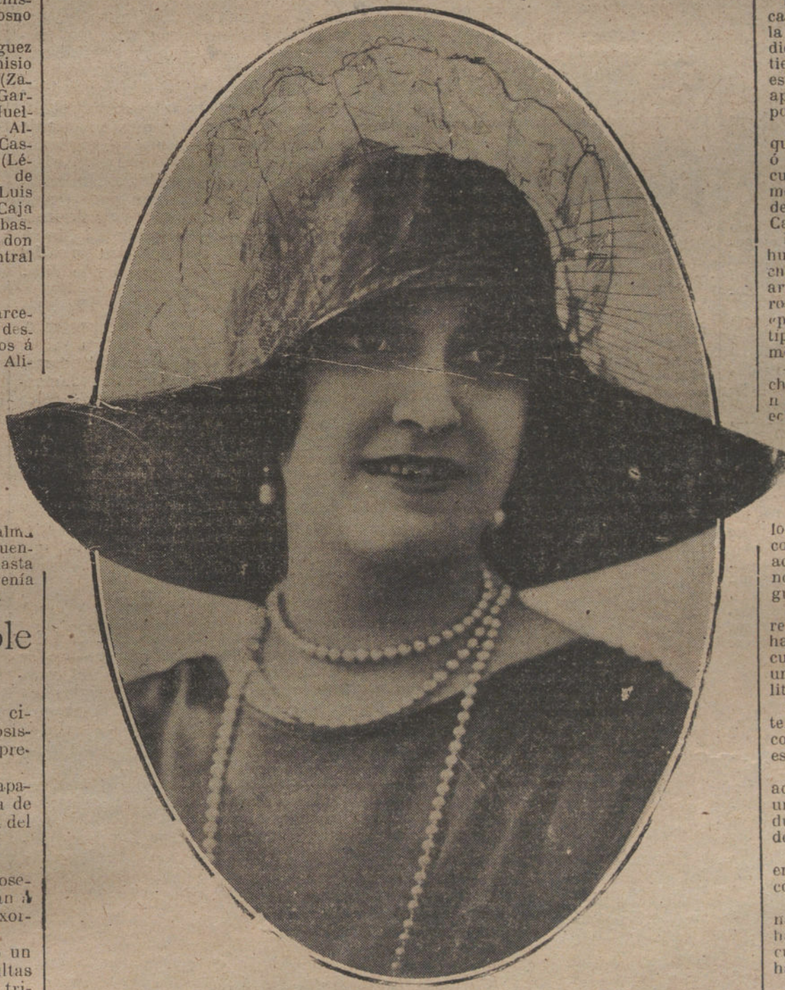
Sombrero de satén azul natural con corona rusa de gasa bordada en oro, modelo creado por la Casa Amelie.