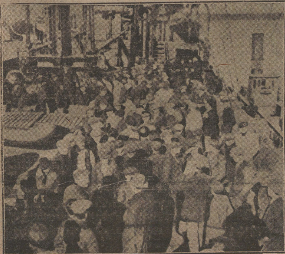
EL CORSARIO «MOEWE».—Numerosos prisioneros de los países aliados en la cubierta del «Moewe» a la llegada a un puerto.