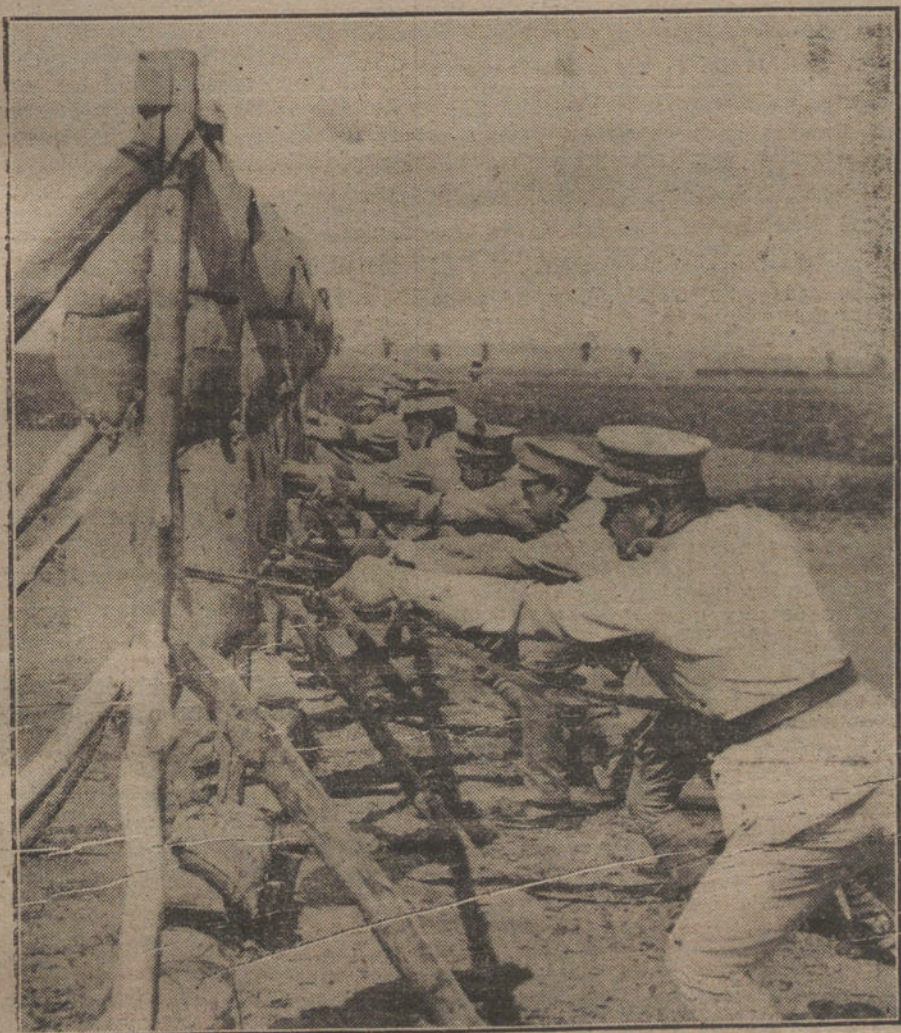
LOS NUEVOS FACTORES DE LA GUERRA. Soldados portugueses ejercitan sus habilidades en el empleo de las bayonetas.

Se han reunido en la Cámara Agrícola los Sindicatos de Gran Canaria,