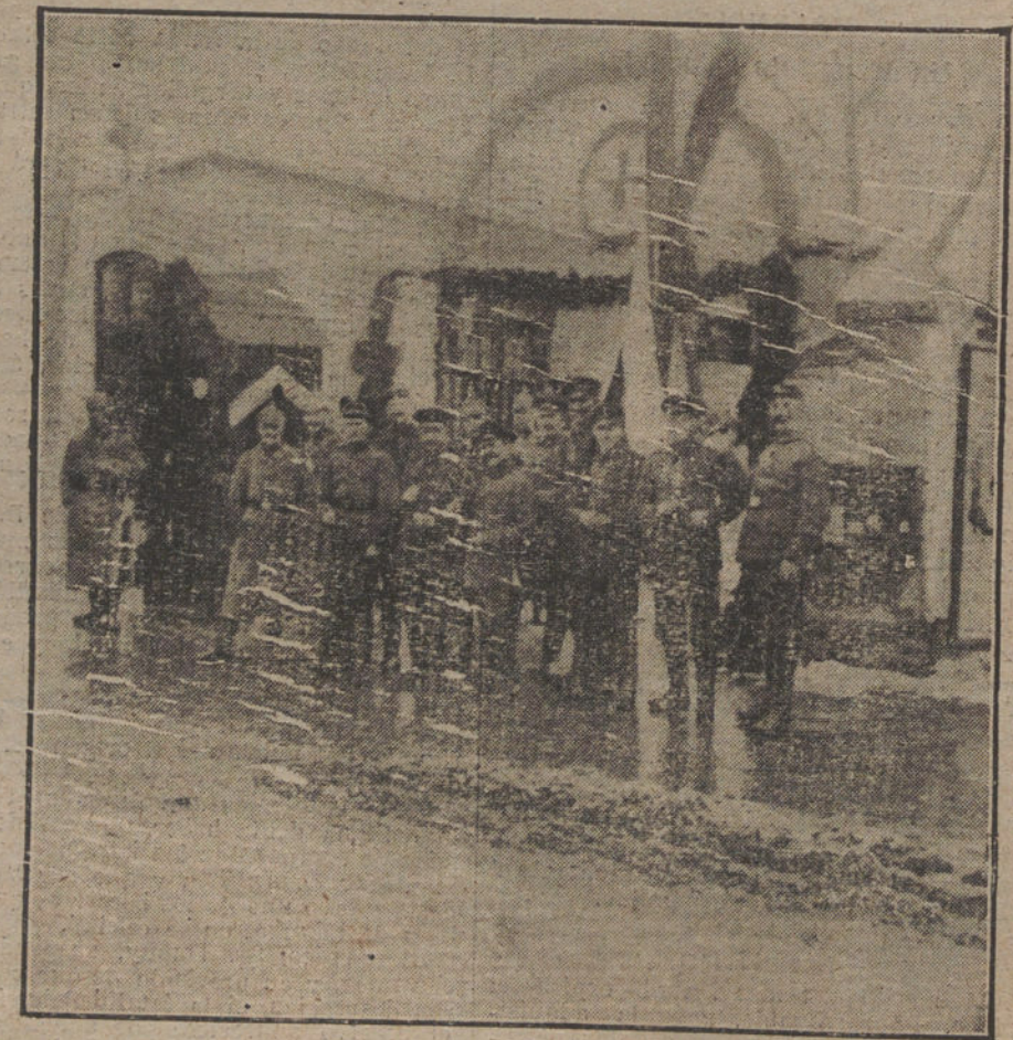
EN LAS TIERRAS CONQUISTADAS.—Puerta de un cuartel alemán en Bucarest

Es naturalmente la misión de cada delegado de los partidos que hayan de resolver lo pendiente en el sentido de su partido. Esto ha de reconocerse sin necesidad de más, pues precisamente con ello debe establecerse un más íntimo contacto entre el Gobierno y los partidos. El jefe del partido ha de designarse para el Comité, y entonces existirá la garantía de que se exteriorice la opinión de su partido. Con esto está dada la seguridad de que las deliberaciones sean fructíferas. Se da por supuesto que los