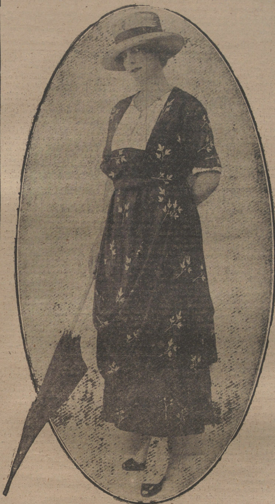
Traje de cachemira azul oscuro con flores blancas, modelo de la Casa Redfern.

NUMERO DEL TELEFONO DE LA ADMINISTRACION DE «LA TRIBUNA» (PLAZA DE CANALEJAS, 6), 5,551