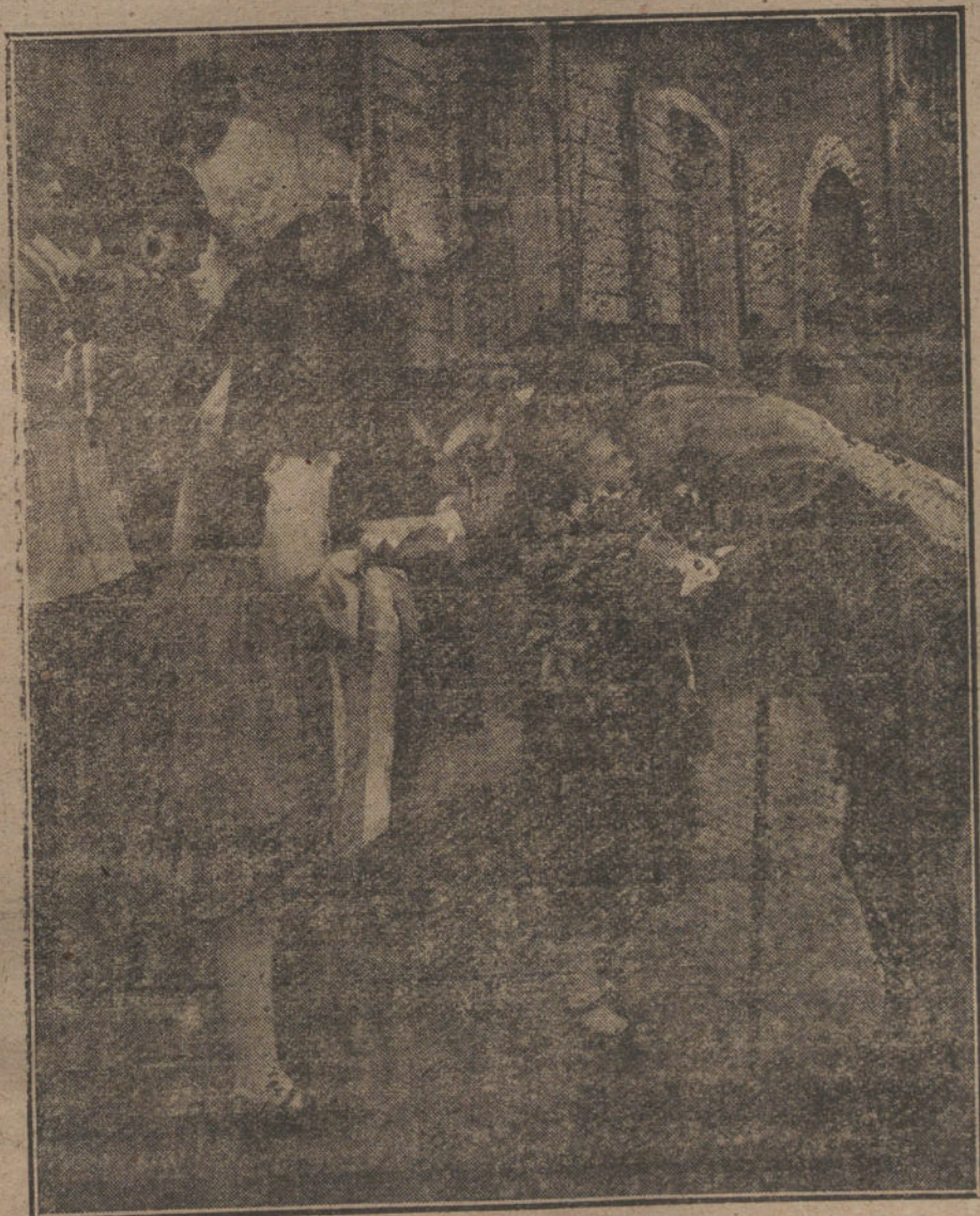
EN EL FRENTE OCCIDENTAL.—El generalísimo francés Pétain besando á una niña alsaciana.

El mundo marcha por esa senda, mal que le pese á la Múltiple. Dada la magnitud del desquiciamiento espiritual y material del mundo, todavía pasará tiempo hasta que el bien universalmente anhelado se madure; pero todas las cosas requieren un comienzo, y el primer paso está dado, y como es un hecho que lo dieron Alemania y Aus-