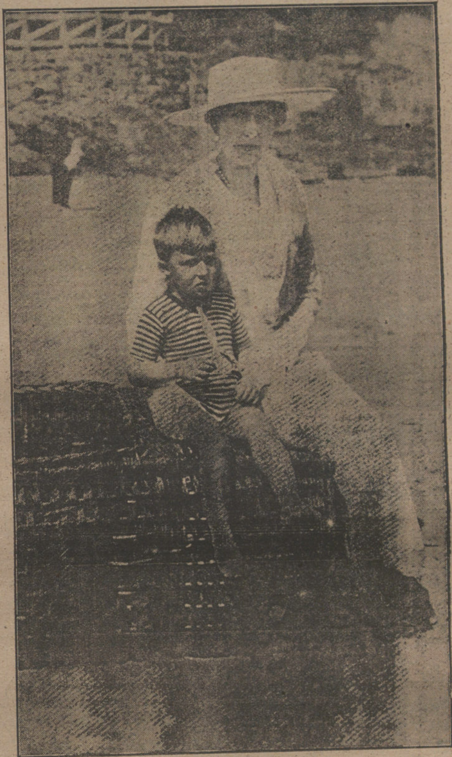
EL VERANEO REGIO.—S. M. la Reina Doña Victoria con el Infante Don Juan en la playa de Santander.

tria, la Historia, que de hechos se nutre, consignará con beneplácito en sus páginas ese gesto noble, rindiendo á sus autores el aplauso debido. Todas las cosas, en su principio, revisten la forma de la inconcreción. La tierra que habitamos fué emergiendo lentamente sus prominencias de la faz confusa de las aguas; la fauna y la flora milenarias, el hombre mismo ha ido perfeccionando su tipo físico y su alma á través de las edades.