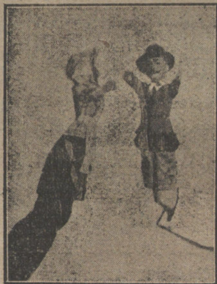
El Bergante y el Ama de llaves.

Tarde viene el «guignol» á Madrid, recibido como espectáculo de arte. Apenas si en alguna feria, si en la plaza Mayor, ó en la plaza de la Paja, ó en el Puente de Toledo, aparecía antes de vez en cuando un creador trasahumante de la comedieta de polichinelas. Un coche-barraca, una olla cocinándose al aire libre y una caja que era á la vez habitación y sepultura de los monigotes. Luego unas representaciones engañabobos y unas cuantas monedas de cobre en una bandeja. He aquí el rastro de la farsa guignolesca entre nosotros. Sin embargo, el «guignol» no se ha resignado á morir. Los