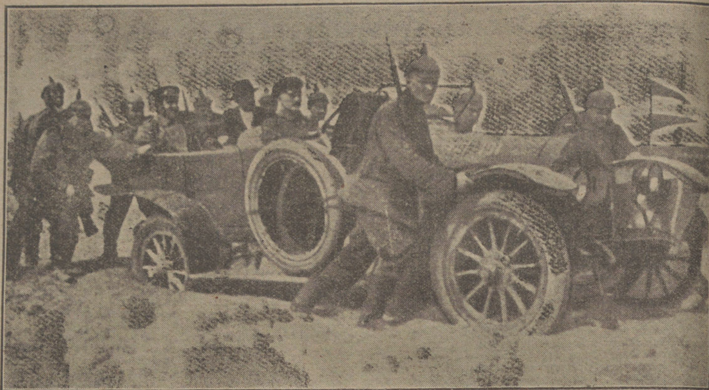
LAS DIFICULTADES DE LA GUERRA. Tropas alemanas ayudando á los automóviles por los caminos pantanosos de Rusia.

la Agencia Havas falsificó la respuesta de Wilson á la Nota del Papa por omisiones y adiciones, publicándola así.