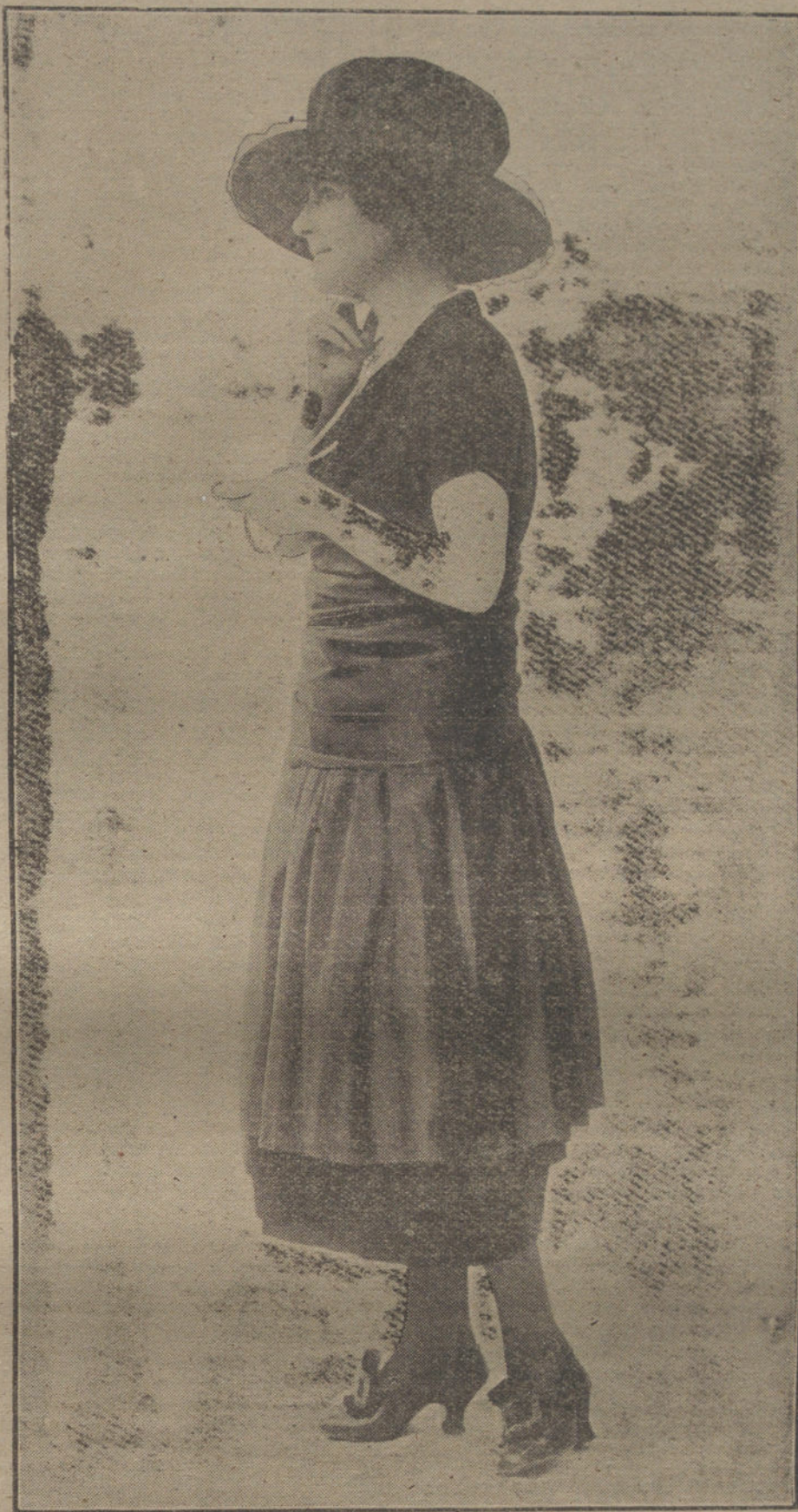
Traje azul marino, de sencillísima y moderna confección, para la cual se puede emplear cualquier clase de género, modelo de la casa Ferland.