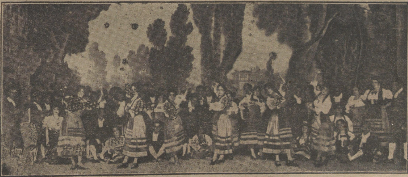
Escena del primer acto de la zarzuela «También la corregidora es guapa», de Tomás Borrás y «Mingo Revulgo», música del maestro Lleó, que se estrena esta noche en el teatro de Price.

REUS. El Colegio Oficial de esta provincia ha acordado adherirse a la Asamblea Nacional de Veterinaria, nombrando la Comisión correspondiente que lo represente en ella.