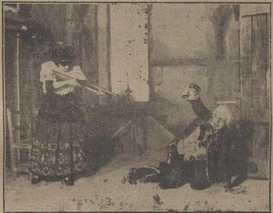
Una escena del segundo acto de «También la corregidora es guapa», zarzuela que se estrena esta noche en Price.