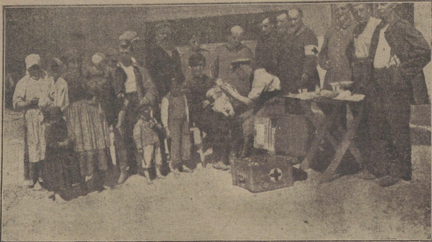
EN LAS TIERRAS CONQUISTADAS. Consulta pública gratuita de un médico alemán en la Pelenia rusa.

El periódico holandés «Nieuwe Courant» recuerda que han transcurrido siete semanas desde que las aguas holandesas han sido violadas por barcos de