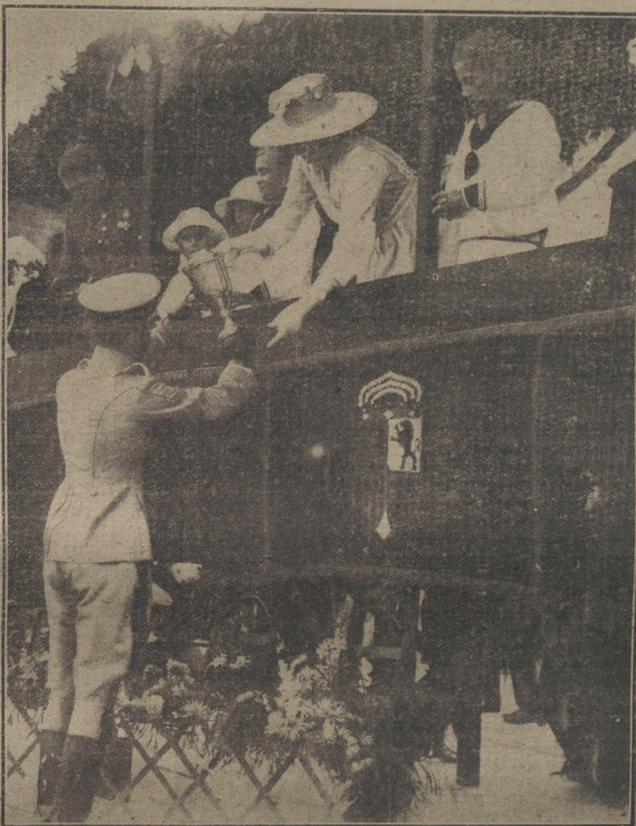
EL VERANO EN SANTANDER.—S. m. la Reina Victoria entregando los premios del Concurso hipico.

¿Qué es esto comparado con los fines que persigue la Entente? La simple imagen, sobre los mapas, de los éxitos militares de las potencias centrales y la consideración, que la experiencia abona y el tiempo mejorará cada vez más, de la firmeza económica de Alemania, debido a su admirable sistema, que los propios aliados elogiaron siempre y han copiado en buena parte, dicen bien claro que lo que piden los Imperios constituye una base moderada, razonable, justa para los acuerdos de una paz provechosa, que asegure el porvenir del mundo.