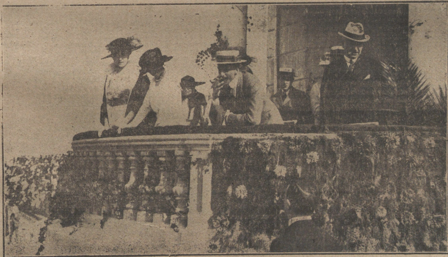
INAUGURACION DEL HIPODROMO DE SANTANDER.—SS. MM. los Reyes presenciando las carreras de caballos desde la tribuna regia.