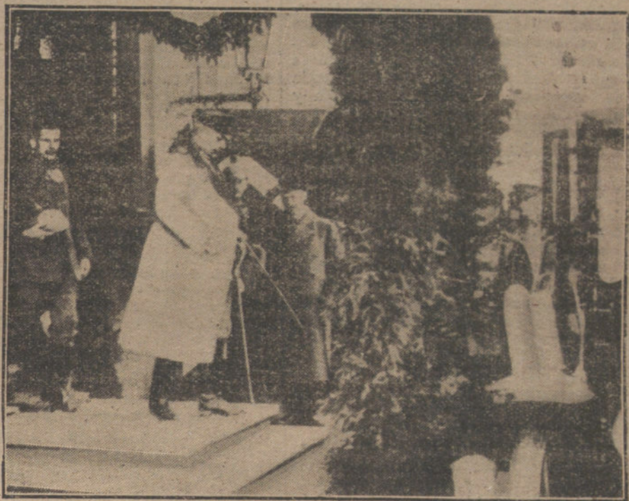
LAS GRANDES FIGURAS DE LA GUERRA.—El mariscal von Hindenburg, generalísimo de todos los Ejércitos de los Imperios centrales, dirigiéndose á la línea de fuego.

Un nuevo tropel hace irrupción en la sala. Son las tripulaciones de unos barcos ingleses torpedados frente á Cabo Espartel. Gente ruda de mar que no sabe de frivolidades de hoteles lujosos, y se muestra cohibida y deslumbrada en un ambiente tan contrario á sus costumbres humildes. Vienen vestidos de una manera graciosamente arbitraria, con trajes desproporcionados, desmedidos, que les esconden las manos en las mangas ó les estallan los pernils en las costuras, y si una prenda les va flameando, la otra les hace casi astrosos. Y gracias á las casas consignatarias que les facilitaron estas ropas, porque los naufragos no habían tenido tiempo de salvar ni sus equipajes. Y así no se sabe ciertamente quién sea el capitán ni quién el fogonero. Movieran á risa, si no á lástima. Pero de lo que menos se preocupan es de este atentado á las tradiciones del dandismo inglés. La cariñosa solicitud con que todos les acogieron, ha ido sossegando la azarada poquedad de los marineros. Y ya comen y liban con la misma franqueza que si estuvieran en los democráticos bodegones de los muelles. Los consignatarios querían pagarles con este festín las angustiosas horas de la catástrofe, cuando los dejaron á merced de los submarinos, como pasto de la guerra, á tan pocas millas de Gibraltar... Y ellos parecen perdonarlo todo en la alegría de esta noche, una alegría dulce y resignada, que no llega á aturdirlos, que no podrá tampoco horrorar de