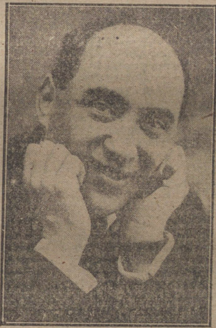
El notable actor y director de la compañía de Price, que en la obra «También la corregidora es guapa», obtiene un éxito personal.