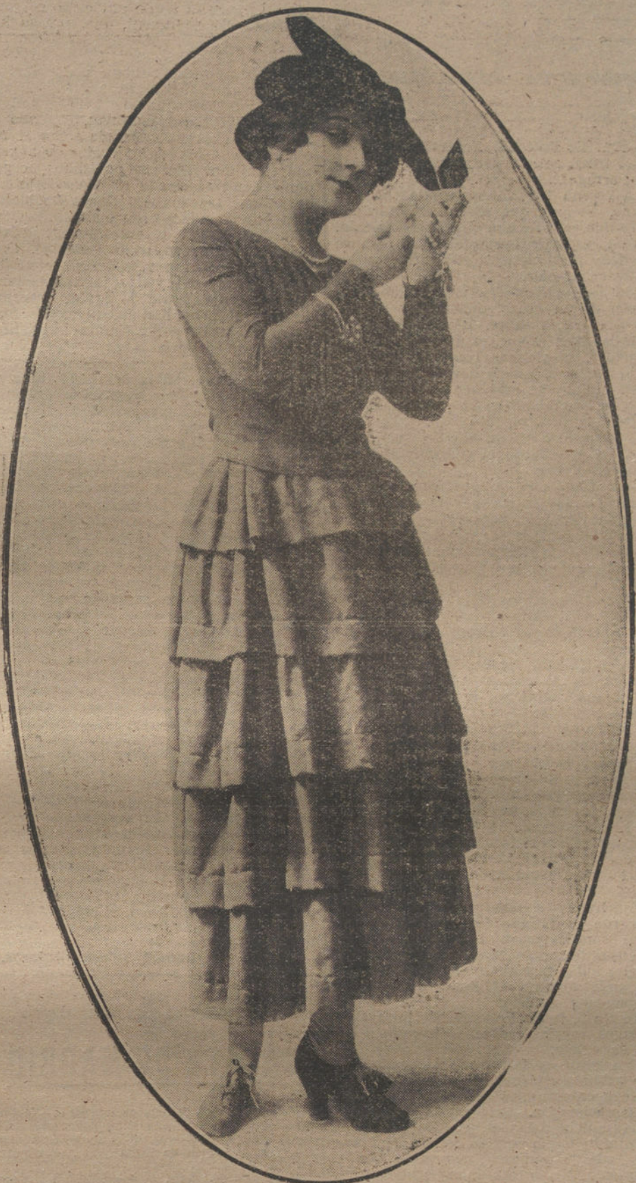
Vraje en «tricot», sin adornos ni otra decoración que joyas.