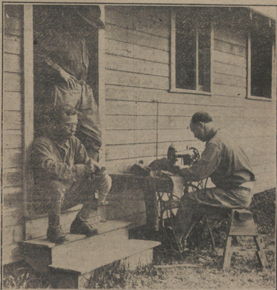
LAS NECESIDADES DE LA GUERRA. Taller de sastrería á la puerta de un hospital de campaña.

Más el hado providencial vela por la suerte del herido pueblo ruso, y en los momentos en que Kerenski más se afana por imponer su criterio de continuación de la guerra para salvar, como equivocadamente cree, los principios de la Revolución, el ex ministro de la Guerra del Zar y el ex jefe del Estado Mayor de Nicolás II vierten sus graves declaraciones en un proce-