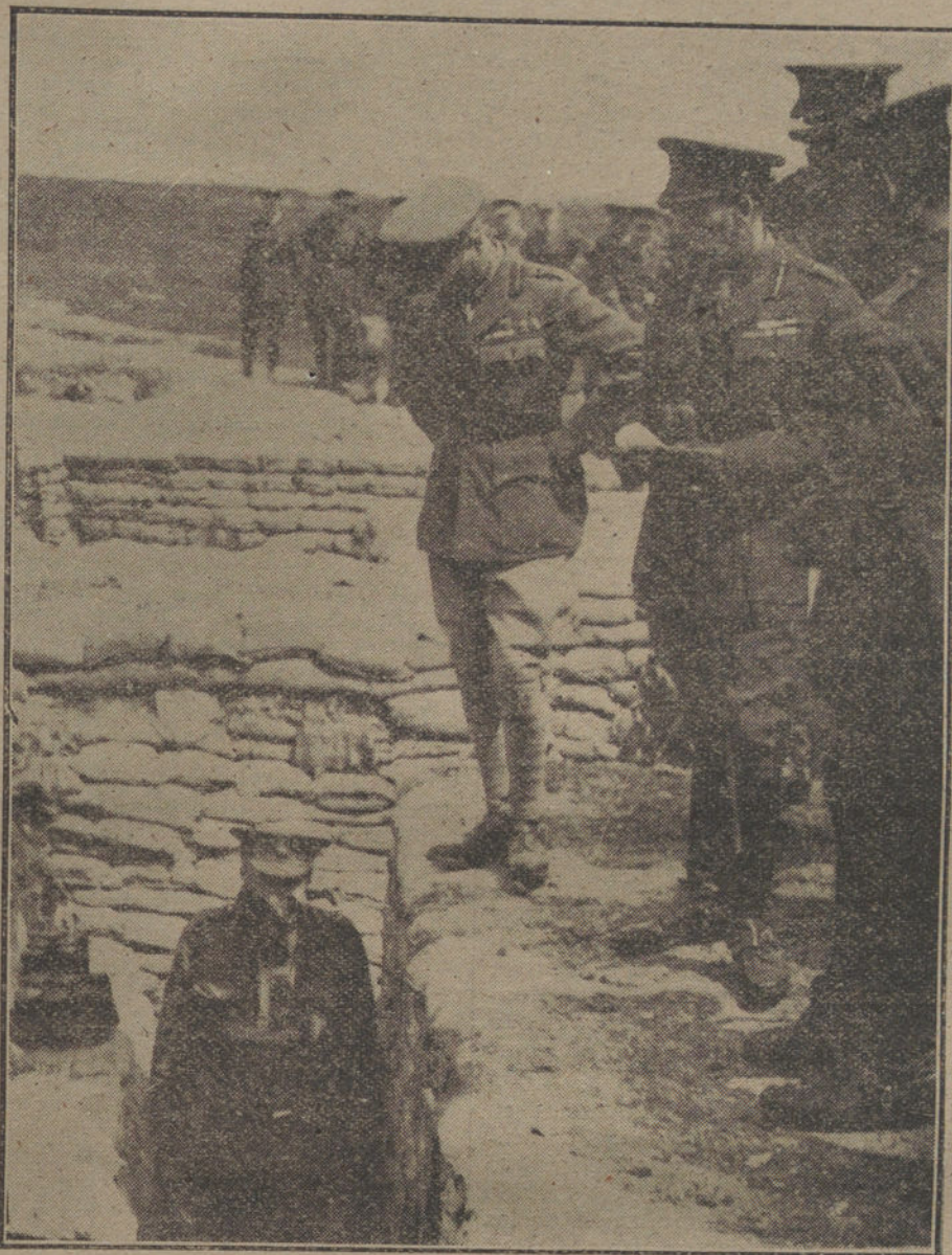
VIENDO LA GUERRA A DISTANCIA.—El Rey de Inglaterra contemplando un modelo de trincheras en un campo de instrucción. En la trinchera, un soldado con el equipo contra los gases asfixiantes.

Fué presenciado el fondeamiento por un público numeroso, que prorrumpió en salvas de aplausos.