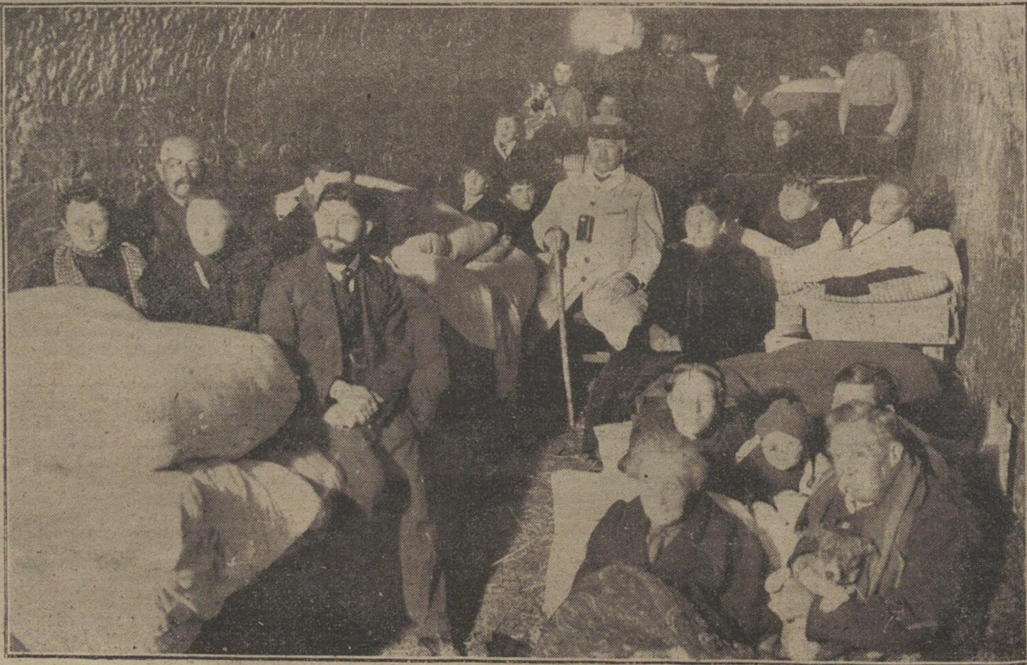
PRECAUCIONES EN FRANCIA. Vecinos de una localidad del frente, refugiados en un subterráneo.

INFORMES DE ORIGEN INGLES LONDRES (Radiogramas oficiales) «Desde medio día del 11 mejoraron las