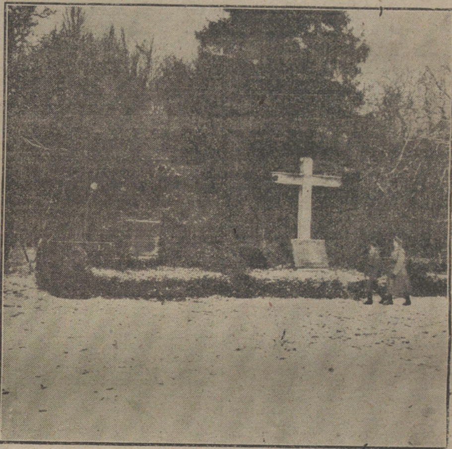
LAS VICTIMAS DE LA GUERRA.—Pequeño cementerio alemán con las tumbas de 12 aviadores franceses derribados por los alemanes, (Fot. MARTUS)

«Las cifras de pérdidas en una semana sola no constituyen una verdadera base para el pesimismo, ni para enhorabuenas; y nosotros no queremos insistir indebidamente. Pero cuando se da el caso de que durante las cuatro semanas de Marzo fueron hundidos 65 buques de más de 1.600 toneladas; 75 en Mayo; 67 en Julio y 66 en Agosto, pueden sacarse en justicia algunas con-