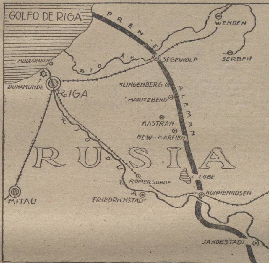
Croquis del avance alemán por Rusia.

Comunicado francés: «No ha habido ninguna acción de Intendencia durante el curso de la jornada. Actividad regular de la Artillería, sien-