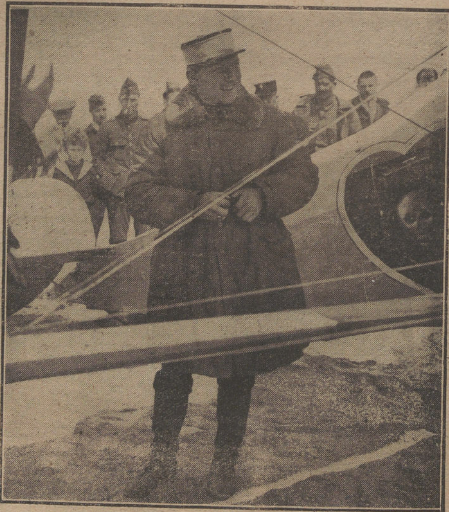
LA GUERRA EN EL AIRE.—El Príncipe de Teek disponiéndose á hacer una excursión en aeroplano sobre el frente belga.