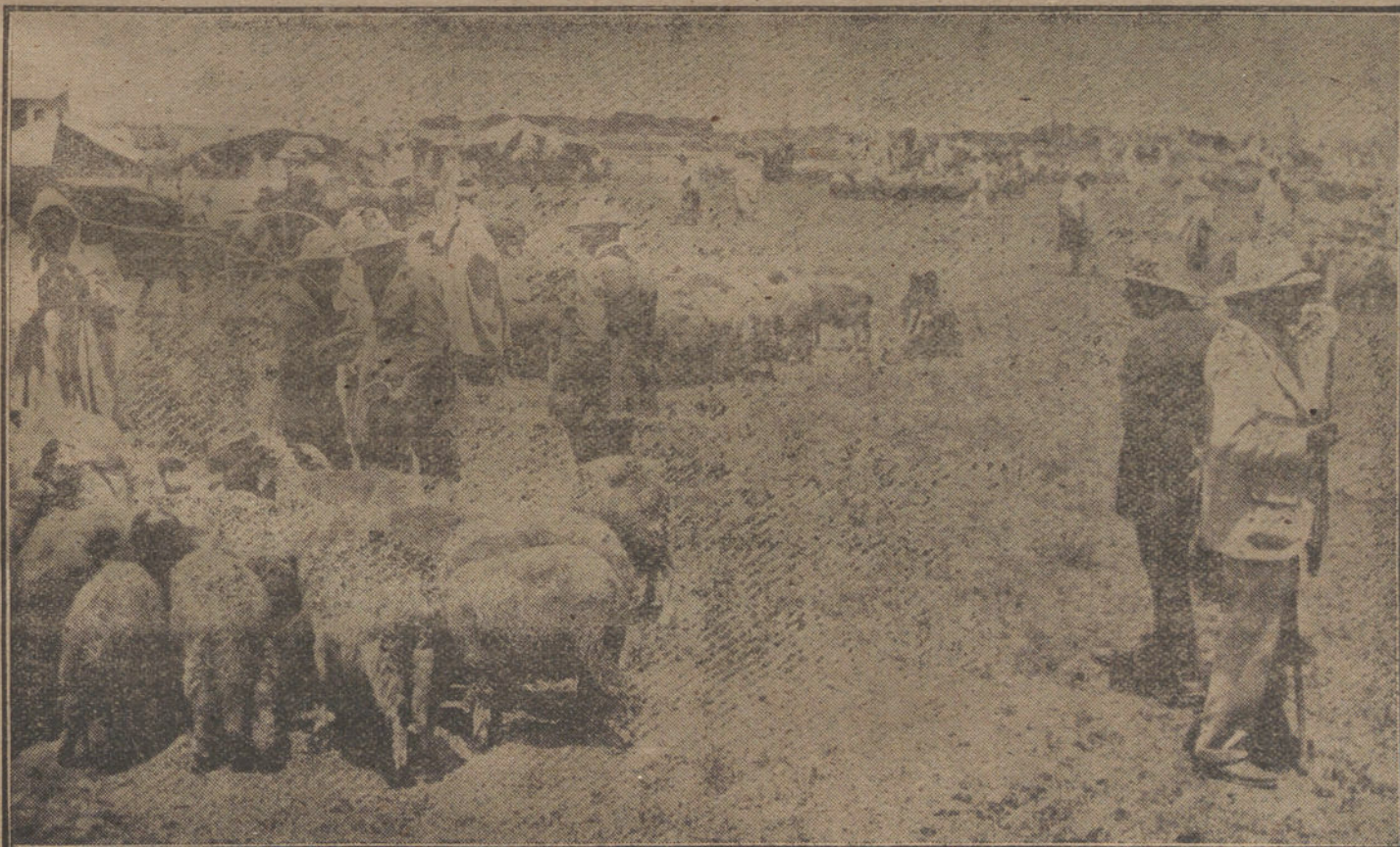
FRANCIA EN MARRUECOS.—El general Liautey, visitando un zoco de ganado en Rabat.

Pero más sorpresa aún produciría al espectador improvisado de tanta contradicción el reciente gesto de las potencias de la Múltiple, por el cual, naciones que se presentan como portaestandartes de la democracia, como Inglaterra, Francia y Norteamérica, niegan á sus conciudadanos, los demócratas, radicales y socialistas, el