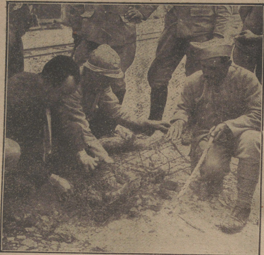
LA VIDA EN CAMPANA.—Soldados de las trincheras del Mause, construyendo cepos para defenderse de los reoñeros.

Esto dará á tus actos personales gran claridad y te hará ver que te sentirás libre y responsable ante el mundo y ante la Historia en el porvenir, y que tú mismo tendrás la posibilidad, largo tiempo anhelada, de decidir sobre su propio futuro ó de participar en ello, para lo cual tiene un positivo derecho. Al mismo tiempo proporcionarás á la