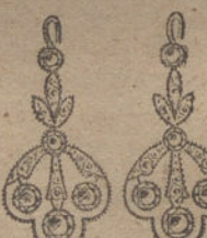
Núm. 10.—Diez brillantes y diamantes