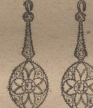
Núm. 5.—Cuatro brillantes y diamantes