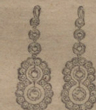
Núm. 9.—Diez brillantes y diamantes