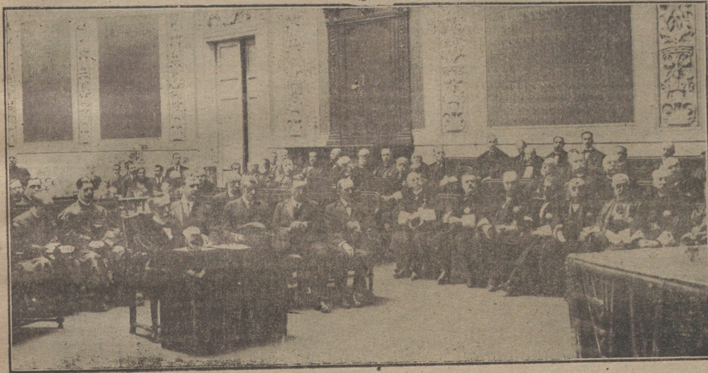
Aspecto del estrado del Paraninfo de la Universidad, durante la solemne apertura de los Tribunales.

En el Paraninfo de la Universidad Central se ha verificado, á las doce en punto de la tarde de hoy, el solemne acto de la apertura oficial de los Tribunales.