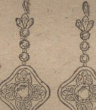
Núm. 11.—Ocho brillantes y diamantes