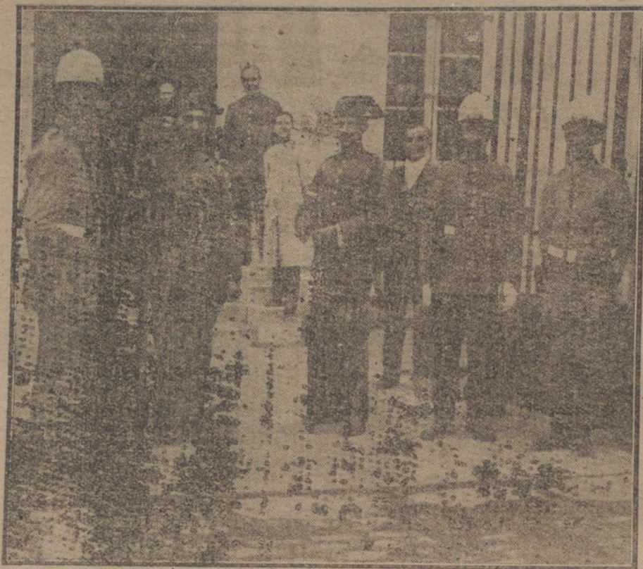
Fuerzas de la Guardia civil y del Cuerpo de Seguridad, custodiando la entrada de la Fábrica del Gas, de la que se ha incautado el Ayuntamiento.

CARTAGENA. A las cuatro de la tarde fondearon los sumergibles y el crucero «Extremaduras», sin novedad.