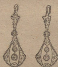
Núm. 2.—Cuatro brillantes y diamantes