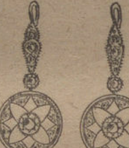
Núm. 7.—Cuatro brillantes y diamantes