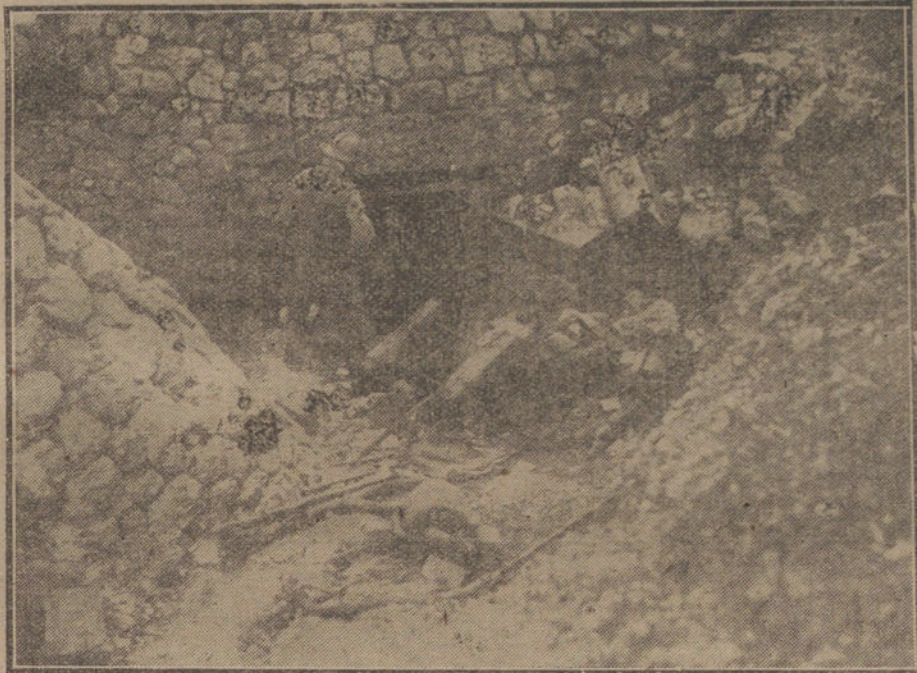
Entrada a una defensa subterránea del frente francés del Mosa.

La Artillería enemiga se ha mostrado hoy activa en el sector de Lens