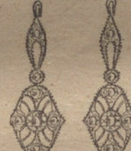
Núm. 6.—Cuatro brillantes y diamantes