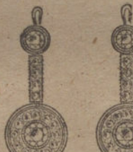
Núm. 8.—Cuatro brillantes y diamantes