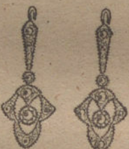
Núm. 4.—Cuatro brillantes y diamantes