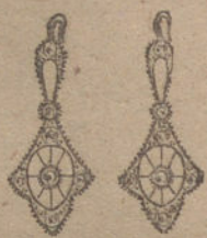
Núm. 1.—Dos brillantes y diamantes

Monturas de platino fino y oro de ley 18 quilates contrastado