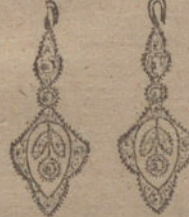
Núm. 3.—Cuatro brillantes y diamantes