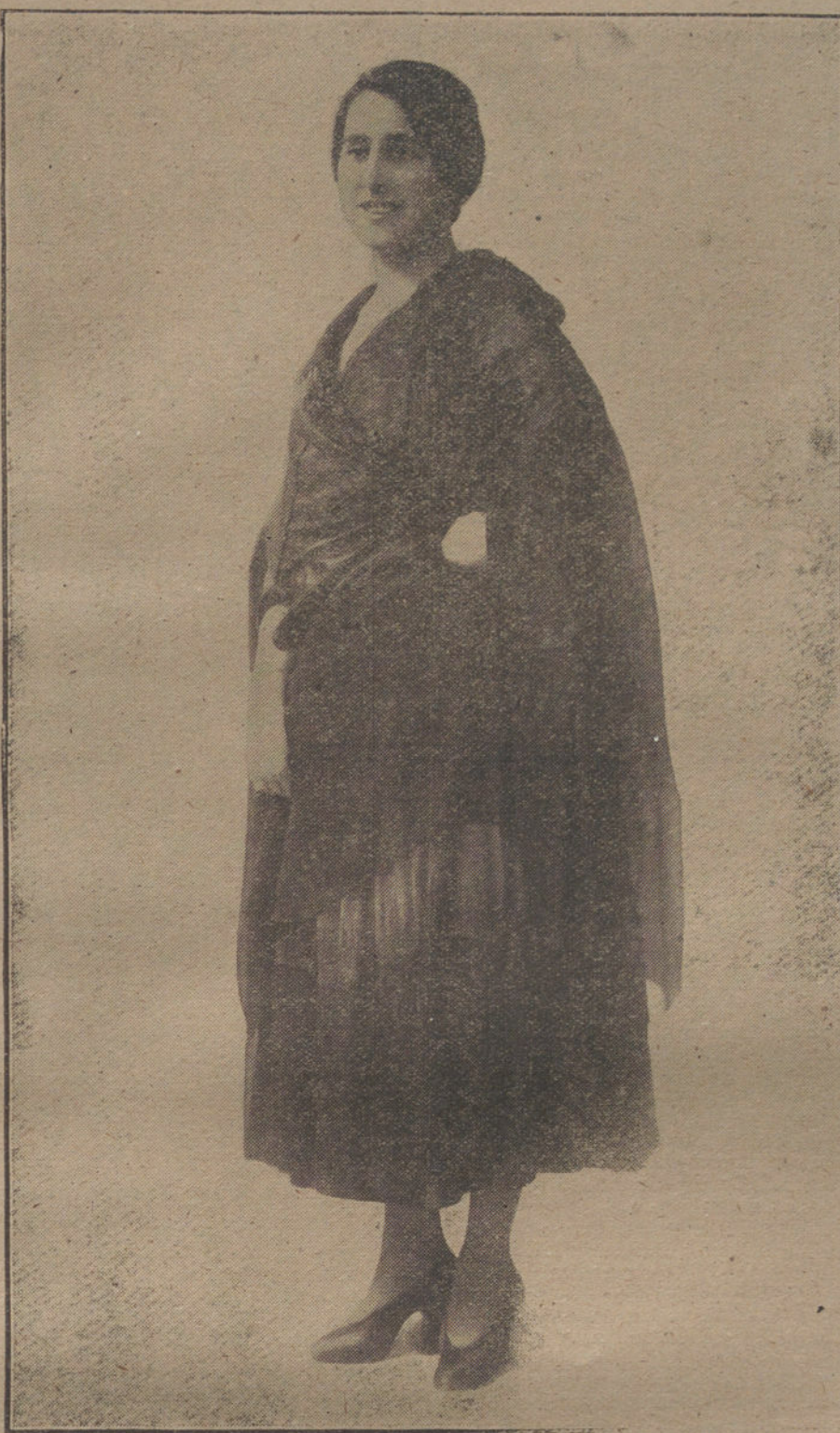
Capa de tafetán y gasas fruncidas, presentada por M. S. de la Opera Gó. mica.

Inmediatamente comenzaron las deliberaciones, reinando en la Asamblea gran entusiasmo y un admirable espíritu de unión.