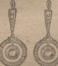
Núm. 12.—Cuatro brillantes y diamantes