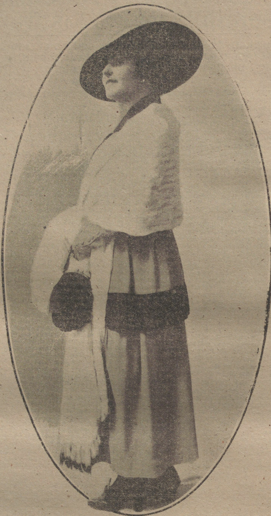
Traje sastre, confeccionado en tela fuerte y adornado con bandas de cintas enlazadas, modelo de la Casa Alba, de París.

teaméica. El aislamiento, contrario á todo derecho internacional, de Alemania del servicio ultramarino de información coarctado en natural la utilización de tal intermediación neutral y presenta la complacencia mostrada por un Estado neutral no como una violación del derecho, sino como un correcto atenuamiento á los principios internacionales.