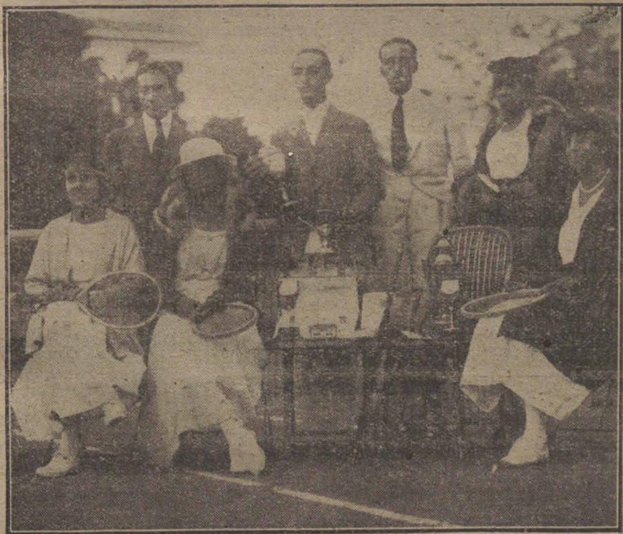
EL VERANO EN SAN SEBASTIAN.—Los vencedores en el campeonato de tennis.

Al enterarse el conde del Serrallo de la conducta de los referidos industriales los ha citado en su despacho para hoy, con objeto de hacerles un amistoso requerimiento, a fin de que rectifiquen su proceder y abonen a los soldados panaderos los jornales que devengaron, sin que pese en aquéllos la consideración de que por tratarse de militares deben percibir retribución inferior a la de los demás operarios.