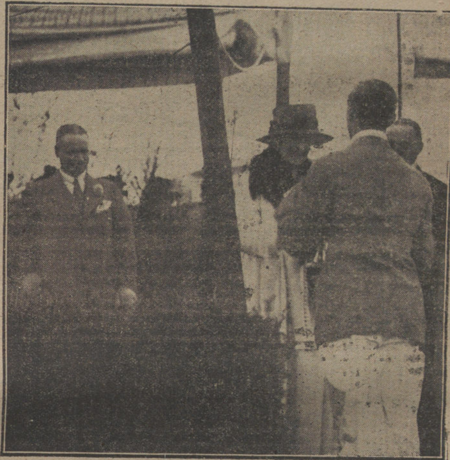
EL VERANO EN SAN SEBASTIAN.—S. M. la Reina Victoria, entregando las copas a los ganadores del campeonato de tennis.

Por eso, cuando sabemos que en determinadas regiones se rechazan ofertas que no proceden de capitalistas españoles, pedimos el aplauso público para esos esforzados compatriotas. Ello viene aconteciendo principalmente en Cataluña y en las Provincias Vascongadas, por la proximidad a Francia. He aquí un motivo más para enaltecer estas capitales fronterizas, de actividad recia y excepcional. Esta copiosa acción la demuestran visiblemente provincias como Barcelona, donde el 45 por 1.000 de sus habitantes son comerciantes e industriales; donde funcionan cerca de 14.000 fábricas, donde todos luchan y trabajan con deseo de mejorar, de perfeccionar, de inventar. Laboran como motores vivos saturados de espíritu económico moderno. Ojalá todos sintiéramos esa fiebre de trabajo y las energías se caldearan al rojo vivo, hasta lograr alcanzar la forma suprema de la reconstitución fecunda.