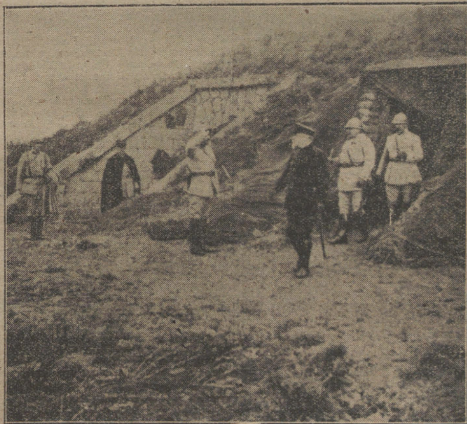
LOS JEFES DE ESTADO EN LA GUERRA.—El Presidente de la República francesa, durante su última visita al frente de Verdun, acompañado del general Guillaume.

El rótulo había sido leído y comprendido.