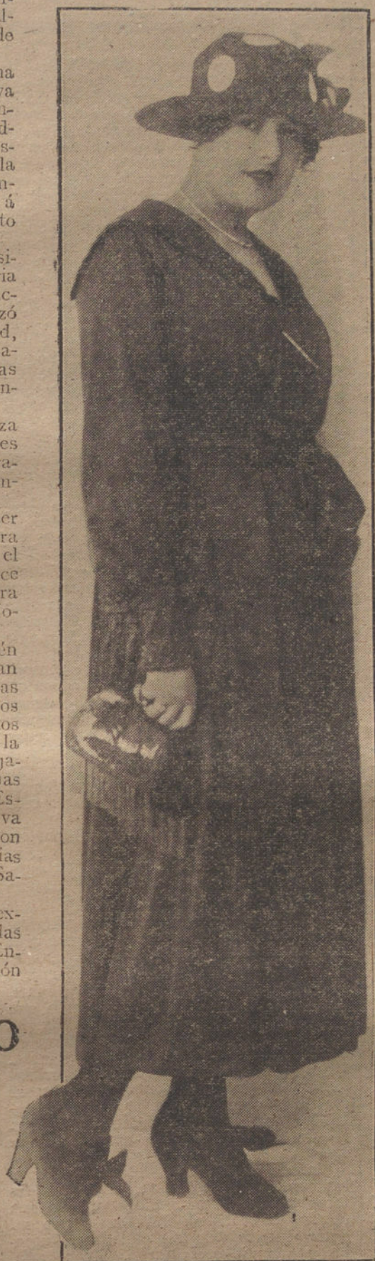
Traje de entretiempo, con faja de raso, modelo de la Casa Scaneve.