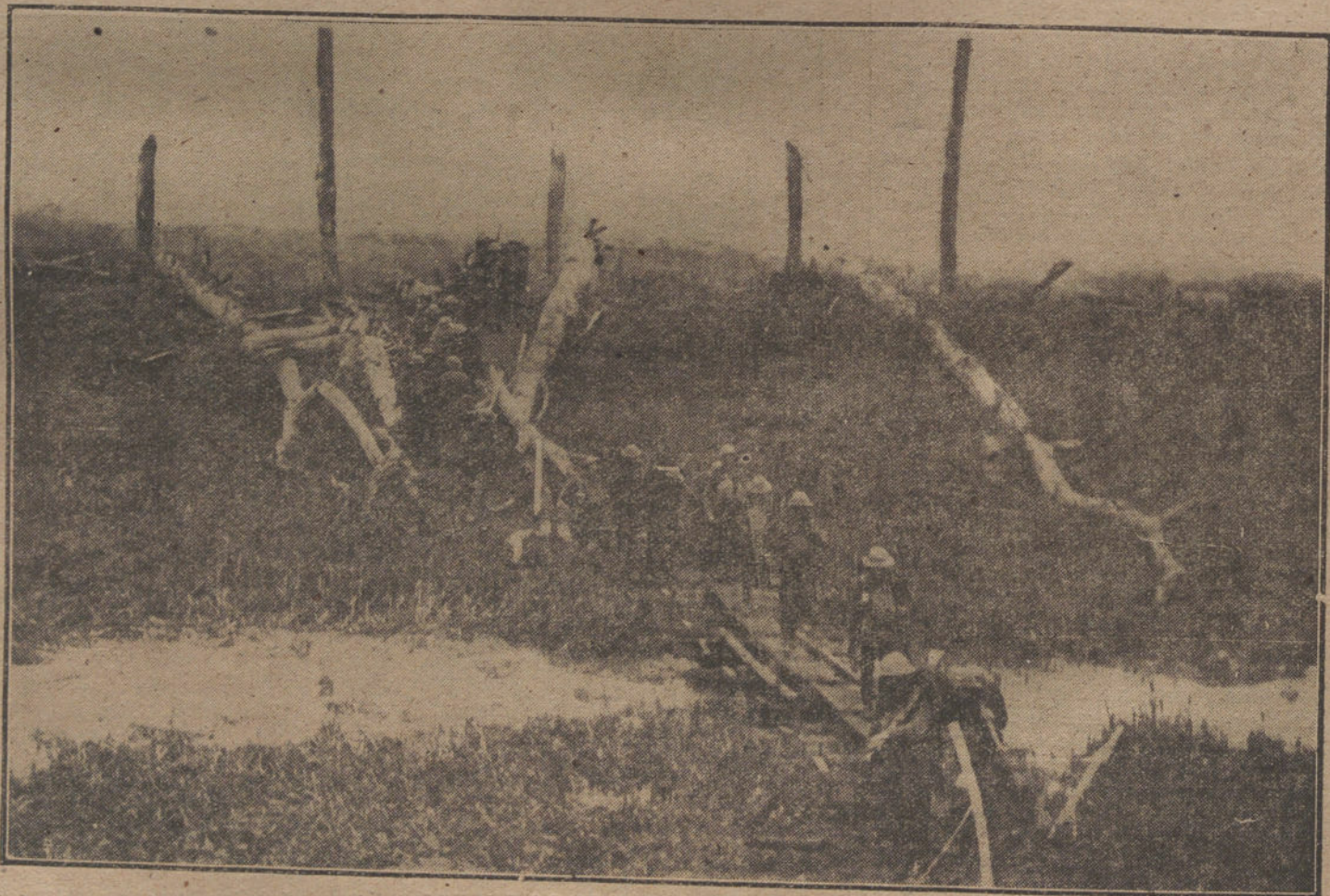
LA LUCHA EN FRANCIA. Tropas inglesas atravesando un pequeño río en el Norte de Francia.

VIENA (Radiograma del Korrespondenz Bureau). Comentando los do-