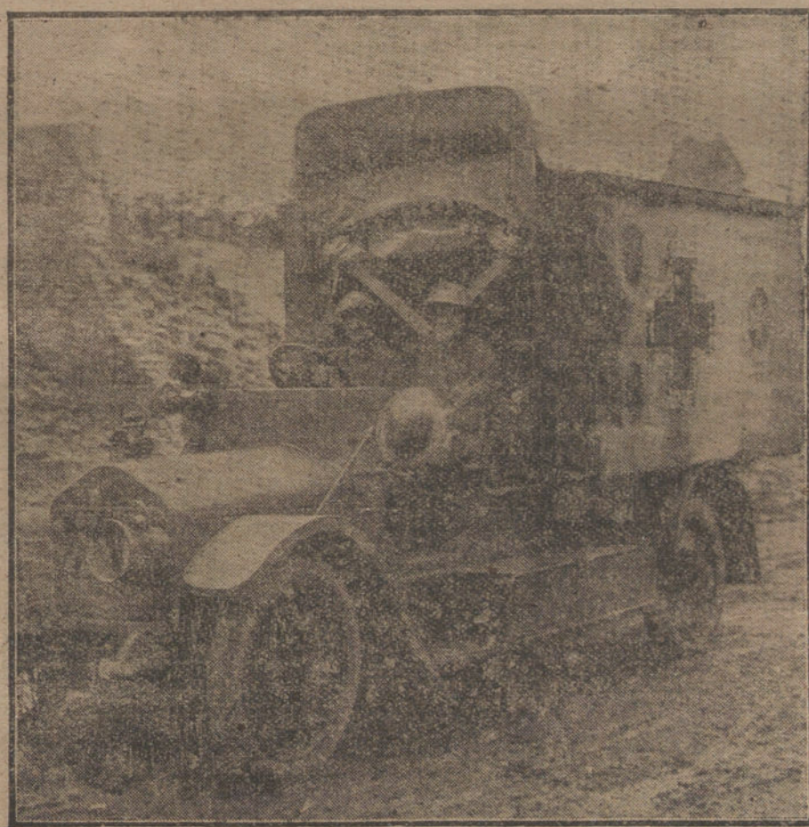
LAS NECESIDADES DE LA GUERRA.—Automóvil de la Cruz Roja inglesa, servido por mujeres.

El general Korniloff, con 23 generales y oficiales, que constituía su Estado Mayor