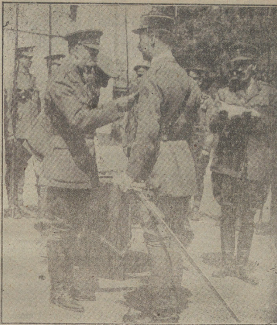
LOS JEFES DE ESTADO EN LA GUERRA.—El Rey de Inglaterra condecorando a un oficial de la Misión extranjera, en el frente inglés.

El viernes, 21, a las seis y media de la tarde, serán obsequiados con un «Vino de honor» los grandes maestros Conrado del Campo y Angel Barrios, autores de la partitura de «La romería».