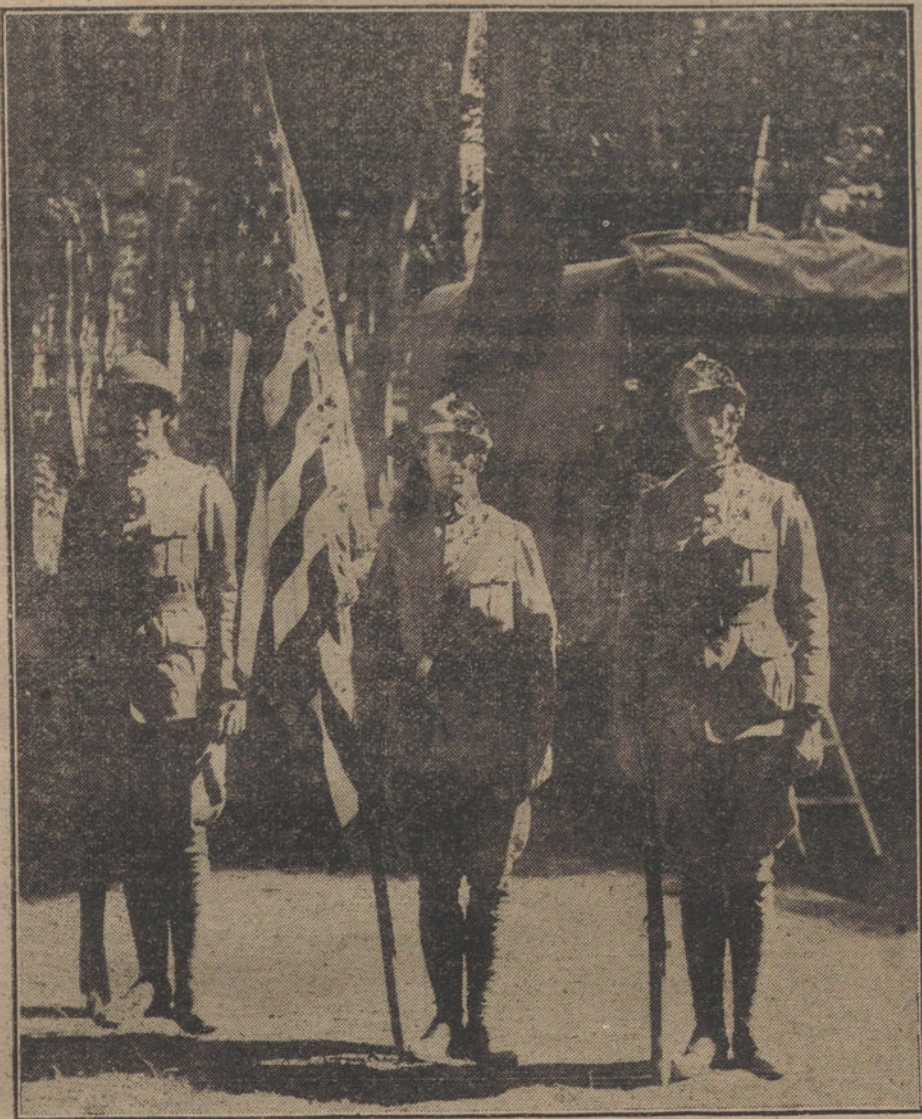
LOS NUEVOS FACTORES DE LA GUERRA.—Abanderados del primer Cuerpo expedicionario yanqui en el campamento del Marne.

viniente de sus bienes morales y materiales, y fuera del territorio del Imperio una libre competencia con naciones en igualdad de derechos y de consideraciones. El no trabado movimiento de las energías que luchaban entre sí pacíficamente en el mundo había llevado al más alto grado de perfección los más sublimes bienes de la humanidad. Un fatal encadenamiento de acontecimientos ha interrumpido bruscamente en 1914 una era de florecimiento llena de esperanzas, convirtiendo a Europa en un sangriento escenario de luchas. En aprecio a la importancia que corresponde al Manifiesto de S. S., el Gobierno imperial no ha reparado en someter a un examen serio y concienzudo los consejos en él contenidos.