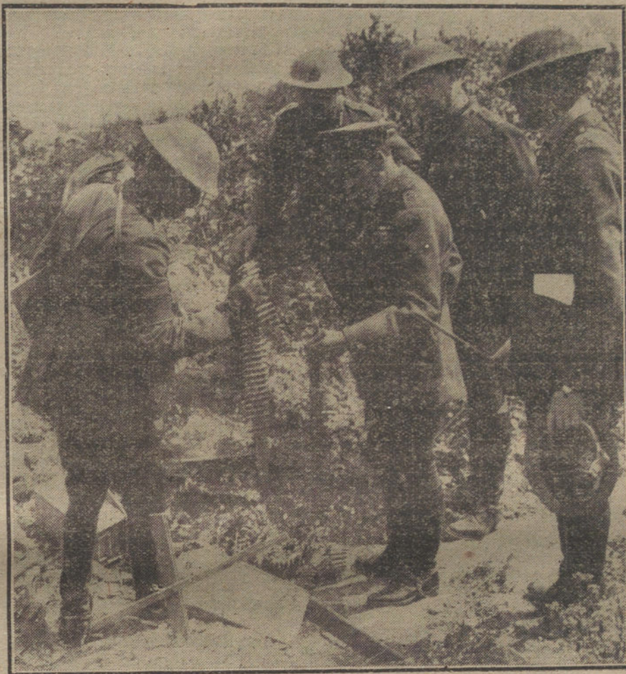
LOS JEFES DE ESTADO EN LA GUERRA.—El Rey de Inglaterra examinando las cintas de una ametralladora durante su visita al frente inglés.

Resulta, en verdad, ridículo que al término del verano, cuando después de una extrema pujanza, ingleses, belgas, portugueses, americanos y franceses puestos en ringla del Canal á los Vosgos, lanzando millones de quintales de metralla, no han conseguido avanzar ni tanto como lo que Hindenburg les dejara, al replegarse, al principio de la primavera; cuando al alba de todos los días, los alemanes, á la defensiva, salen de sus trincheras para atacar con éxito á sus infinitos adversarios; cuando Bélgica sigue en sus manos, mientras caen hojas y más hojas del almanaque, agotando las fechas del cuarto año de guerra; cuando aún se pondera en la propia Prensa francesa la importancia de Riga, conquistada por las tropas kaiserianas; cuando es notorio que, según las estadísticas, para Mayo de 1918 será angustiosa la situación de los aliados, por la escasez, entonces apremiante, del forraje de todas las banderas; cuando al empezar la suscripción del séptimo empréstito alemán, se comienza con una primera lista de 360 millones de marcos; ante ese panorama de la invencible resistencia de Alemania, M. Ribot, el terrible M. Ribot, aferrado á la retórica,