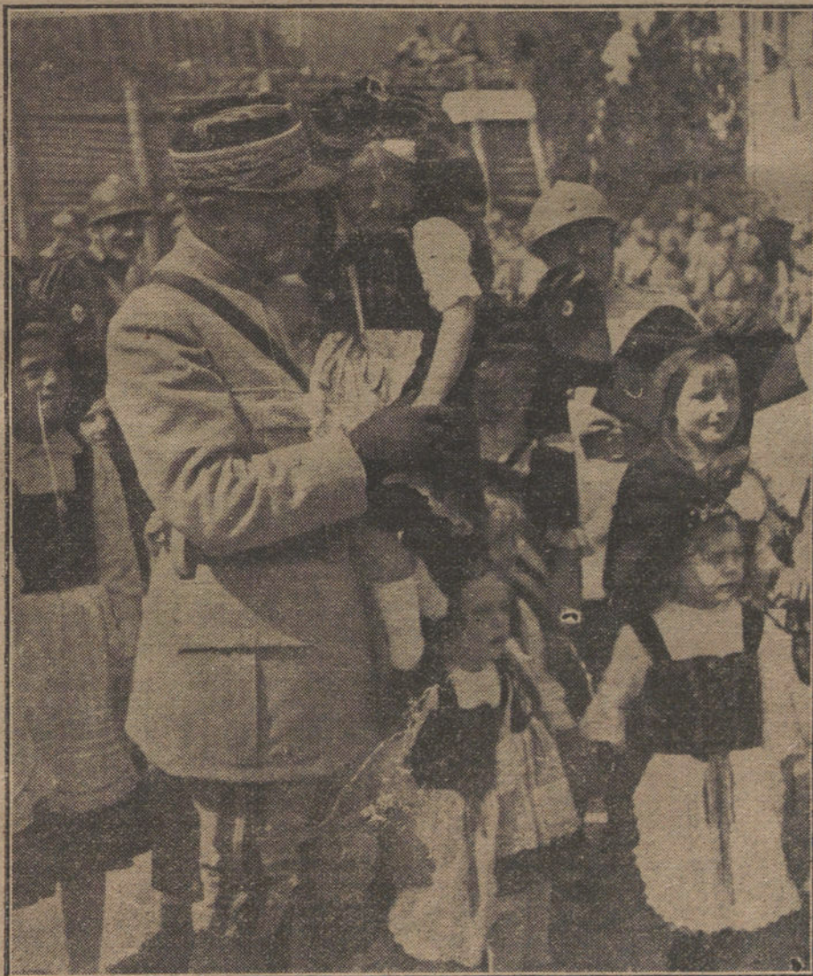
Un general francés saludando á las niñas alsacianas en una localidad de la frontera francesa.

—¡Bah! ¡Qué tontería! Preocuparse por una cosa así. Se iría á la cama, que al día siguiente quería madrugar.