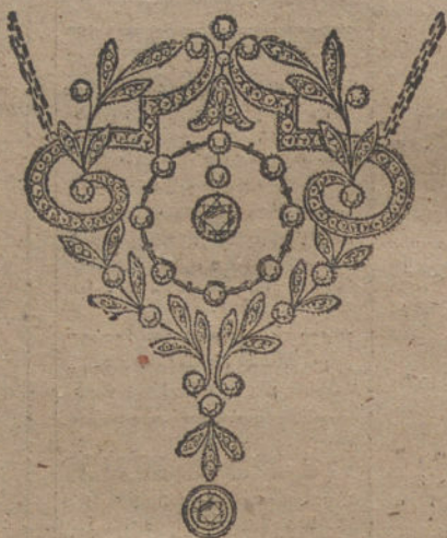
Núm. 3.—25 brillantes y diamantes. Ptas. 1.300.