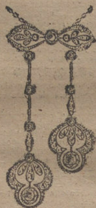
Núm. 4.—10 brillantes y diamantes. Ptas. 625.