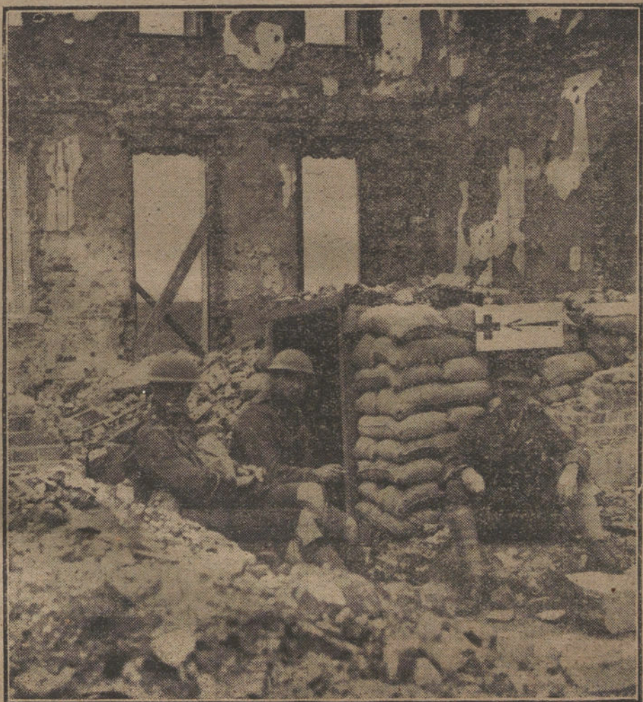
Puesto francés de observación en una casa derruida del famoso Camino de las Damas.