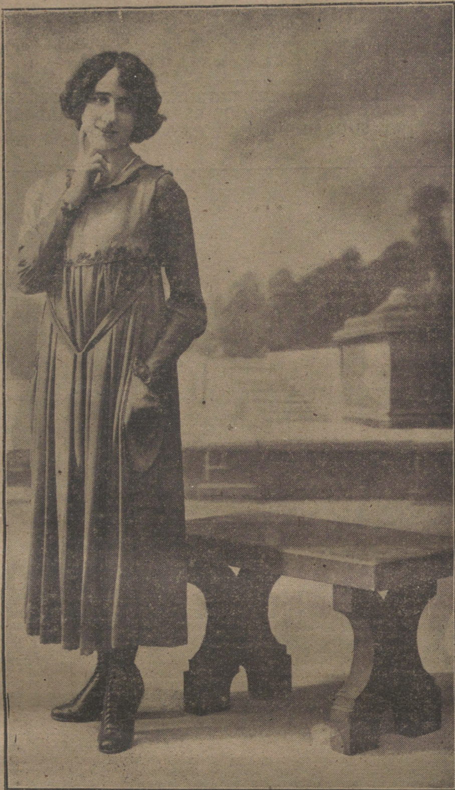
Sencilisimo traje-bata, adornado con cordón de seda.

los Gobiernos de Francia y España en lo que respecta al comercio y entrada de vinos españoles, bajo la condición impuesta por España de que el 50 por 100 de estos vinos sea destinado a las necesidades del Ejército y el resto al mercado.