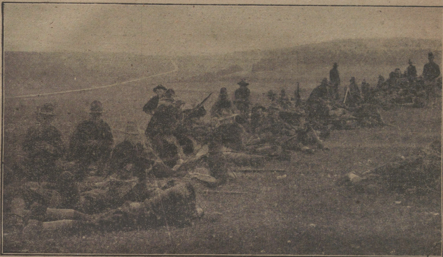
AMERICANOS Y FRANCESES.— Las tropas americanas en Francia, durante un descanso.

Frente a ese sentir franco y desparpajado, todo sinceridad, quieren las oligarquías norteamericanas hacer que prevalezca «à tout prix», y como si el mundo fuera imbécil, la cantinela de la democracia, la libertad y la justicia. Y, en efecto, para hacer presión sobre Holanda, en nombre, por supuesto, de la libertad, se impide que salgan los barcos holandeses, ya abarrotados de maíz. También se quiere construir a Suiza, y la Prensa oficial de Washington exclama con la mayor audacia: «No debemos exportar ni un grano de nada a Suiza, mientras este país no haya suprimido en absoluto los periódicos germanófilos.» ¡Y viva la libertad de pensamiento, y muera quien no piense igual que Mr. Wilson.