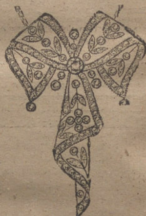
Núm. 10.—25 brillantes y diamantes. Ptas. 850.