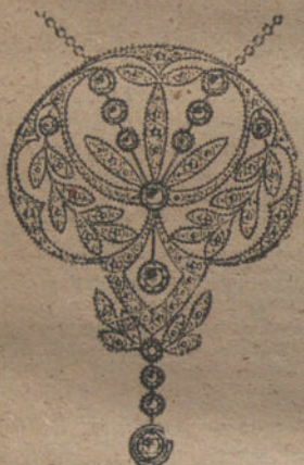
Núm. 6.—14 brillantes y diamantes. Ptas. 675.