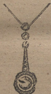
Núm. 9.—4 brillantes y diamantes. Ptas. 750.