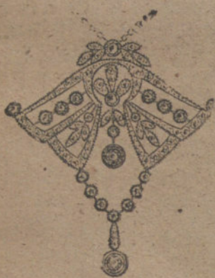
Núm. 1.—15 brillantes y diamantes. Ptas. 550