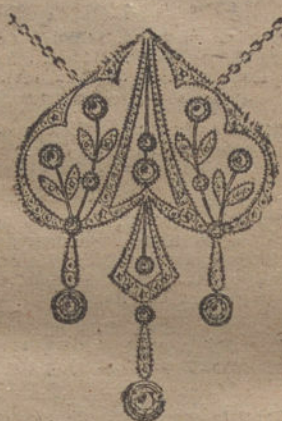
Núm. 5.—15 brillantes y diamantes. Ptas. 600.