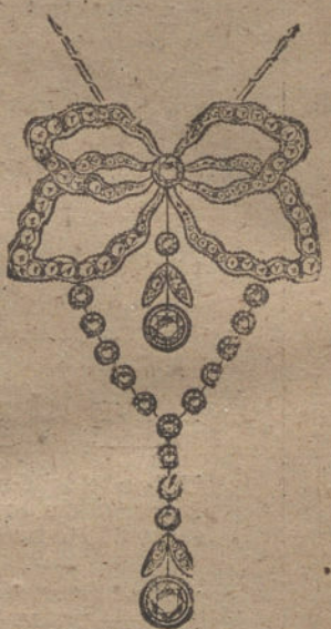
Núm. 17.—18 brillantes y diamantes. Ptas. 1.275.