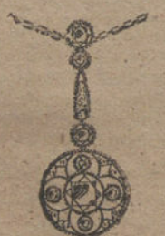
Núm. 14.—8 brillantes y diamantes. Ptas. 775.