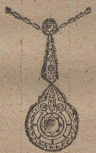
Núm. 16.—4 brillantes y diamantes. Ptas. 675.