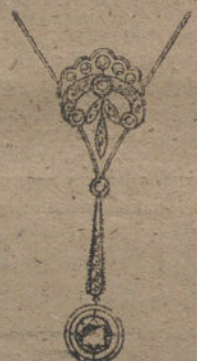
Núm. 7.—2 brillantes y diamantes. Ptas. 450.