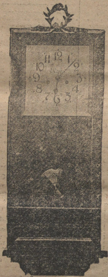
Núm. 32.332.--100 pesetas. Caja chapada de nogal ó de roble, de 86 centímetros de altura, con adornos de bronce.

Unico depósito de los relojes de alta "Precisión" M. Z. A.