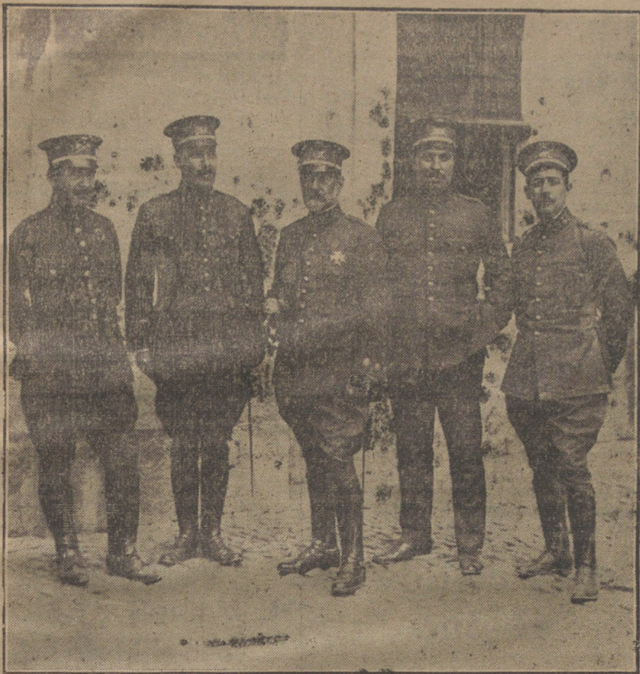
Coronel y oficiales del regimiento de León, a cuyo cargo ha estado todo lo relativo a organización de servicios, tanto de público como de Prensa. (Fot. VIDAL).

fo que la hoja dice, tanto en lo referente a las instrucciones como a los demás del texto, viene a corroborar el carácter pacífico de la huelga, pues que son manifestaciones del sentimiento de fraternidad que animaba a los obreros, consecuencia lógica del despertar nacional en que se manifiestan las aspiraciones y organismos de la nación. Es un llamamiento al recíproco respeto y simpatía con que deben verse aquellos que persiguen el mismo fin. Además, secuestrada la hoja antes de ser repartida, antes de empezar a disponer su distribución, sus efectos quedan anulados.