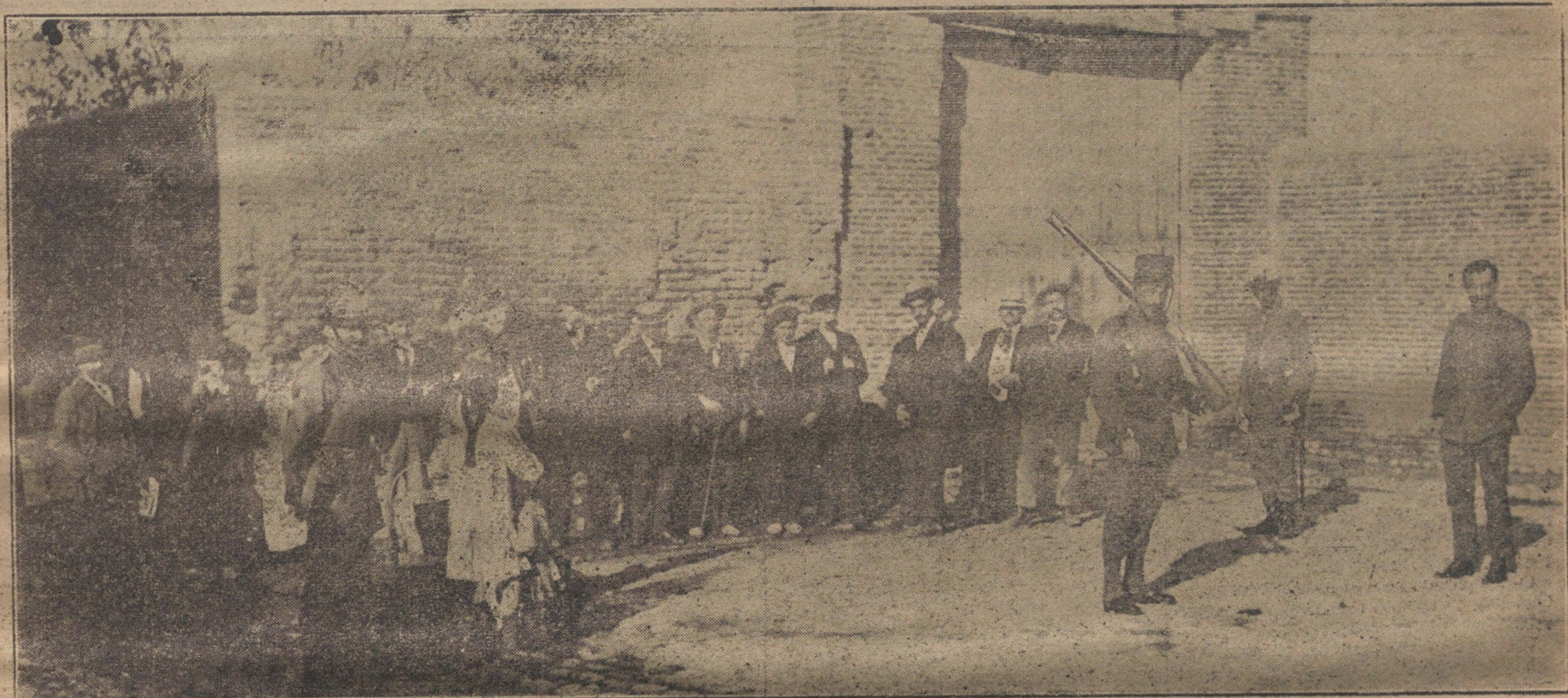
El público en la calle del Rosario, formando cola a la puerta del cuartel de San Francisco, para presenciar el Consejo de guerra.

Desde poco después de las nueve se congregó en las inmediaciones del cuartel de San Francisco numeroso público.