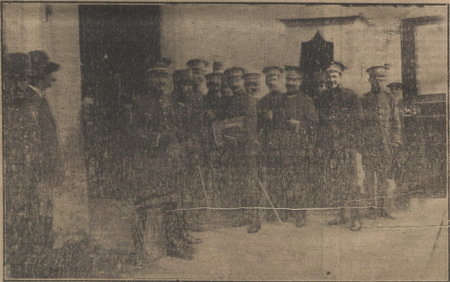
El Tribunal militar al llegar al cuartel de San Francisco para constituir el Consejo de guerra.