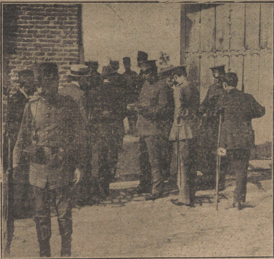
El público al penetrar en el cuartel, y á la puerta, la Comisión de jefes y oficiales que dirigen la entrada.