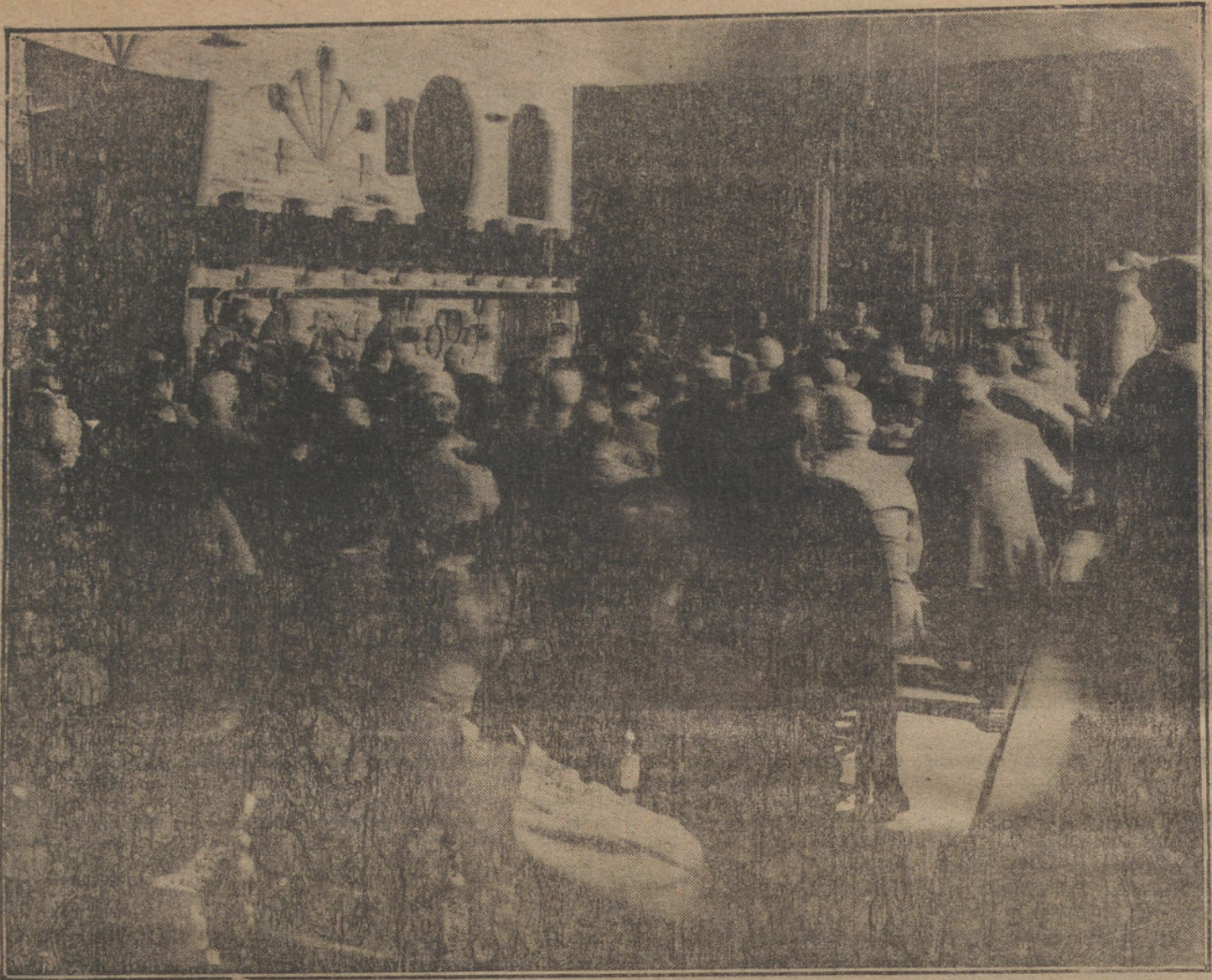
Vista de la sala donde se celebra el Consejo, en el momento de comenzar el acto.