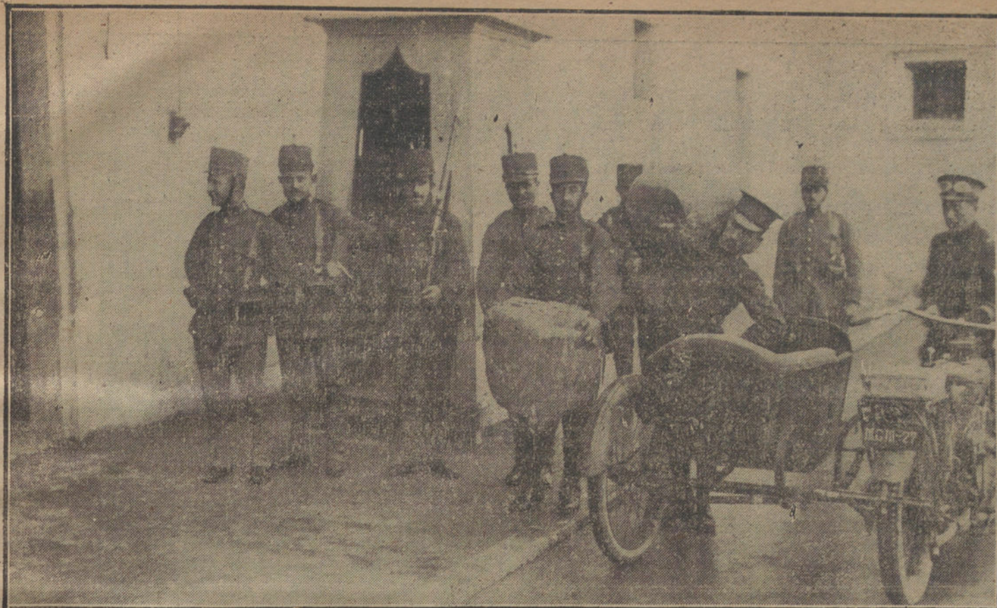
Llegada al cuartel donde se ha celebrado el Consejo, de los documentos que constituyen la prueba de la acusación.