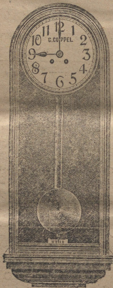
Núm. 12.000.--85 pesetas. Caja chapada de nogal ó de roble, de 88 centímetros de altura.

Estos modelos, en caja de caoba barnizada, cuestan 15 pesetas más