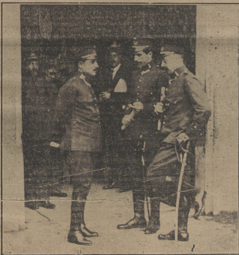
Los defensores de los procesados, antes de comenzar el Consejo.

Si materia delictiva encuentra el fiscal al examinar el Manifiesto é instrucciones del grupo director, por lo que se refiere á los fines perseguidos con el movimiento revolucionario, debe conceder suprema importancia al análisis y calificación de uno de los medios puestos en juego, el más peligroso para el Ejército, cuyo fundamento es la disciplina y, por ende, la jerarquía. Vacilante el brazo armado en sus deberes, desaparece toda garantía para el cumplimiento de las leyes, y el Estado carece de medios