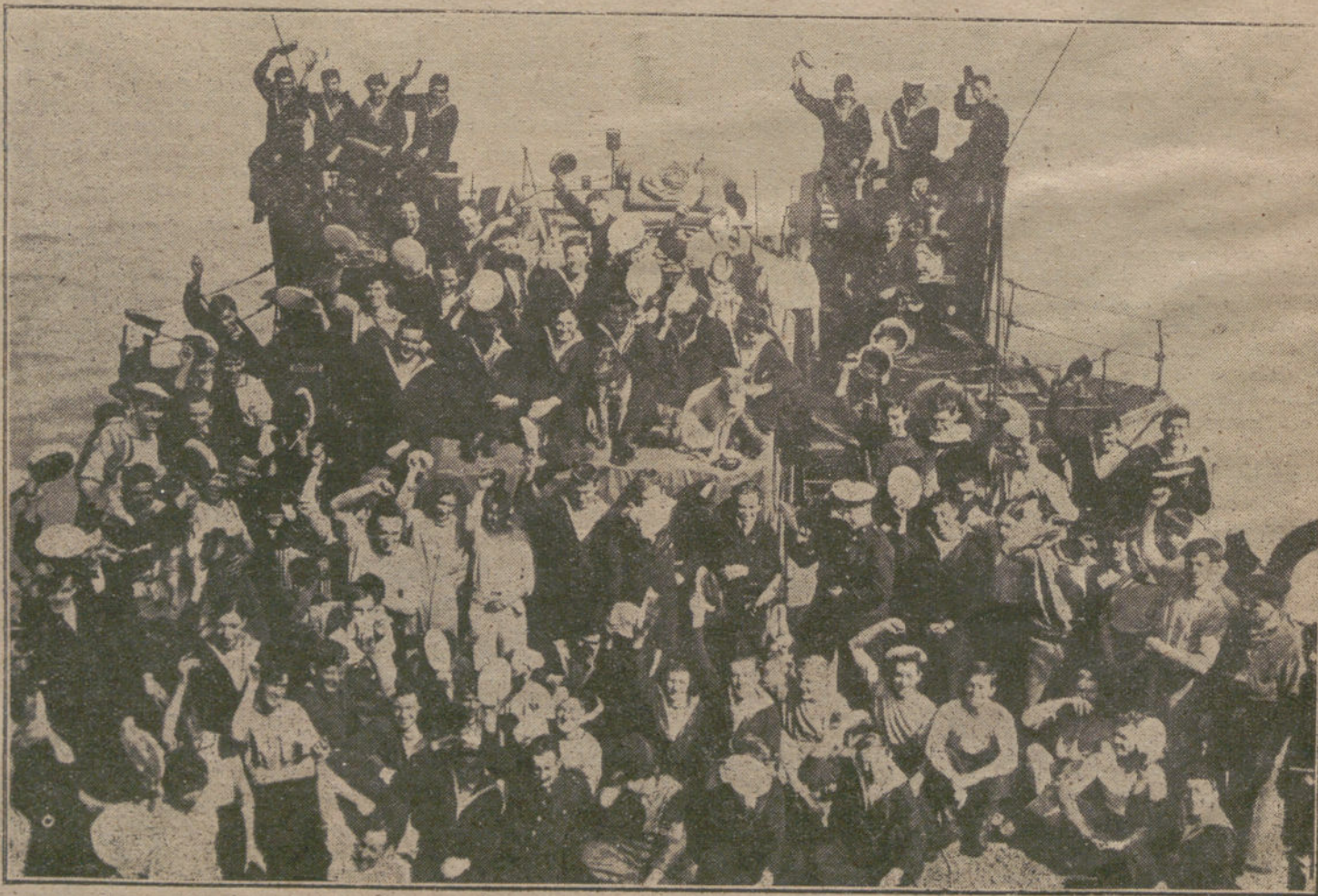
LOS NUEVOS FACTORES DE LA GUERRA. Marineros de la escuadra norteamericana á bordo de uno de los acorazados que los trae á Europa.

Entretanto, nuestro Gobierno común no había dejado, mediante reiteradas y persuasivas declaraciones, que todo el mundo podía oír, de expresar nuestra voluntad y la de los pueblos de la