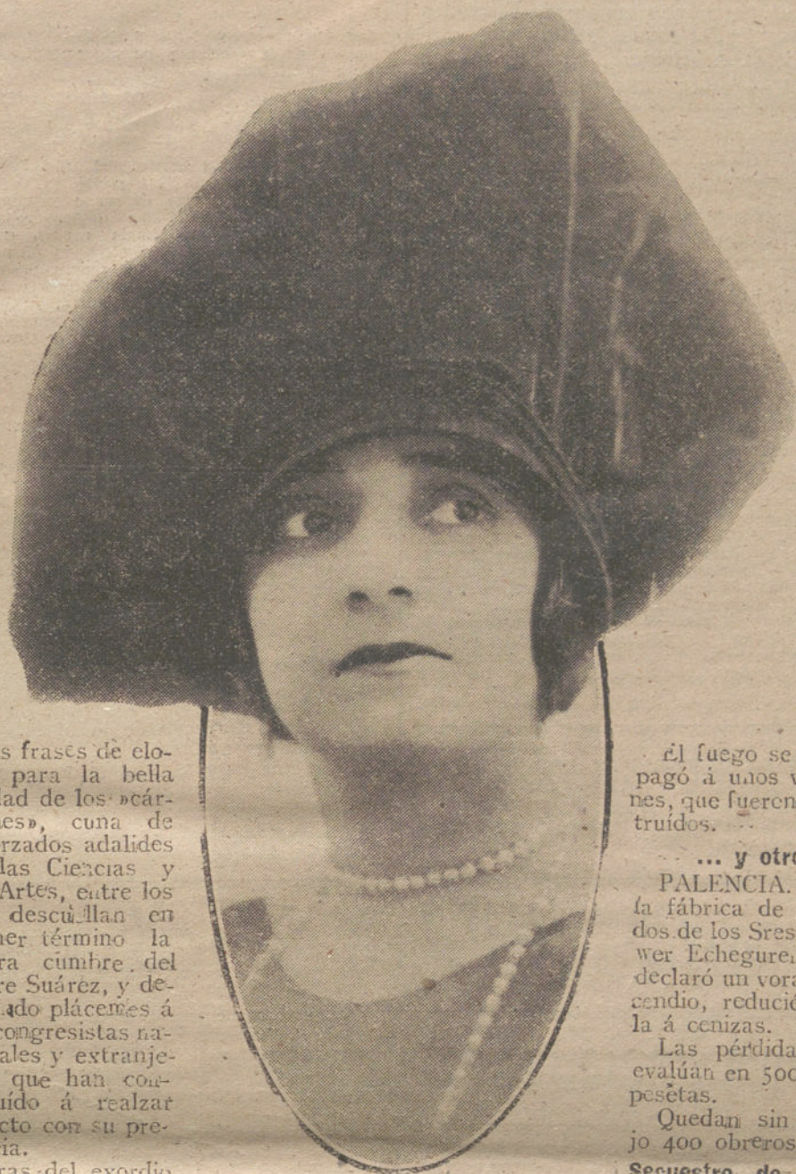
Gorra de terciopelo, estilo y modelo de la Casa Amalie, de París.

Monarquía austro-húngara de poner término a la efusión de sangre con una paz semejante a la que propone Vuestra Santidad.