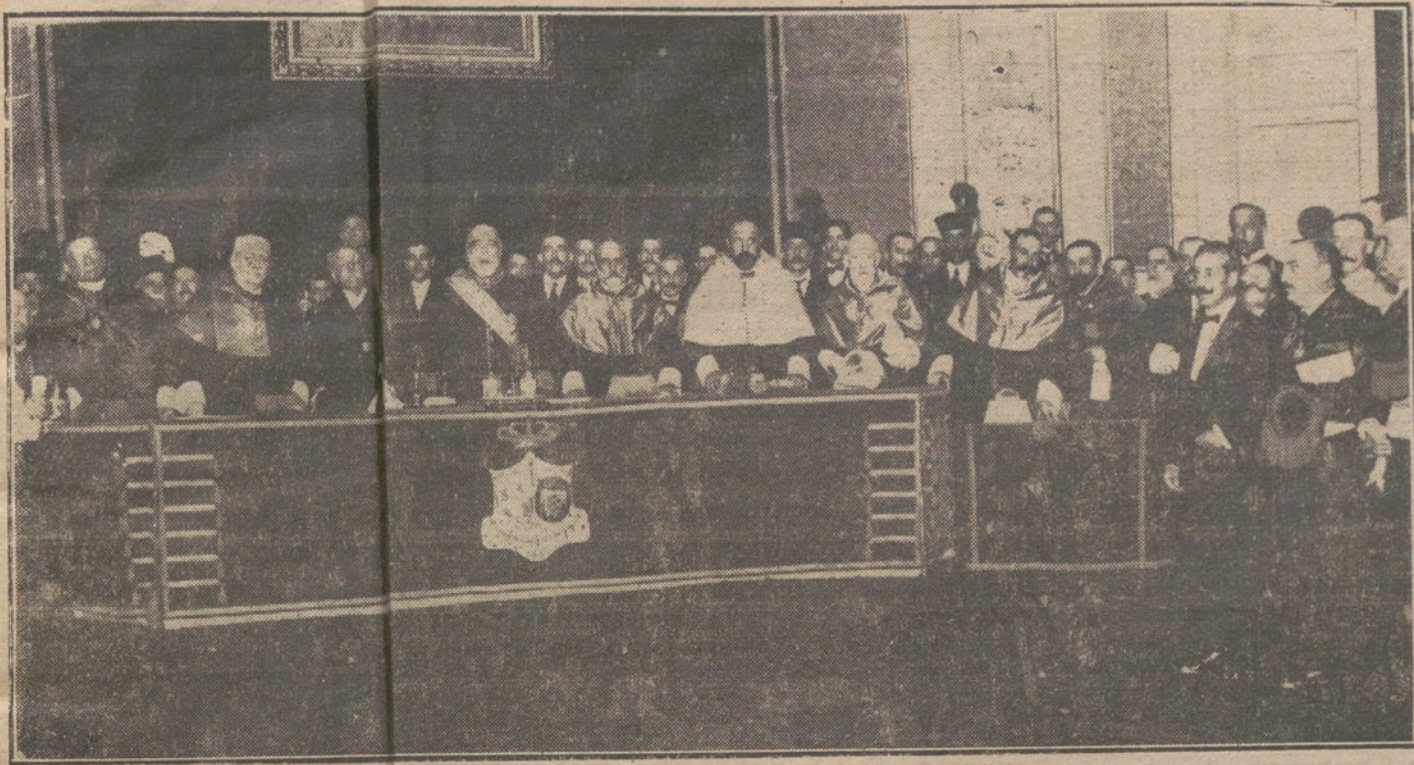
El ministro de Instrucción pública y el Claustro universitario, que han presidido esta mañana la solemne inauguración del curso.

Esta mañana, a las once y media se ha verificado en el Paraninfo de la Universidad Central la solemne apertura de sus estudios para el curso de 1918 a 1919.