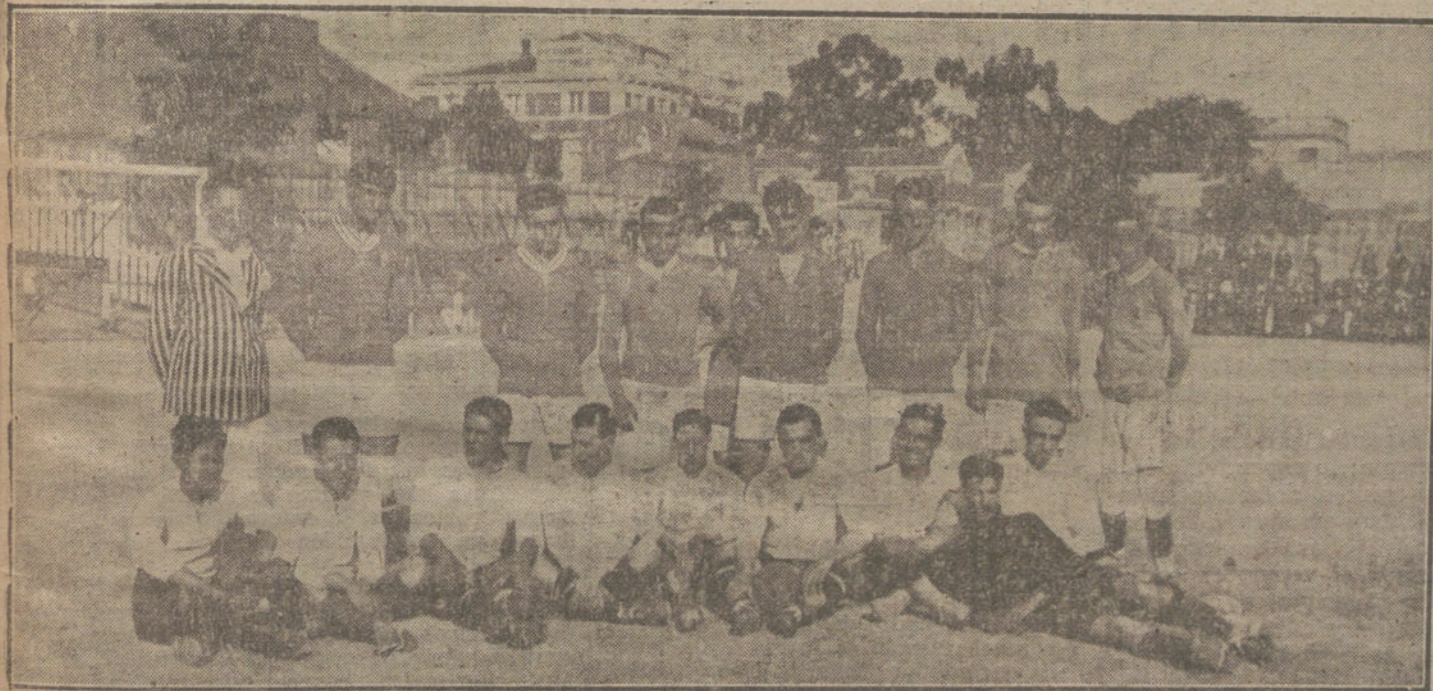
Los equipos A y B, de selección, de segunda categoría, que jugaron ayer un interesante partido a beneficio de la Asociación de la Prensa.