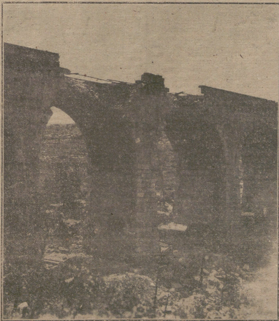
LOS DAÑOS DE LA GUERRA.—Destrozos causados en un puente del Norte de Francia.

El grado de consistencia y popularidad—no populachismo—de un Gobierno, se mide por la cantidad de figuras poéticas que emplea para comunicarse con el país. A veces—como ahora ocurre en España—entre la opinión del pueblo y la oficial media un tan considerable número de artificios, que se puede asegurar que el Gobierno es demasíadamente aficionado a la