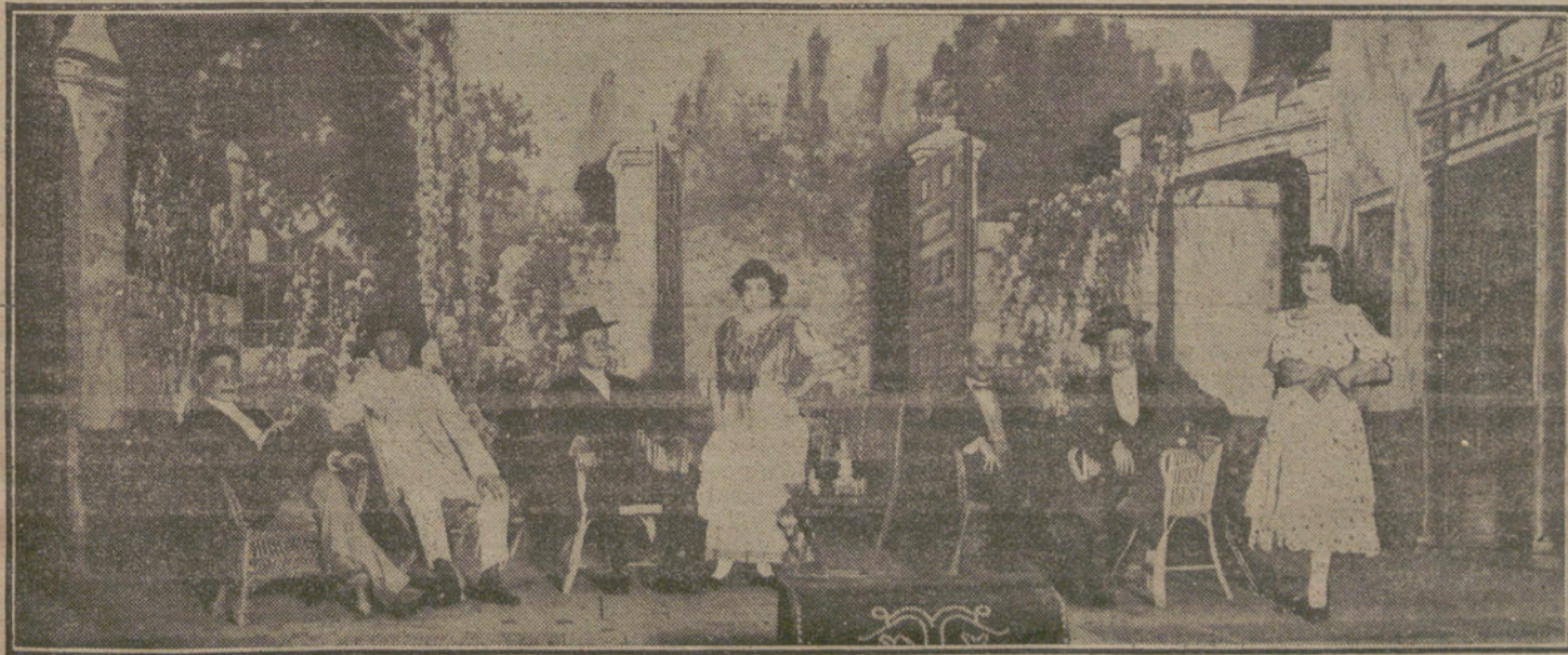
Una escena de «La primera de feria», obra que se estrena esta noche en el teatro de Novedades.

«Vistos los precedentes escritos y certificación que se acompaña, para resolver con debido acierto la cuestión jurisdiccional en los mismos iniciada, y sin prejuizar con ello el fondo de la misma, reclámese en atenta comunicación al Consejo Supremo de Guerra y Marina, á fines de justicia, relación exacta de su resolución, ordenando que los Tribunales militares