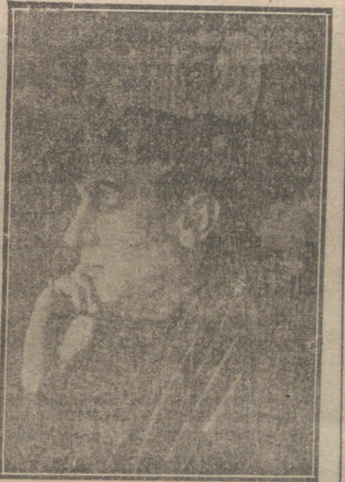
JUDEA, protagonista de la soberbia novela cinematográfica que se estrena el domingo en el Gran Teatro.

—Idem general de la primera brigada de la décimocuarta división, al general de brigada D. Felipe Navascués y Garayoa, que se halla de cuartel.