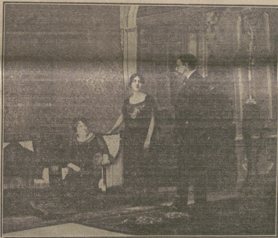
Una escena de «La mujer sin importancia», obra que se ha estrenado esta tarde en el teatro de la Princesa.

Si á todo esto se añade que por no haberse preocupado los Gobiernos desde 1914 acá de realizar una enérgica y salvadora política sabia, acometiendo el magno problema de los transportes, los productos del suelo y del subsuelo se estancan, produciendo la embofa en la economía del país, se comprenderá la desesperanza de la nación, amordazada por los políticos del corro, y el espantoso invierno de escasez y carestía que nos amenaza, si Dios no pone remedio, y así puede