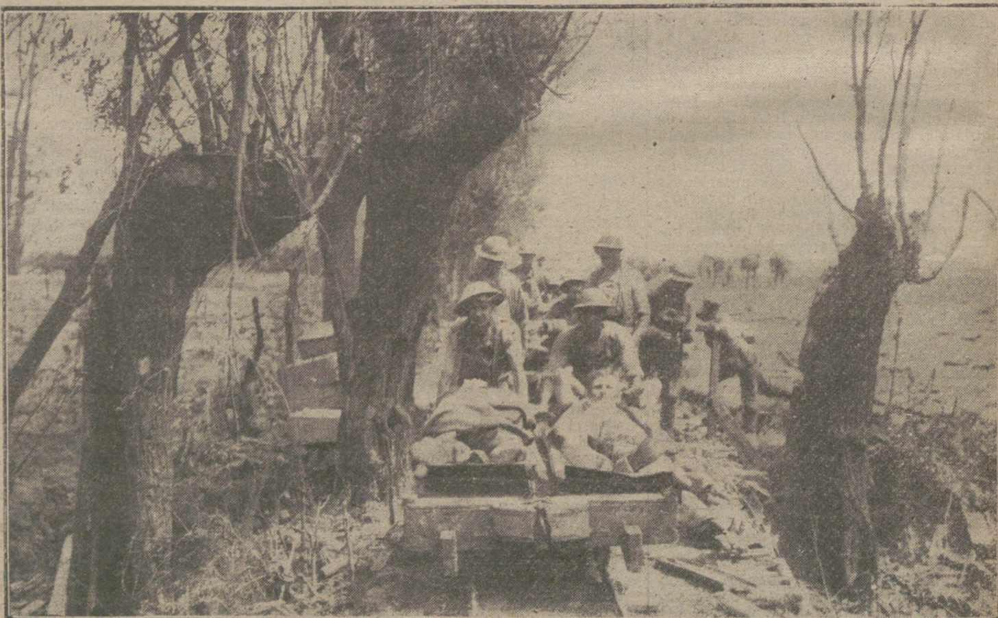
LAS VICTIMAS DE LA GUERRA.—Conducción de heridos desde la línea de fuego a las ambulancias.