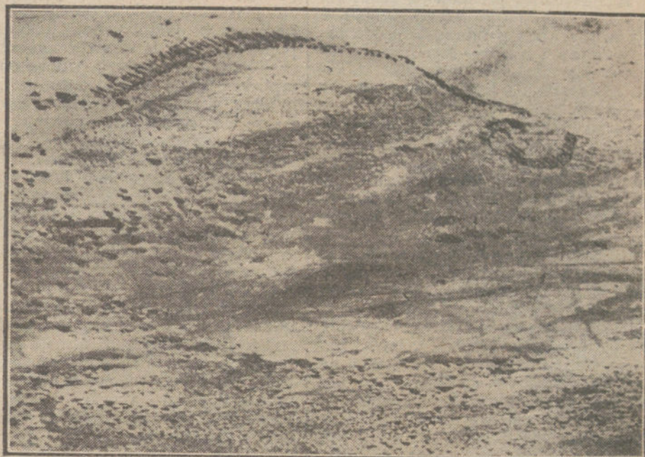
LA LUCHA EN ORIENTE.—Avance de tropas turcas después de un victorioso combate cerca de El Katia. En la parte de abajo, columna de camellos en marcha; en el centro y en la derecha, Infantería.

previsión de nuestra política sabría descubrir un medio de que el hecho no tuviera consecuencias para la tranquilidad de nuestra zona. Si lo segundo llegara a suceder desgraciadamente, la traición podría ser castigada de una manera tan severa que sirviera de ejemplo a todas las kabilas.