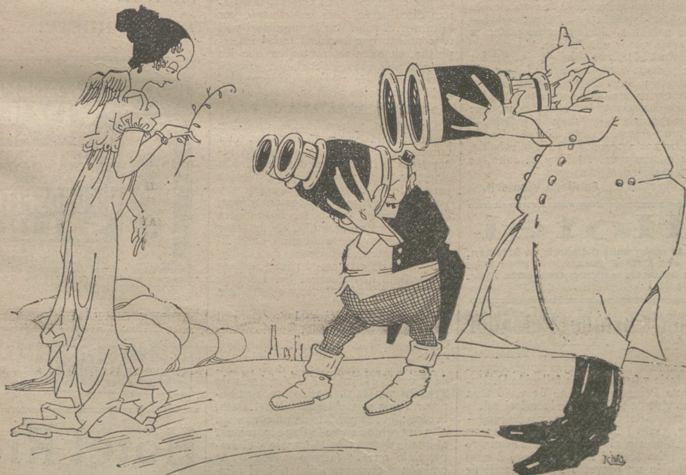
MIRANDO A LA PAZ

ALGECIRAS. Llegó a ésta el duque Pedro de Orleans, hospedándose en el Hotel Roma-Cristina.