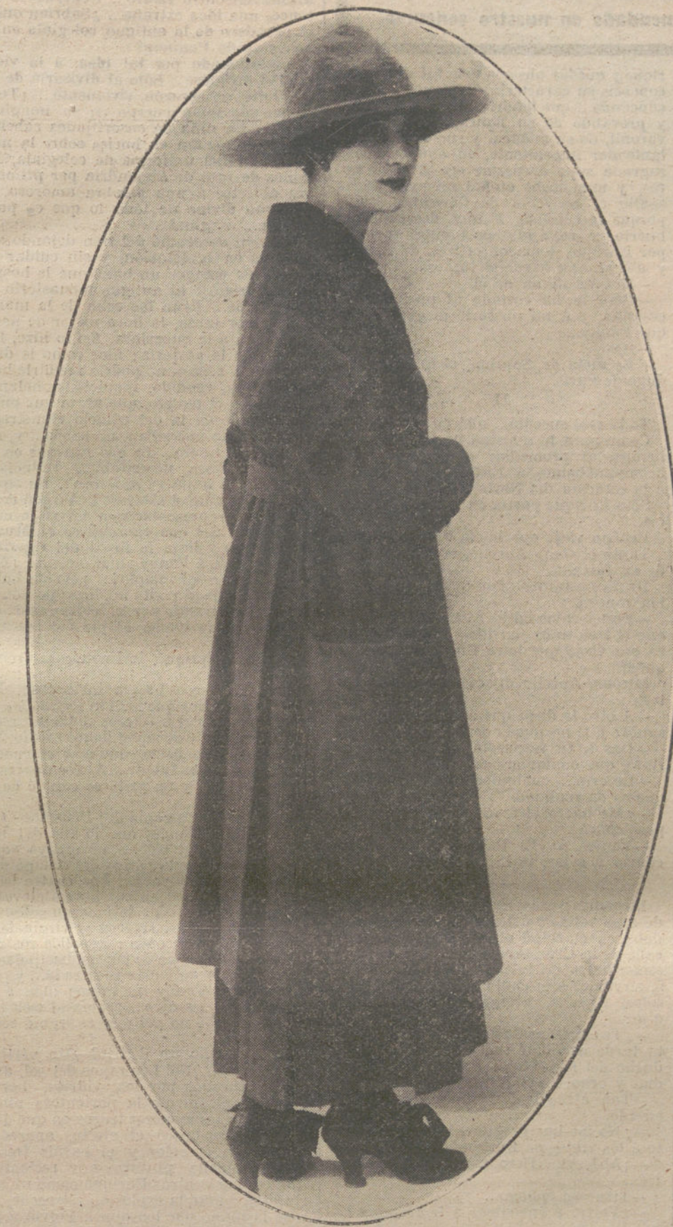
Abrigo para señora, modelo de la Casa André.

píldoras y jarabes, y logró volverlo á la vida. Actualmente ese enfermo se encuentra por completo restablecido y su peso ha aumentado en los últimos seis meses 10 kilos.