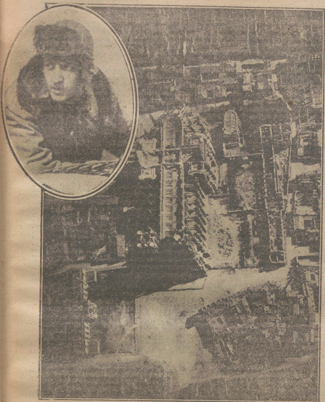
El bravo aviador francés, capitán GUYNEMER, que después de derribar en noble lucha 54 aeroplanos enemigos, ha sido muerto en combate con el piloto alemán Wissemann.—Fotografía de Reims, tomada por Guynemer en uno de sus últimos vuelos.