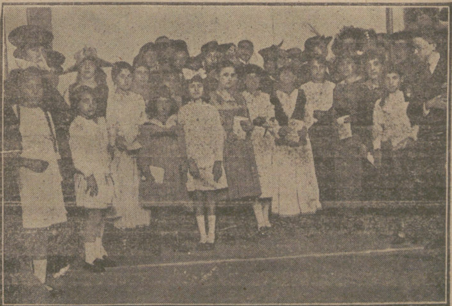
EN EL CENTRO IBERO-AMERICANO DE CULTURA POPULAR FEMENINA.—Grupo de alumnas que han obtenido premio en el curso pasado.

Se impone una política prohibitiva en orden á la salida de artículos. Los que sobren hay que procurar canjearlos por