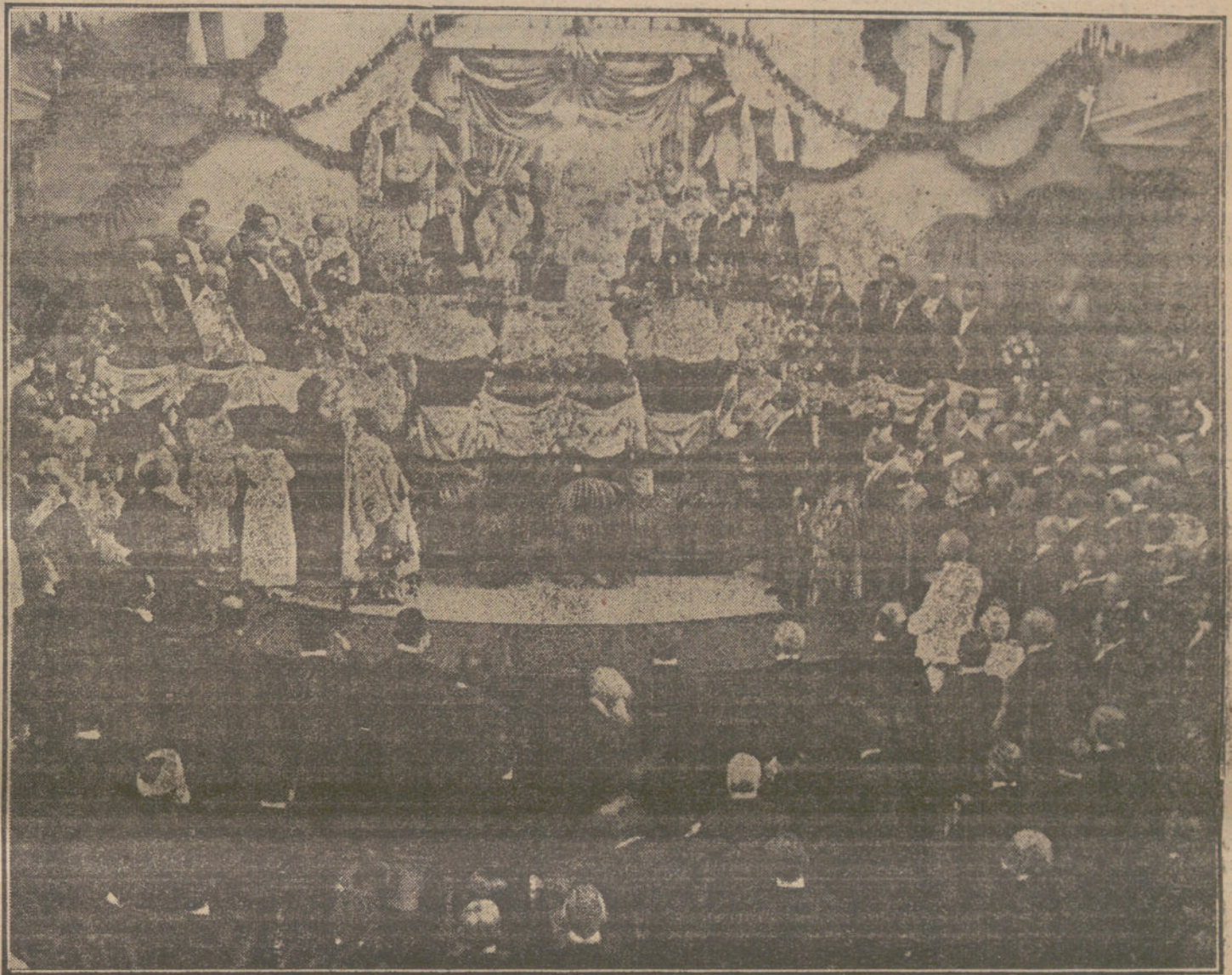
EN ATENAS.—Primera reunión de los diputados griegos para elegir la Mesa.—El Rey pronunciando su discurso inaugural.

Cada pie de suelo europeo vale más que centenares de kilómetros cuadrados de territorios coloniales, porque cuando se deja de ser potencia fuerte y autónoma, ¿de qué sirven las colonias, si se han de perder, tarde ó temprano? ¿Cuánto territorio colonial del que poseen de antiguo darían los ingleses y sus aliados, si pudieran rechazar á los alemanes hasta sus fronteras! Pero, por lo visto, de esto no son capaces. Más de medio millón de kilómetros cuadrados de territorios europeos siguen firmemente en manos alemanas, y los conservarán hasta que venga la hora de la paz, mientras que la Entente, con toda su pujanza, con la ayuda del mundo entero, apenas si posee unos ocho mil kilómetros. Cuando llegue el momento de valorar, todavía van á ser pocas las colonias alemanas, y tendrán los aliados que dar algo de las suyas. Y si no, al tiempo.