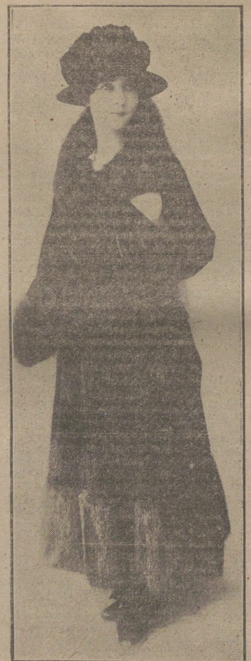
Elegante abrigo de pieles y sombrero, creaciones de estos días de la Casa André.