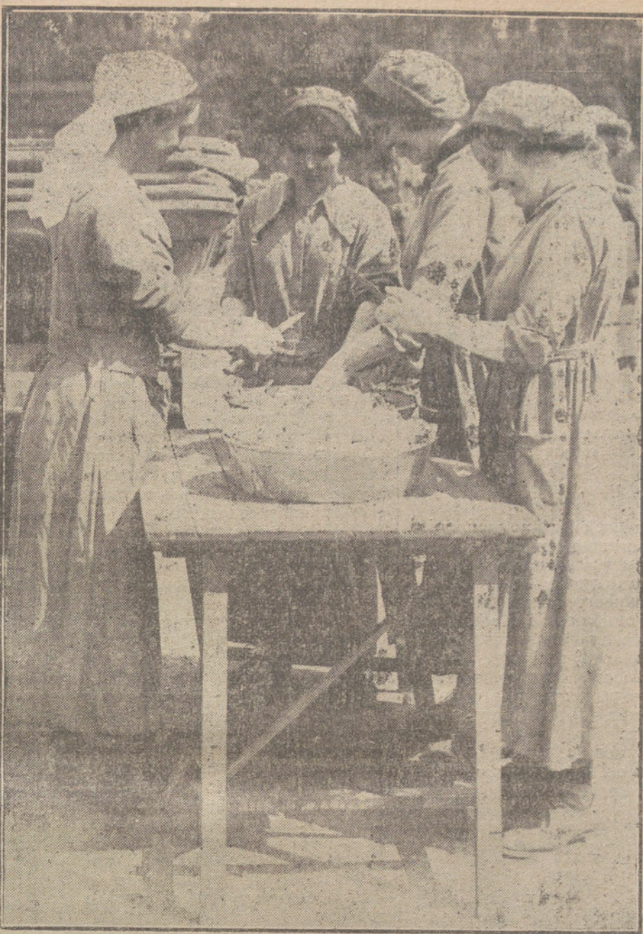
LAS MUJERES EN LA GUERRA.—Mujeres agregadas á un campamento inglés, preparando la comida de los soldados.

recordamos quizás lo que falte más es el público; pero hay que confesar que éste ha cambiado mucho desde los tiempos de las «gatadas» y aquellos en que no se permitía el catalán sólo en la escena, sino que debía haber siempre un personaje castellano, dando origen al género bilingüe, que cultivaron Robreño y Angelón. Hoy Barcelona, sin dejar de ser catalana, tiene un gran contingente de habitantes nacidos en todas las regiones de España, es foco de inmigración y sus colonias extranjeras son numerosas.