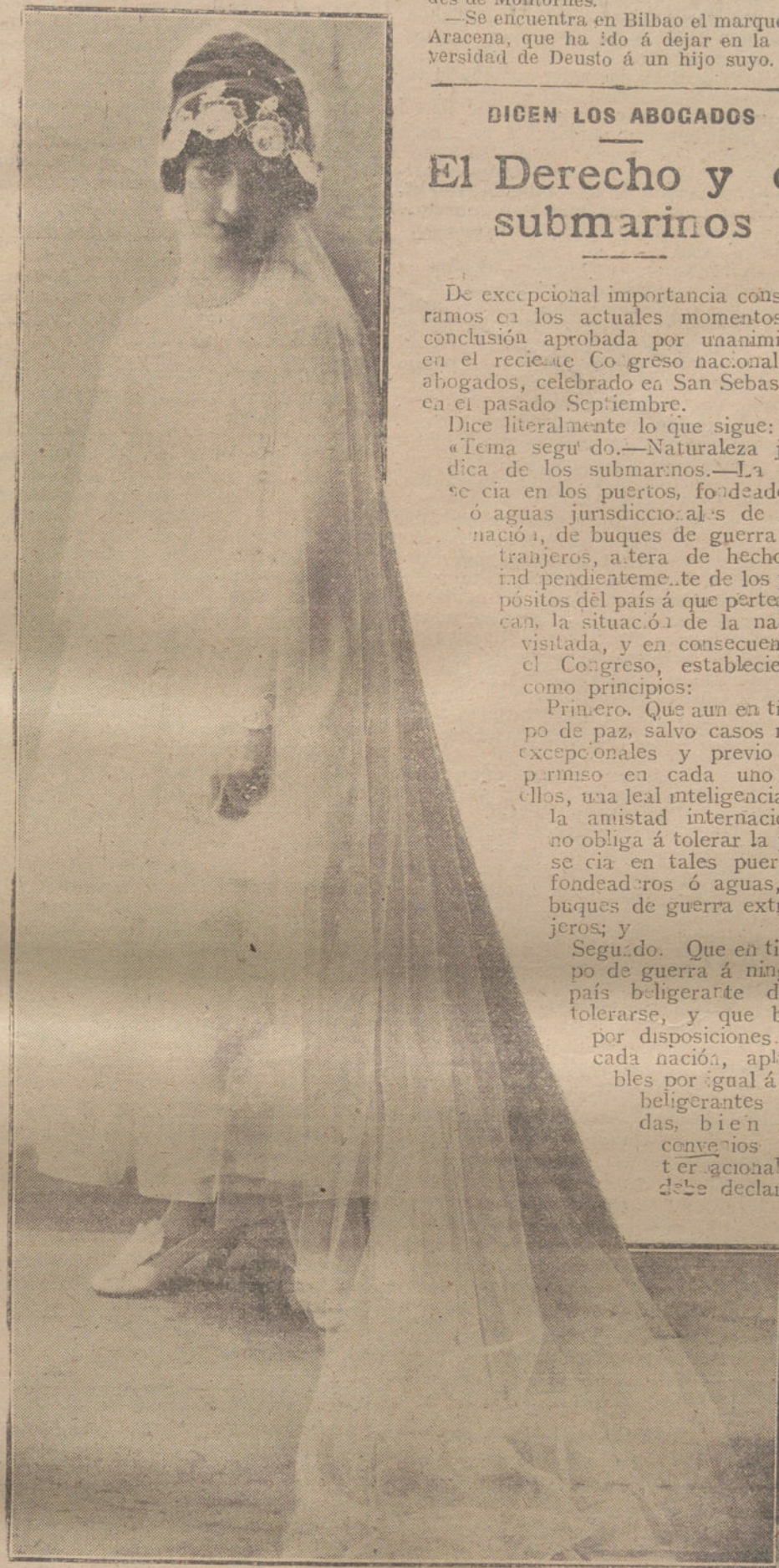
Traje de boda, última creación de Busenel.