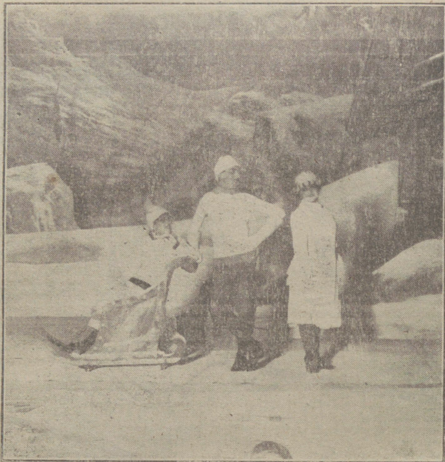
Una escena de «El pícaro Segismundo», obra que se representa esta noche en el teatro de Apolo.

Los comensales ovacionaron repetidas veces al Sr. Llovera, y aplaudieron también los discursos que después pro-