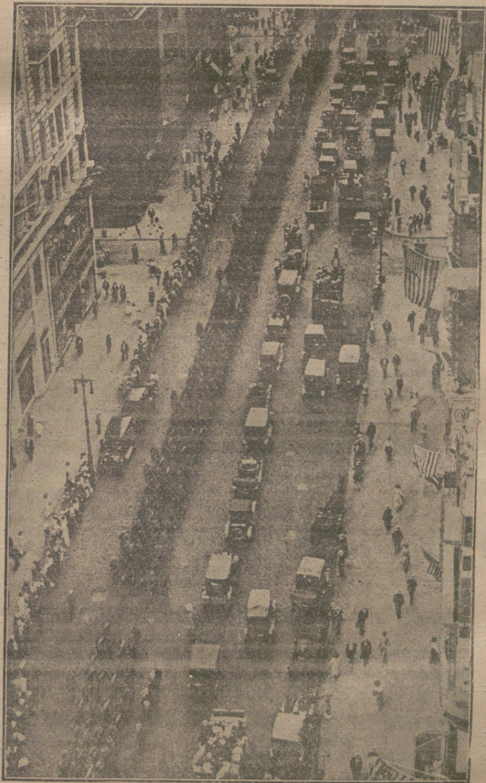
NORTEAMERICA EN LA GUERRA.—Un regimiento de infantería desfilando por una calle de Nueva York, antes de partir para Europa.

¿Qué diablo de discursideras son esas, mi querido admonitor? A cada paso rebato yo opiniones de Menéndez Pelayo, y con todo eso téngole por maestro. ¿Y porque uno yerre en un caso ya no se puede tener con él