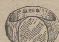
Núm. 15.—Gramos veinte Ptas. 75

Factura de garantía en todas las compras