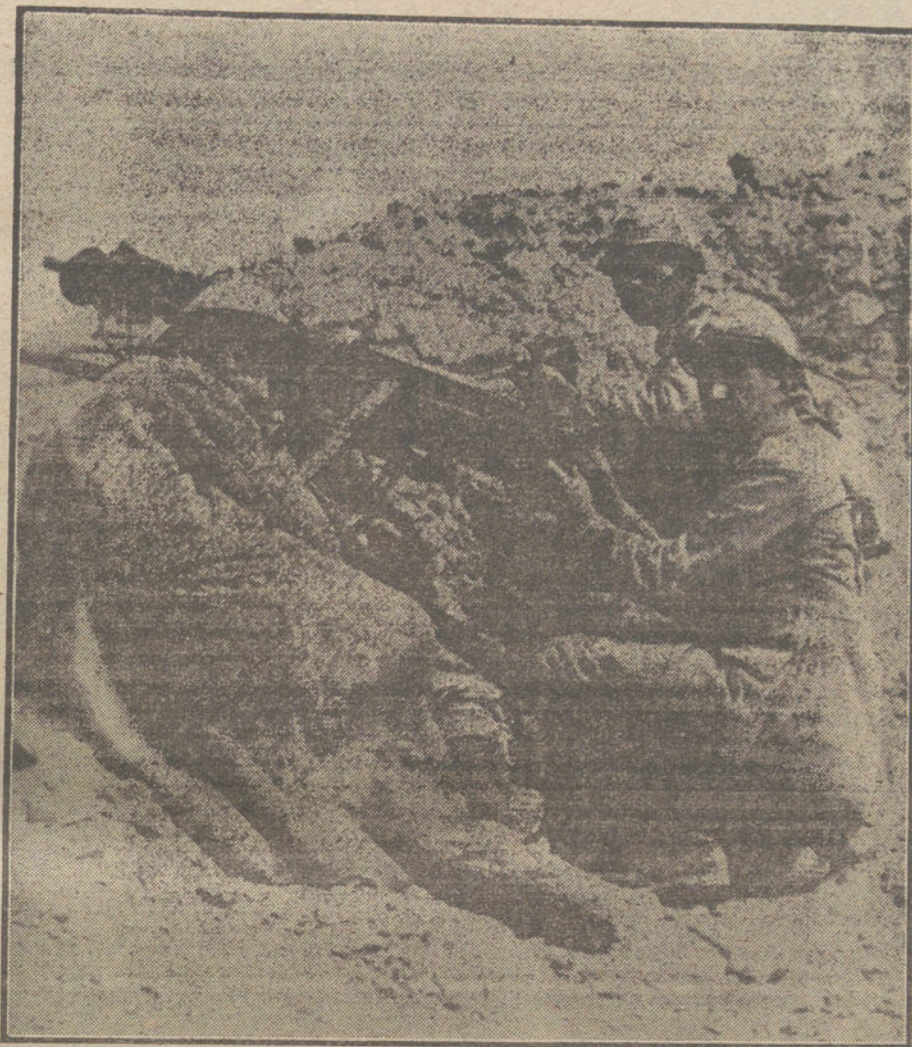
LA GUERRA EN FRANCIA.—Soldados franceses en un punto avanzado del Camino de las Damas.

La enrevesada red legislativa, imposibilita las funciones de Gobierno en el más alto concepto directivo, y cuando surgen personalidades con voluntad, acometividad y jugo cerebral, deseadas de realizar obra práctica, se encuentran sorprendidos ante los deficientes y complejos medios que dificultan toda actuación, sin poder ha-