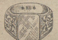
Núm. 10.—Gramos once Ptas. 41,25