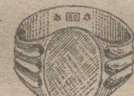
Núm. 9.—Gramos once Ptas. 41,25