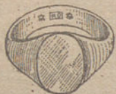
Núm. 2.—Gramos seis Ptas. 22,50