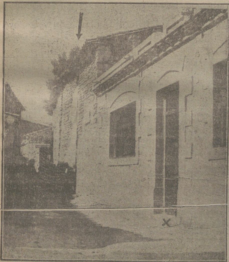
Pequeña casa de Fuendetodos, donde nació Goya. La cruz indica la entrada a las Escuelas donadas al pueblo por Zuloaga.

Pero el entusiasmo de los adoradores de Goya no paraba ahí. A la cabeza de los fieles devotos figuraba Zuloaga, y él pensó que no era suficiente con conservar la casa; era preciso, además, poner al pueblo de Fuendetodos en condiciones de admirar, venerar y glorificar la memoria de su hijo. Junto a la casa de Goya se ha levantado un local espléndido, costado por Zuloaga, y destinado a escuelas públicas. Está dotado de material moderno, y lo preside un gran retrato del inmortal pintor aragonés. La cultura, el talento y la afición del maestro de Fuendetodos, reveladas en unas sentidas y elocuentes cuartillas que leyó el día de la inauguración, son garantía de que las nuevas generaciones sabrán amar el recuerdo de Goya sobre todas las cosas.