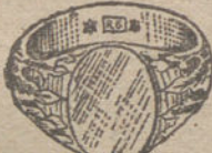
Núm. 12.—Gramos trece Ptas. 48,75