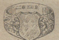
Núm. 7.—Gramos nueve Ptas. 33,75