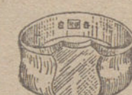
Núm. 6.—Gramos ocho, cinco Ptas. 31,90