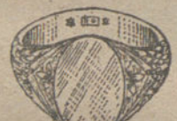
Núm. 13.—Gramos catorce Ptas. 52,50