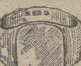
Núm. 14.—Gramos diez y seis Ptas. 60