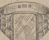
Núm. 5.—Gramos ocho Ptas. 30