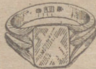
Núm. 3.—Gramos siete Ptas. 26,25