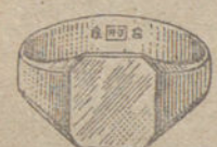
Núm. 1.—Gramos cinco Ptas. 18,75