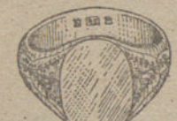
Núm. 4.—Gramos siete, cinco Ptas. 28,15