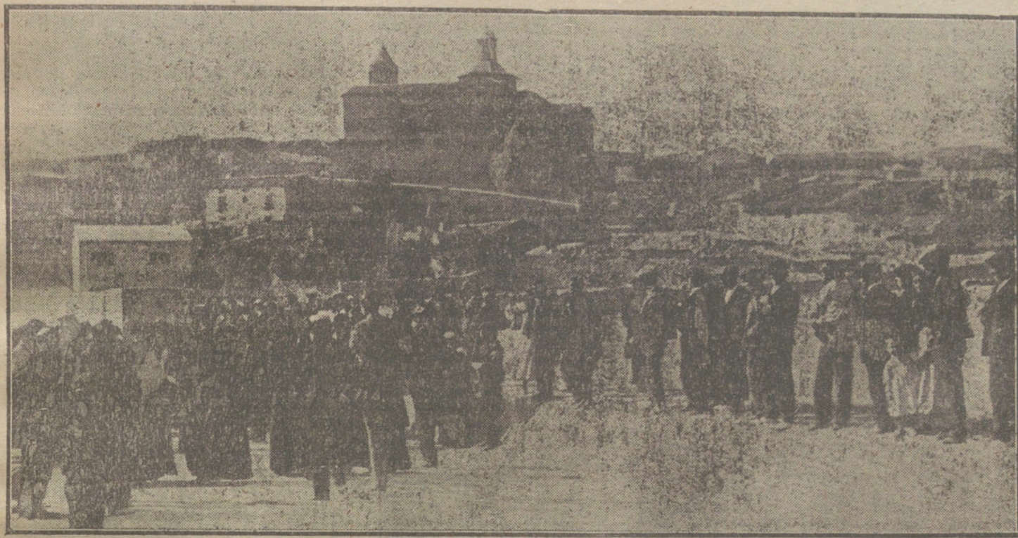
Vista general de Fuendetodos, cuna de Goya, a la llegada de los excursionistas.

Oficialmente, Goya estaba olvidado. Fuera del poco decoro con que siempre se le trató en los Museos, de unos cuantos monumentos urbanos, que en la mayoría de los casos más son escarnio que glorificación, y de otras tantas veladas cursis de los Centros regionales, nada se ha hecho en memoria del gran artista aragonés, eje de todas las evoluciones de la pintura contemporánea.