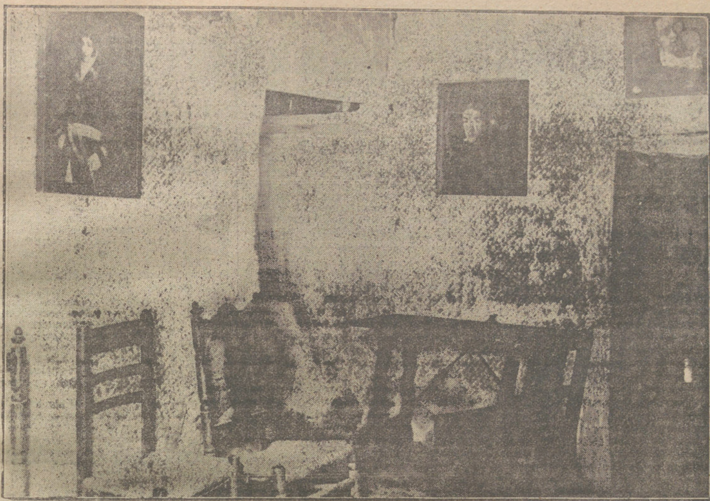
Interior de la casa donde nació Goya.

no tenía más remedio que serlo, los encargados de dirigir la excursión no se cuidaron de darle al acto más brillantez que la natural y propia del acto en sí.