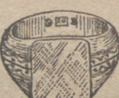
Núm. 11.—Gramos doce Ptas. 45