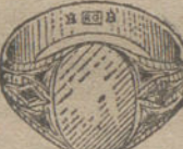
Núm. 8.—Gramos diez Ptas. 37,50