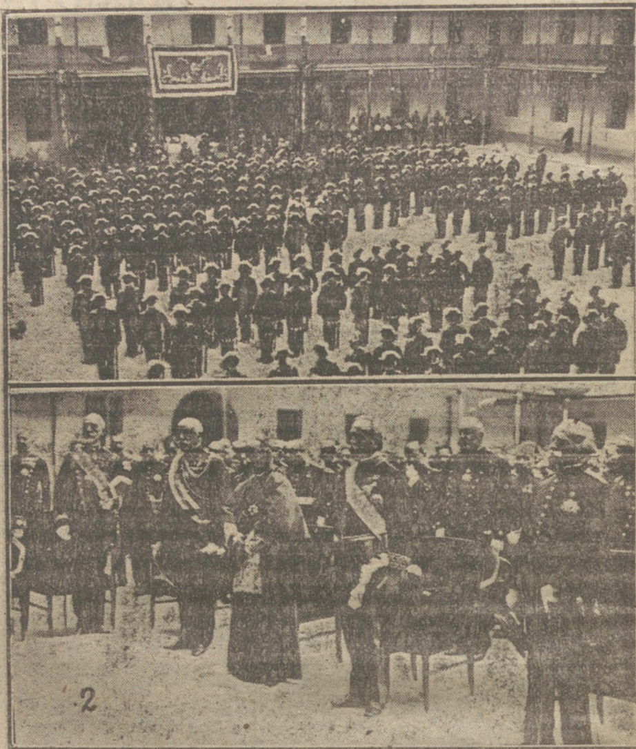
LA FIESTA DE LA PATRONA DE LA GUARDIA CIVIL.—1. Aspecto del patio del cuartel durante la celebración de la ceremonia religiosa. 2. El obispo de Sión, el ministro de la Gobernación y el general Aznar, oyendo la misa.