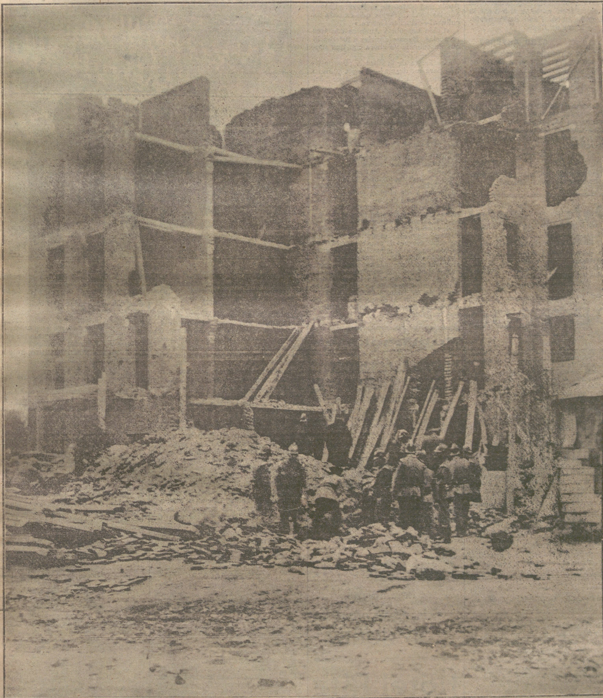
Estado en que se hallan las obras de la casa de la calle de Meléndez Valdés, hundida ayer tarde, suceso que causó la muerte á cinco personas.