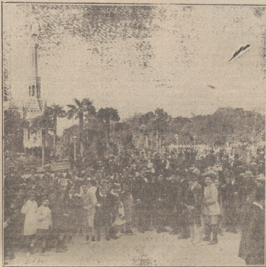
Los niños de las escuelas públicas de Madrid, depositando flores en el monumento a Cristóbal Colón.

La empresa del alumbrado público ha manifestado que, de no recibirse los 25.000 kilos de carbón que tiene pedidos, no podrá facilitar alumbrado en breve plazo.