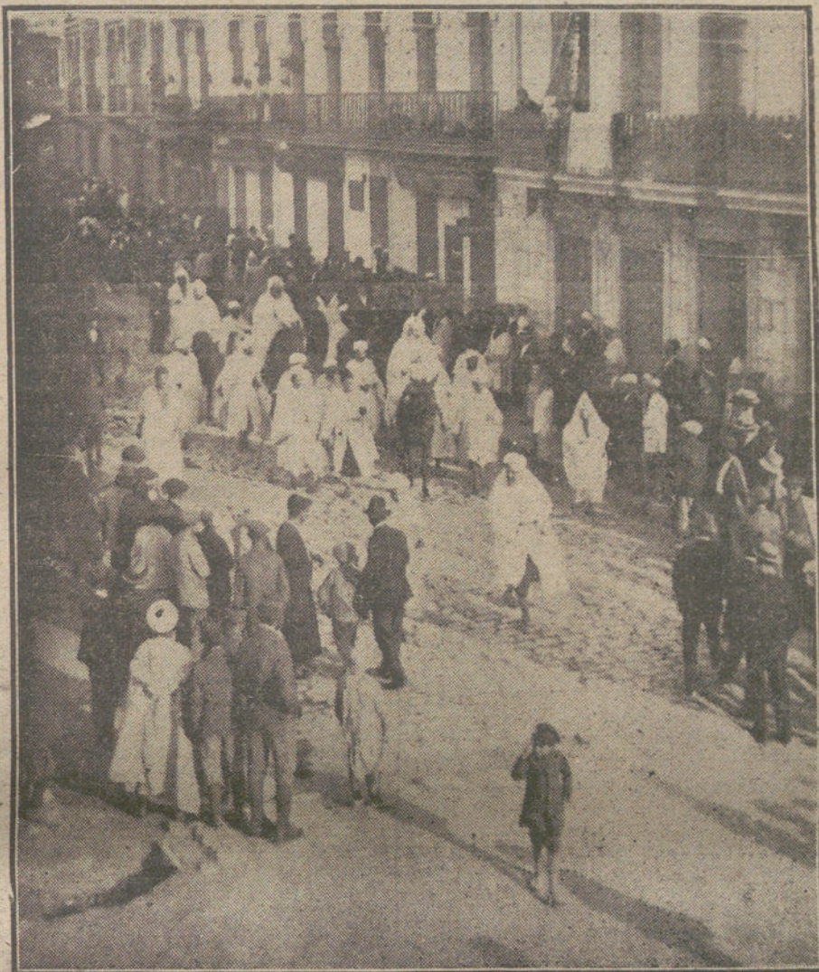
ESPAÑA EN AFRICA.—Las autoridades moras de Tetuán, saliendo á recibir á nuestro comisario general.

He aquí la única línea recta que debe seguir el Gobierno por instinto de conservación del país. Nosotros, á la vuelta de censurar mucho la política del señor Dato, hemos de reconocer su patriotismo, y á él apelamos para que, con la medida y ponderación de su alto entendimiento, vea si no es perturbadora,