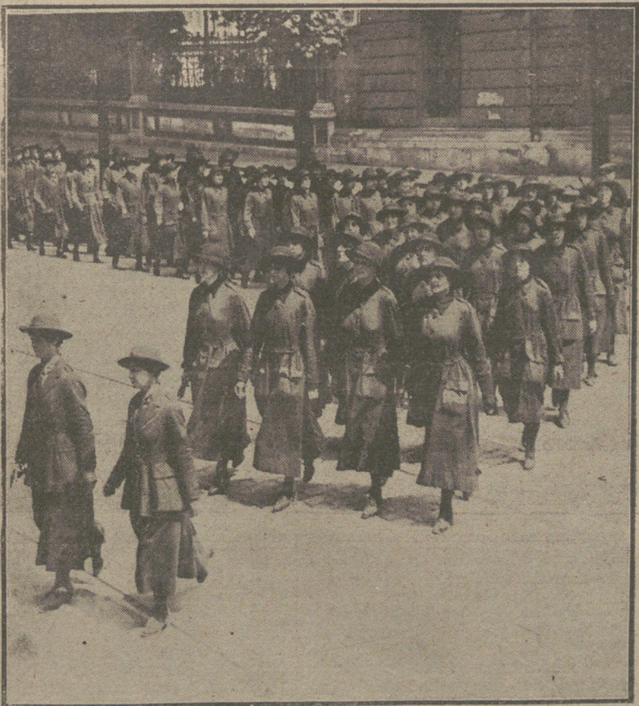
LAS MUJERES EN LA GUERRA.—Desfile de enfermeras de la Cruz Roja en la gran calle de Lope de Vega.

francamente perturbadora, la fórmula de reunir unas nuevas Cortes.