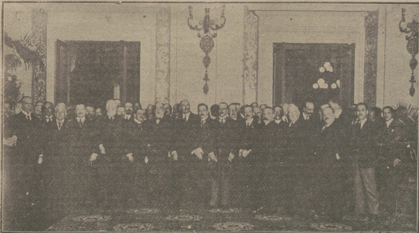
LA FIESTA DE LA RAZA.—Personalidades y concejales que asistieron á la sole mna reunión celebrada ayer tarde en el Ayuntamiento de Madrid

—Pero, Juanón, caray, ¿qué te había dicho yo? Si eres más burro que una madreña. Na, que si esto pasa un cuarto de hora más tarde, y da lugar á que yo me