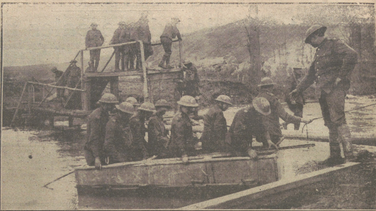
LAS NECESIDADES DE LA GUERRA. —Soldados ingleses construyendo un puente en una de las innumerables regiones pantanosas de Flandes.

Buena prueba del papel de mediador desempeñado por Alemania entre Austria-Hungría y Rusia en el conflicto austroservio la dan los siguientes documentos: En un telegrama enviado por el Gobierno alemán a su embajador en Viena se decía: La respuesta del Gobierno servio al ultimátum austriaco deja ver que Servia se ha avenido a las exigencias austriacas. Por consiguiente, el Gobierno austriaco no podrá observar el retraimiento mostrado hasta aquí frente a nuestras proposiciones de mediación y a las de otros Gabinetes. Por otra parte, el