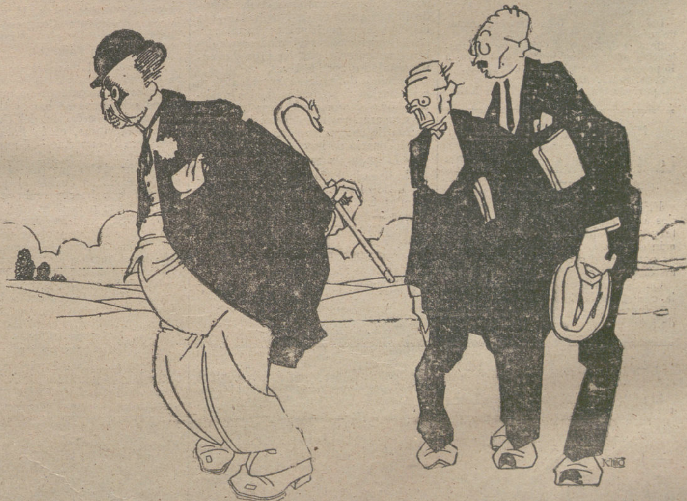
LA CARA DEL MINISTRO