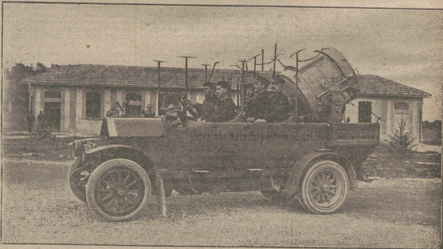
LAS NECESIDADES DE LA GUERRA. Proyector eléctrico de gran alcance, utilizado por el Ejército italiano.

Por este método de un saqueo por parte de la Cuádruple, a la que la Entente se dedica después de no obtener sus objetivos por medio de las armas, las Potencias centrales no se dejarán convencer. Czernin y Kulmann han