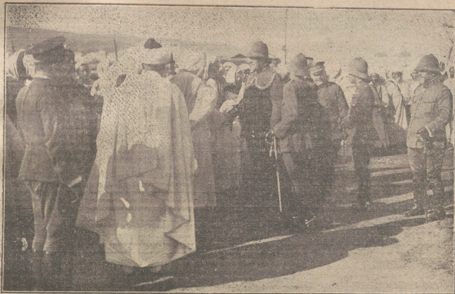
EL GENERAL JORDANA EN MELILLA. — El general en jefe saludando á los moros que fueron á recibirle al muelle y ofrecerle sus respetos.

Una nube de ojos azules y cabellos rojos rodea un bebé que diga mamá.