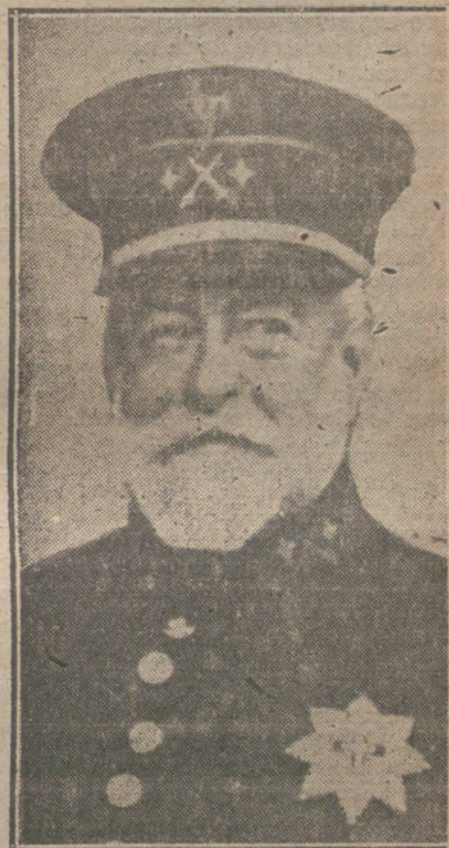
El nuevo ministro de la Guerra, general Marina.

—Anoche, terminado el Consejo de ministros, dirigí un telegrama al ge-