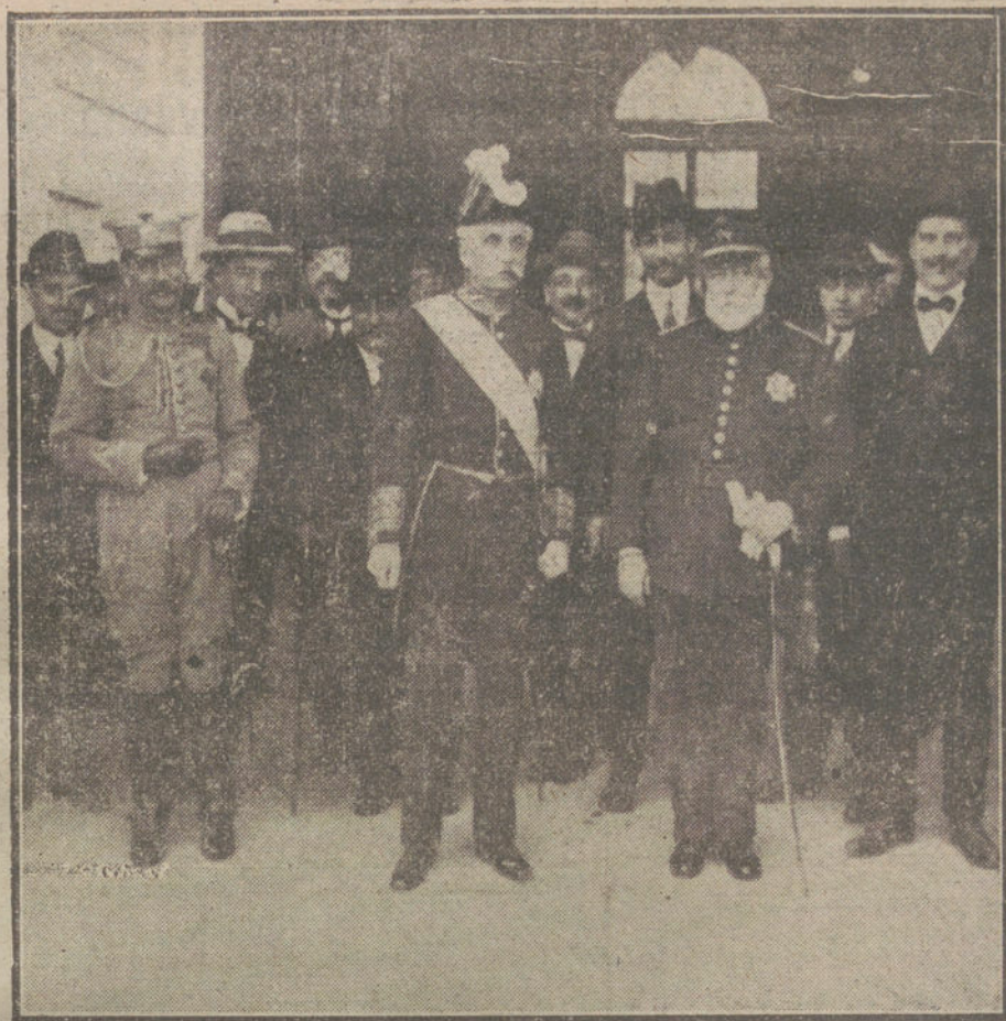
El nuevo ministro de la Guerra, general Marina, saliendo de Palacio, después de jurar el cargo.

amigo, es un articulito «pour pleurer». Para llorar... de risa, naturalmente!