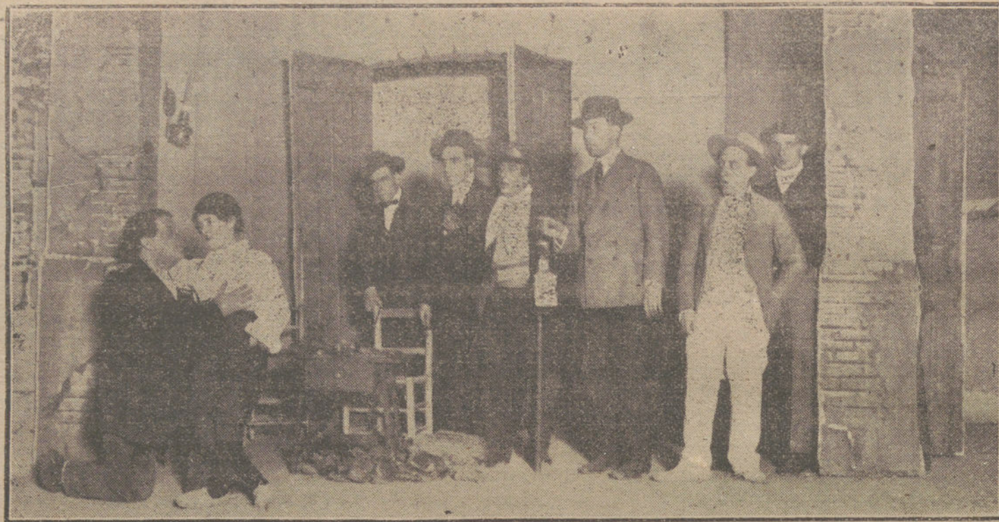
Una escena de «El zorro», obra que se estrena esta noche en el teatro de Martín.