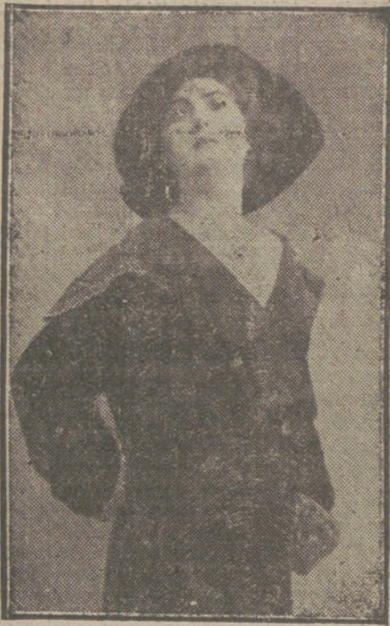
La bella actriz cinematográfica Francesca Bertini, que, procedente de Italia, llegará a Barcelona uno de estos días.

Pantalón, guerrera y dormán valen unas ciento veinticinco pesetas, y bien las merece un rey ó un Roque cualquiera.