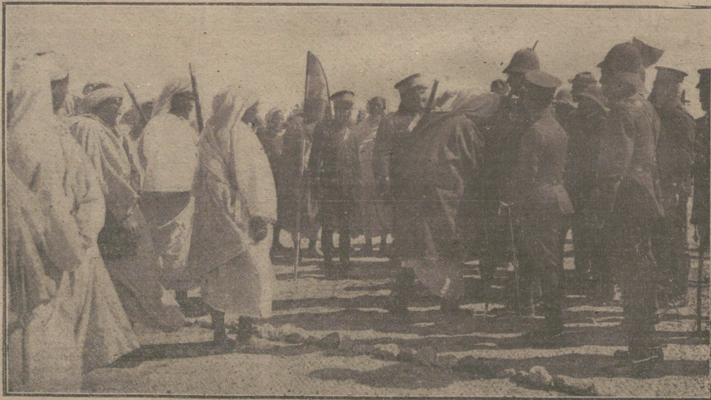
EL GENERAL JORDANA EN MELILLA. Notables indígenas de las cabilas de Beni Sidel y M' Talza (aún no ocupada), que en número mayor de trescientos, acudieron a saludar al general en jefe, en la posición de Kaddur.