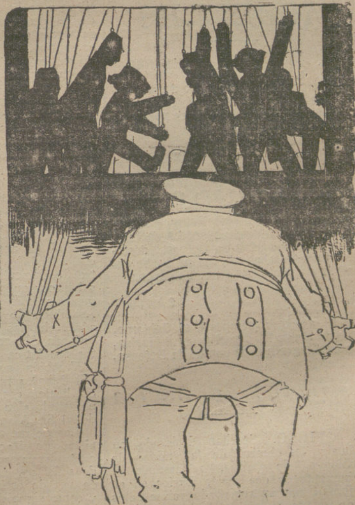
REVERSO El que mueve las figuras.