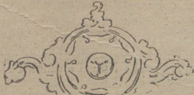
ANVERSO Las figuras del tinglado.