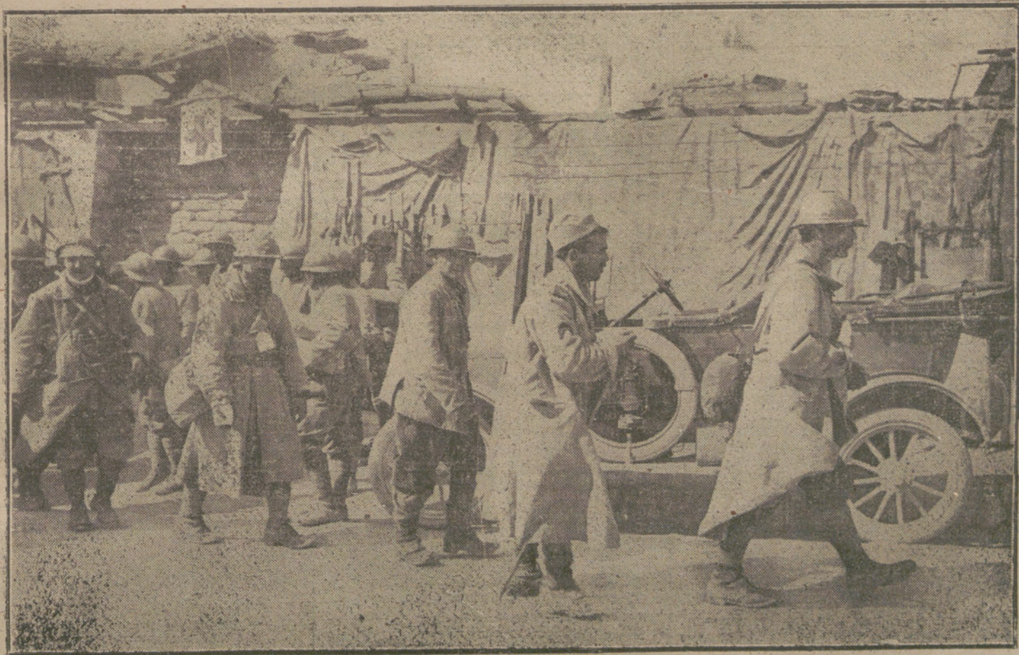
LAS VÍCTIMAS DE LA GUERRA.—Soldados franceses, heridos leves, esperando ser asistidos en una ambulancia del frente.

Unos aldabonazos dados con fuerza en el portón de la casa hicieron despertar sobresaltadas a las dos mujeres. No contestaron a la primera llamada; pero la segunda, dada con más prisa y fuerza, hizo saltar de la cama a la señora Pepa para enterarse de las causas de aquella