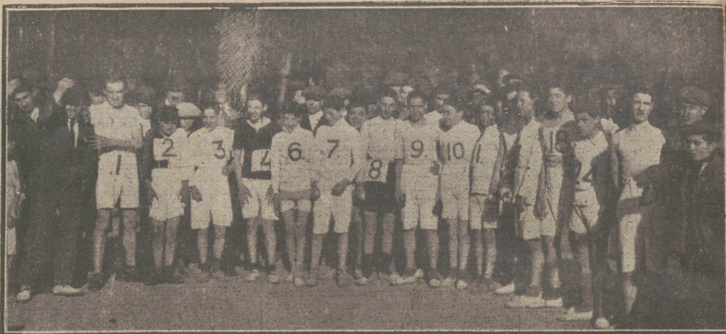
Corredores que han tomado parte en la carrera pedestre organizada por la Sociedad Cultural Deportiva, celebrada esta mañana.