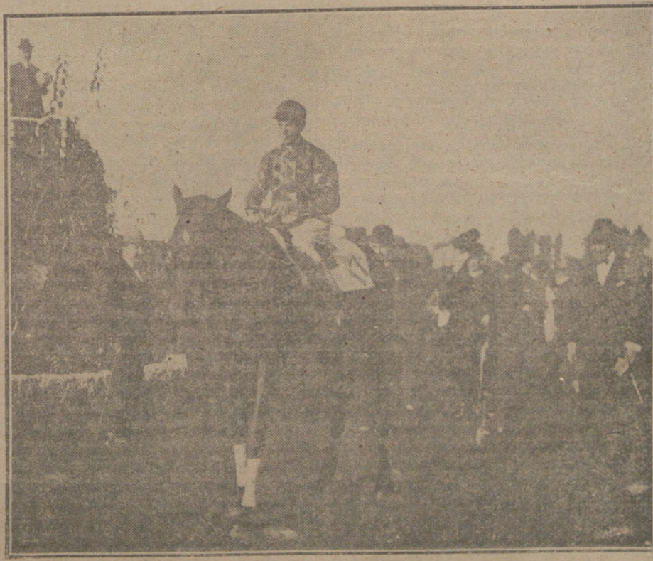
LAS CARRERAS DE CABALLOS DE AYER. — El caballo «Royal Bala», propiedad del conde de la Cima, ganador del premio «Cibele».

Claro está que todo hombre que tenga anhelos de vida y aptitud para luchar, busca el complemento de sus necesidades fuera de su cátedra, y unas veces sigue la vía oficial y en