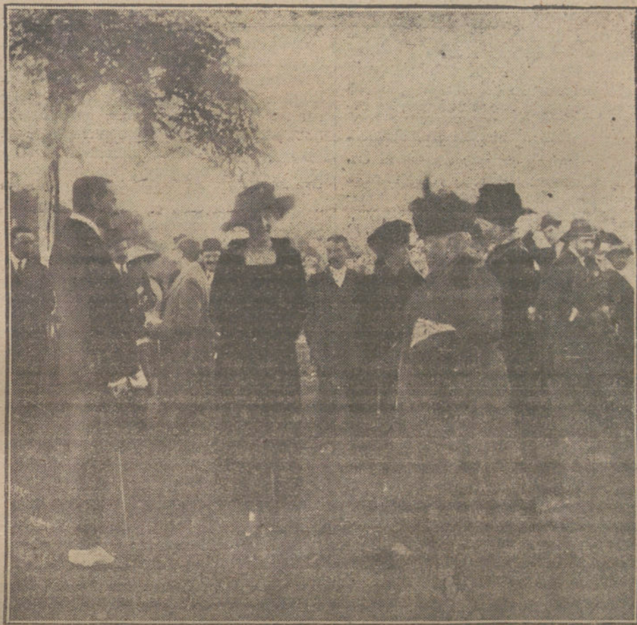
LAS CARRERAS DE CABALLOS DE AYER.—S. M. la Reina Victoria, con Su Alteza la Infanta Isabel, paseando por el Hipódromo de la Castellana.

Desde su alto puesto ha atentado contra los derechos públicos, ha corrompido la política y sus hombres, ha querido suprimir á la Prensa, y, por último, ha tenido, y aún tiene, el propósito de promover una lucha cruenta entre el elemento militar, alimentando ambiciones y odios, y haciendo que, frente á las Juntas de Defensa, cuya actuación no puede ser más correcta con las libertades civiles, surja otra nueva Junta, pensando incluso que se llegará á la