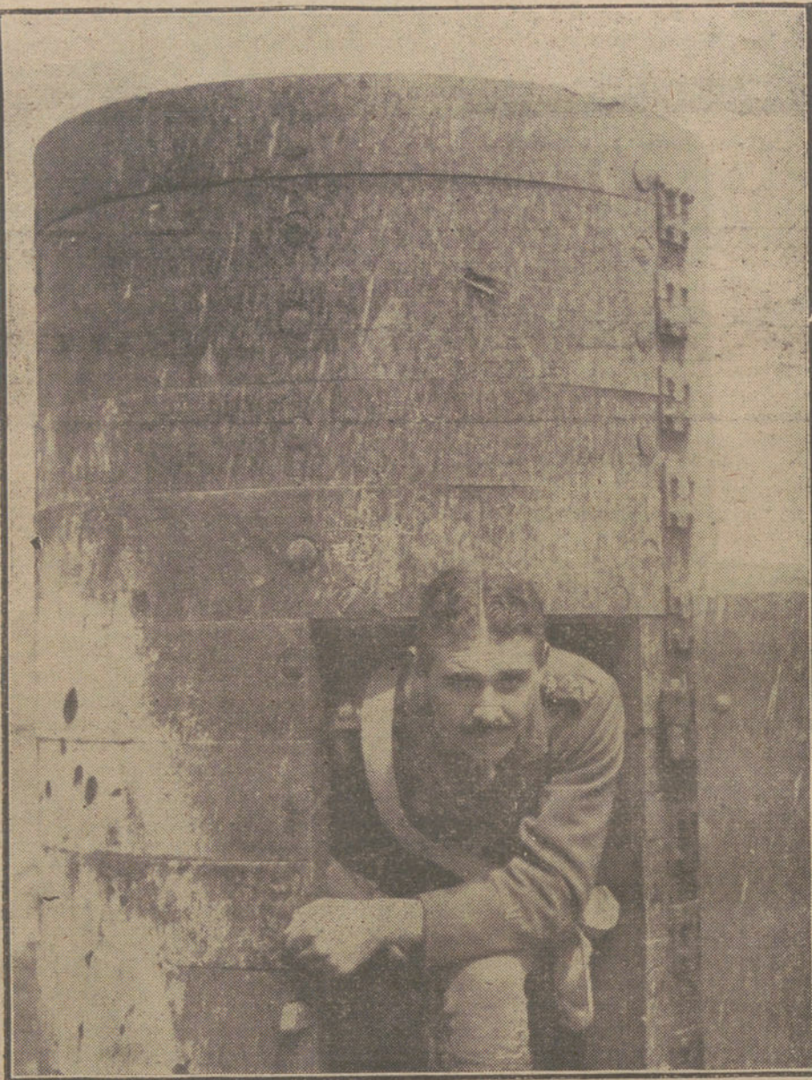
LAS NECESIDADES DE LA GUERRA. —Soldado inglés en un punto de observación blindado.

LONDRES (Oficial). «A pesar del tiempo brumoso, nuestros aeroplanos verificaron un nuevo ataque contra Alemania. Una fundición y un empuñe ferroviario