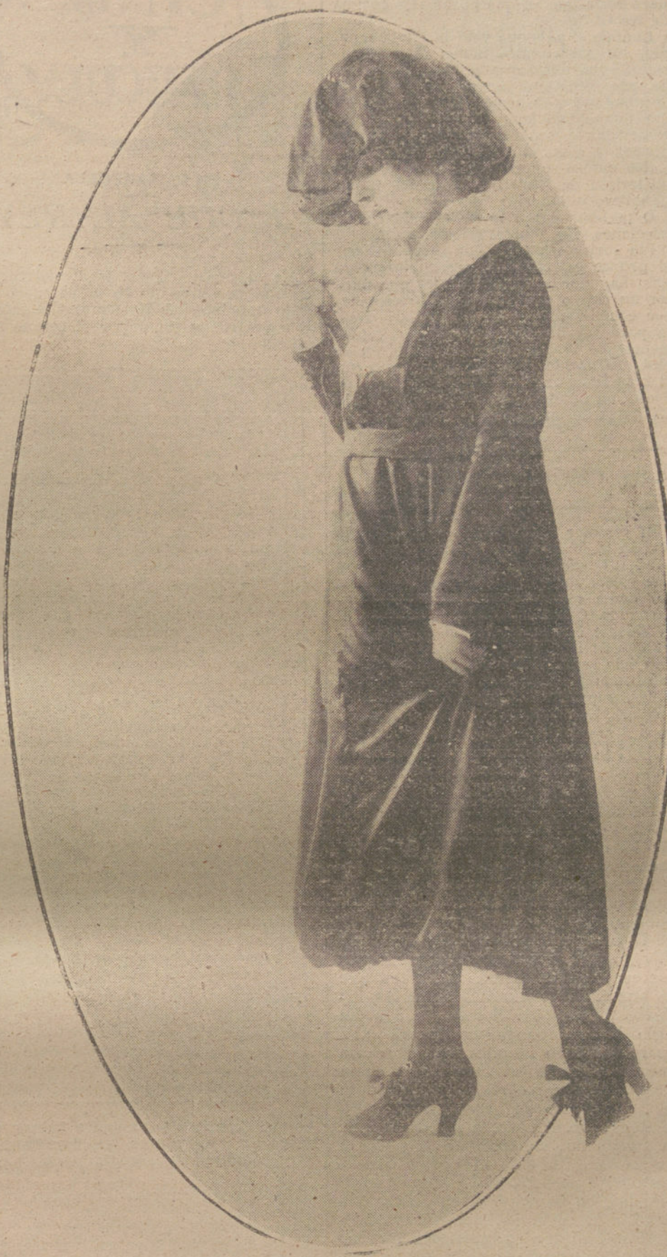
Traje de terciopelo y boina de igual tela, último modelo de la Casa Sty

de tropas de nacionalidad alemana ó magyar, para no exponerse á rozamientos con los demás pueblos de la Monarquía. Sin embargo, esto no tiene importancia ante la eficaz cooperación de las mismas tropas, con cuya ayuda nuestros heroicos soldados han llevado á cabo empresas arriesgadísimas; añadió el ministro que ante esos hechos, no ha de haber preferencia ninguna de nacionalidad, sino que se impone la mutua acción de todos. En una lucha tan difícil como la actual, en la que por encima de todo está nuestra existencia.