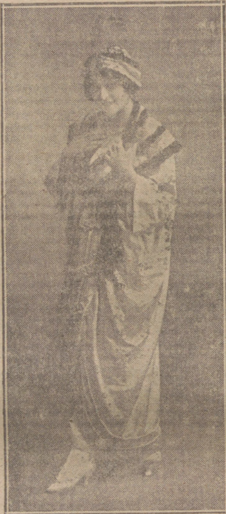
La bellísima actriz Blanquita Suárez, que acaba de impresionar en Barcelona la grandiosa película «La Verdad».

No alarmarse. Es el título del cuento cinematográfico estrenado en la Zarzuela con éxito indudable, dado el creciente interés con que fué seguido por el selecto público.