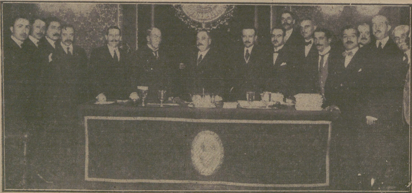
Inauguración de las sesiones del IV Congreso de Urología, celebrada ayer en el Colegio de Médicos.

La manifestación de este ardiente deseo es lo que ha removido la tierra que pisamos... Antes menudeaban los