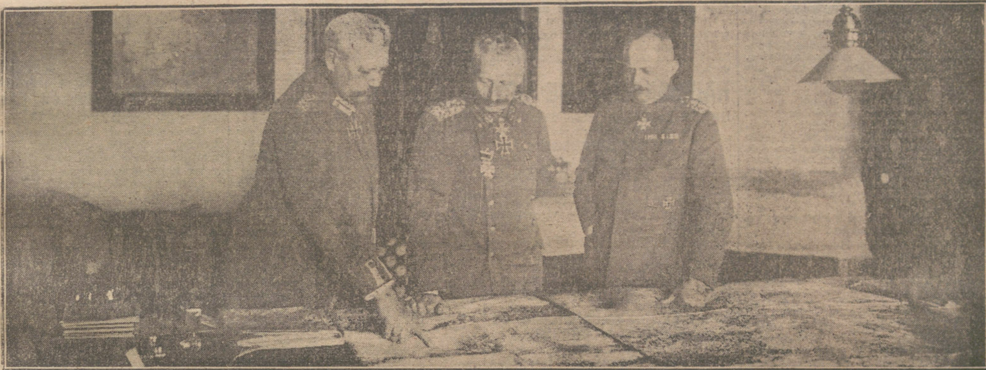
Ultimo retrato del Kaiser, con los generales von Hindenburg y Ludendorff, en el gran cuartel general, estudiando un plan de campaña.

UN SUBMARINO ALEMAN EN UN PUERTO ENEMIGO.—COMBATE NAVAL EN EL KATTEGAT.—NUEVA FORMULA DE PAZ PROPUESTA DESDE RUSIA.—LOS NEGOCIOS SOSPECHOSOS EN FRANCIA.—PARTES OFICIALES DE LOS DIVERSOS FRENTE DE BATALLA