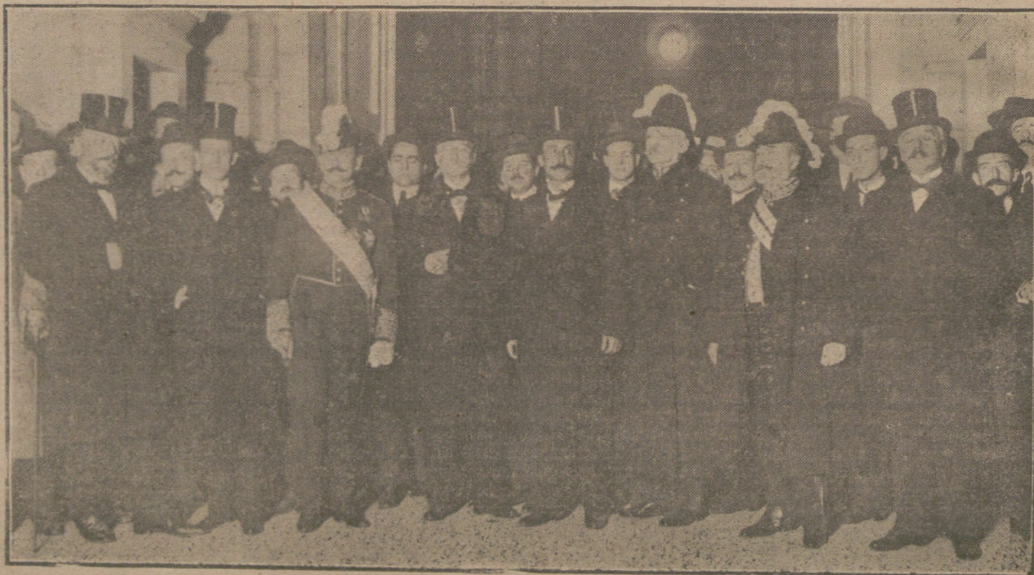
LA SOLUCION DE LA CRISIS.—Los nuevos ministros al salir de Palacio, después de jurar sus cargos.

Lansing espera que las falsas conclusiones sean sacadas por otros, y, en efecto, un radio de Lyon ha aceptado esta tarea, afirmando que los dos mencionados despachos del conde de Luxburg son pruebas evidentes de los propósitos alemanes de someter á su inspección Sudamérica. Frente á esto debe recordarse que estos despachos representan únicamente opiniones particulares del citado ex embajador, y que éstas han sido entretanto desaprobadas terminantemente por el Gobierno alemán, al llamar al conde. Por lo demás, estos despachos prueban únicamente que el conde de Luxburg tenía preferencias por expresiones impropias y exaltadas. En su contenido material no hay nada que pudiera servir como prueba de los sentimientos hostiles del Gobierno alemán hacia la América del Sur. En uno de los despachos declaraba el conde de Luxburg que la política del Gobierno alemán en Sudamérica producía la impresión de bondad.