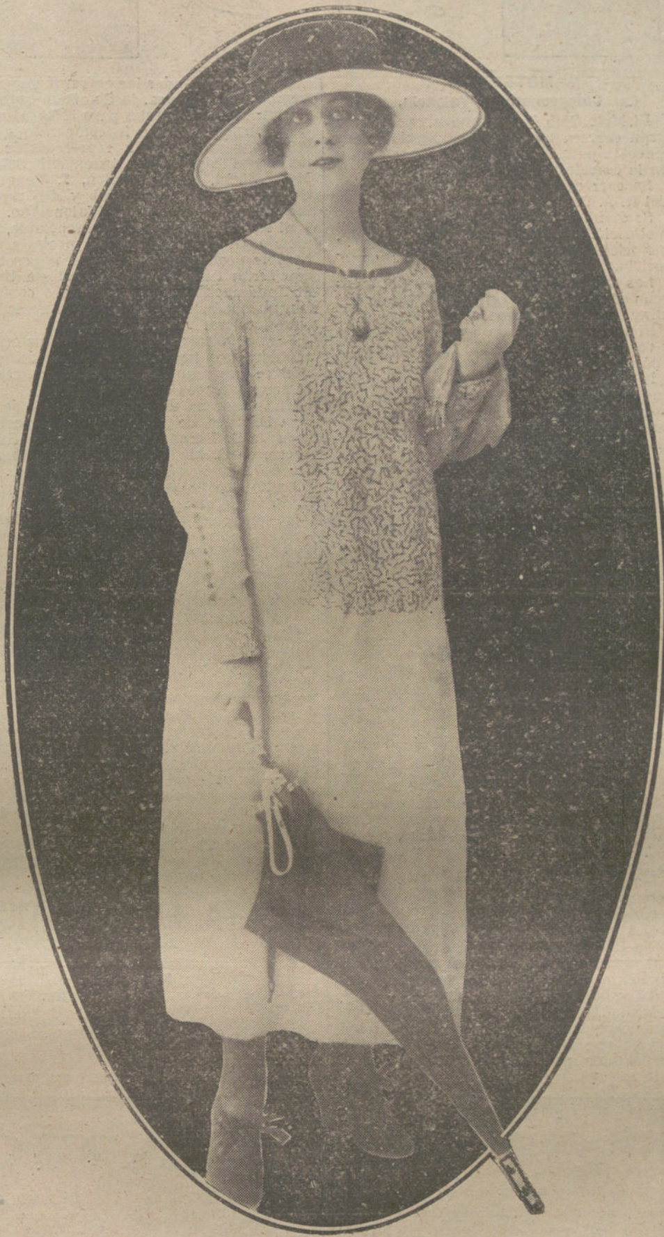
Traje-bata, bordado con galón de seda, modelo de la Casa Ernestine.

con referencia a los dos telegramas del ex embajador alemán en la Argentina, conde de Luxburg, publicados por el secretario de Estado americano, Lansing, que la posibilidad, en ellos mencionada, de la visita de una escuadra alemana a Buenos Aires, para la que propuso el conde de Luxburg el envío de submarinos, ha sido realmente tratada por ambos Gobiernos. Esta visita hubiera constituido un contraste con la visita de una escuadra norteamericana y de cruceros ingleses, y al mismo tiempo hubiera demostrado de nuevo la estricta neutralidad del Gobierno argentino, al que le es agradable toda visita de cortesía de barcos de guerra de cualquier país beligerante.