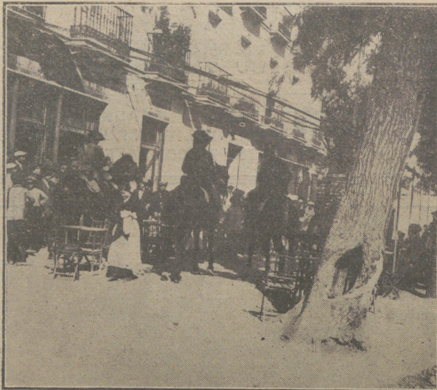
LA HUELGA DE TRANVIARIOS EN SEVILLA.—La Guardia civil conteniendo á los grupos de huelguistas que intentaban asaltar los tranvías.

Dicen los ingleses: «En la madrugada del 2 del corriente, una columna británica entabló combate con las fuerzas turcas que defendían las posiciones de la orilla derecha del Tigris, frente á las nuestras, á unas 20 millas al Norte de Samarra. El enemigo se retiró hacia Tikrit, defendiéndose en sus fuertes posiciones á retaguardia. Nuestras fuerzas rechazaron á los turcos de sus sucesivas líneas de trincheras, apoderándose de dichas posiciones. Entre tanto, la Caballería inglesa atacaba al enemigo en su retirada, persi-