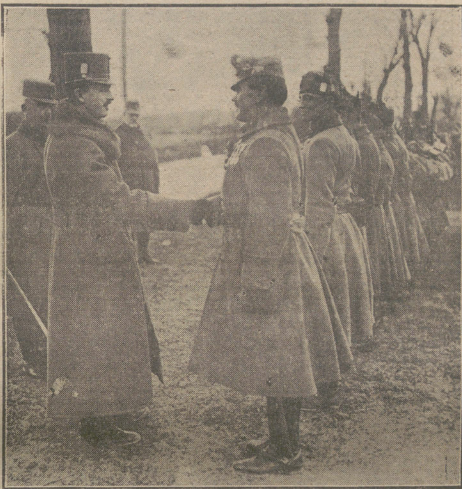
El Emperador Carlos de Austria felicitando á las tropas que han tomado parte en las últimas operaciones del frente italiano.

Con la rectificación de la línea germana habrán los atacantes de modificar su plan de martillo presionante, y mientras preparan y proyectan nuevos asaltos, y mientras emplazan en nue-