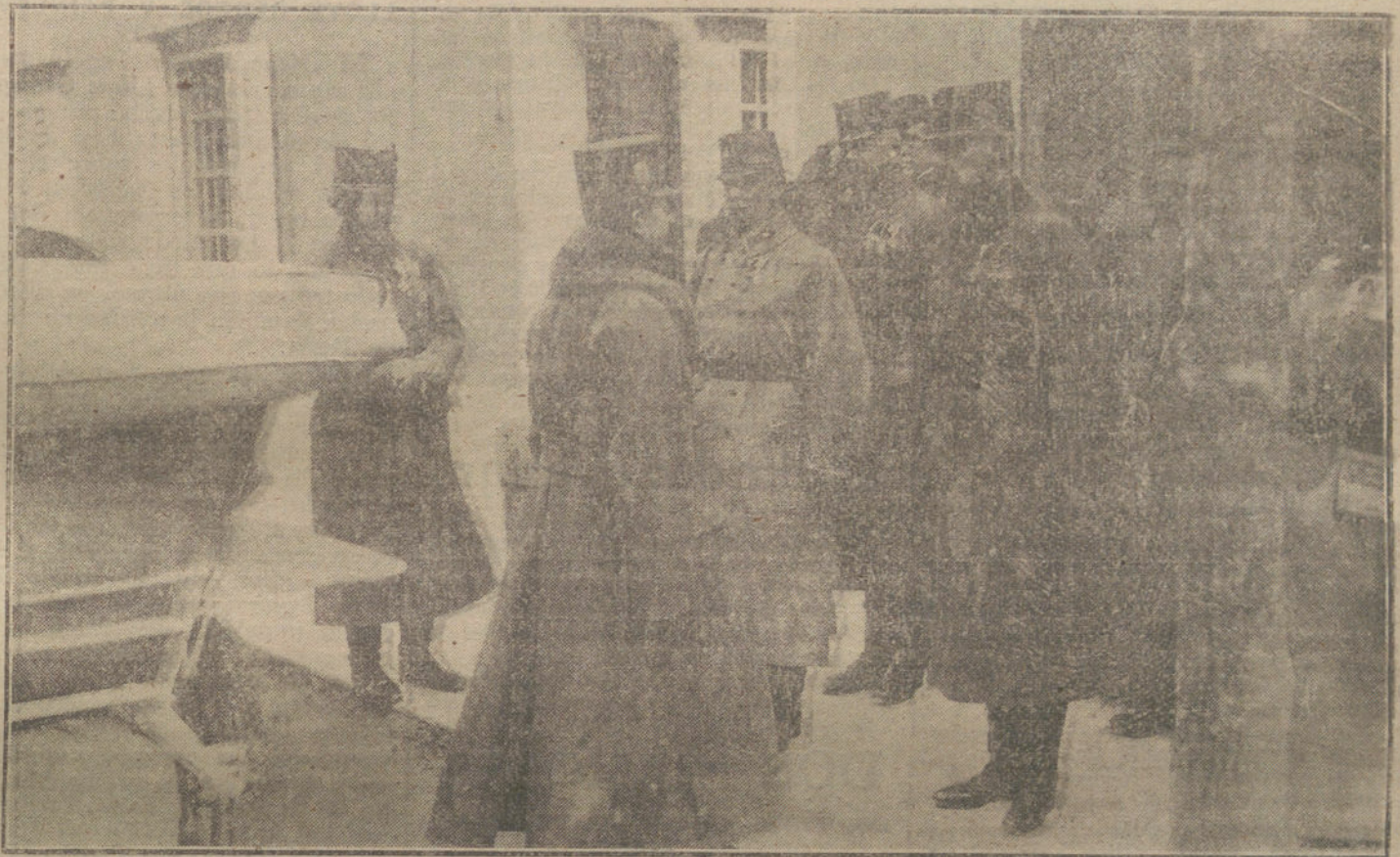
LOS JEFES DE ESTADO EN LA GUERRA. —El Emperador Carlos de Austria, visitando el frente italiano en el sector donde han tenido lugar las victoriosas operaciones de sus tropas.

Durante el día, el tiempo ha sido incierto y ha llovido á intervalos. Sin embargo, la buena visibilidad ayudó en la labor de nuestra Artillería y de nuestros aviadores, y nuestros cañones han podido bombardear eficazmente las baterías