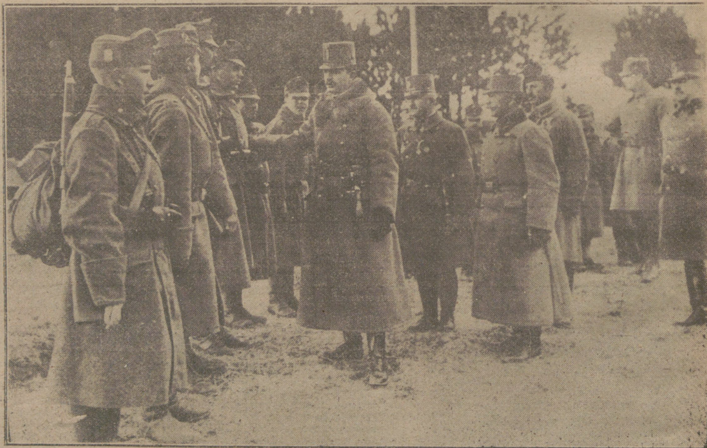
LOS JEFES DE ESTADO EN LA GUERRA. El Emperador Carlos de Austria, conversando con los heroicos soldados austrohúngaros en el frente italiano.

Como en casos semejantes, se suceden los cambios rápidos de situación estratégica antes de establecer el necesario equilibrio, al cual se llegará indudablemente, pues se cuenta con todos los elementos necesarios para asegurar el éxito de la gran batalla iniciada hace doce días, y que sin duda se decidirá a nuestro favor. Tenemos enfrente imponente concentración de tropas y medios enemigos, bajo las órdenes del Estado Mayor alemán, que tienden, con su amontonamiento de fuerzas y Artillería, a obtener, con la ruptura del frente italiano, la destrucción militar de Italia y la convulsión política interna, que habría de acarrear la decisión de la guerra europea; pero