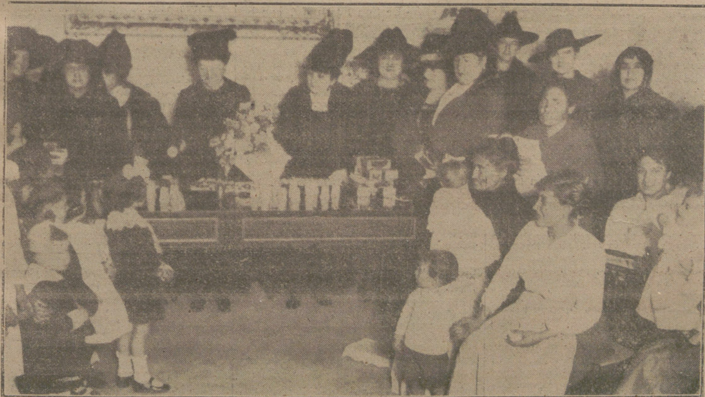
Reparto de premios del Comité Femenino de Higiene Popular, a los vecinos del distrito de Palacio, acto verificado ayer tarde.

ta y progresiva, se nutrirá de todas las reformas que demanda la situación, desatendida u olvidada, del proletariado.