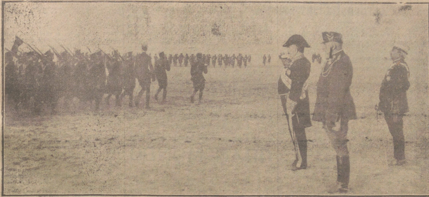
LA REVISTA MILITAR DE CARABANCHEL. — El ministro de la Guerra y el capitán general de Madrid presenciando el desfile de las tropas.

Primero. Oferta inmediata de una paz inmediata también.