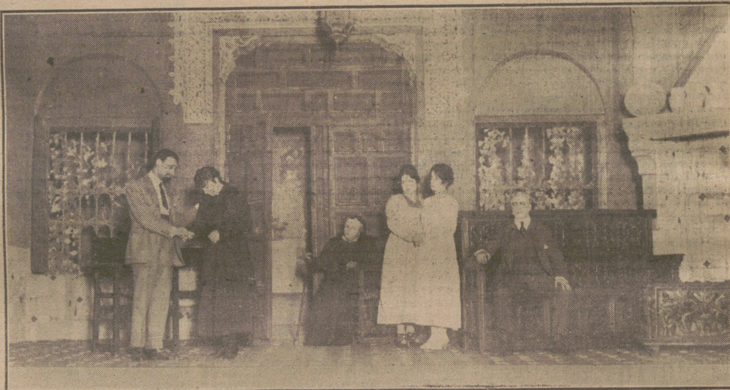
Una escena de «Esperanza nuestra», comedia de Martínez Sierra, estrenada anoche en el teatro de Eslava.

Se cree en los Centros militares romanos que no todas las divisiones alemanas concentradas en el frente italiano han entrado en acción. Se calcula en 10 el número de las que tomaron parte en las operaciones últimas, y en 12 las que existen aún de reserva.—Hallet.