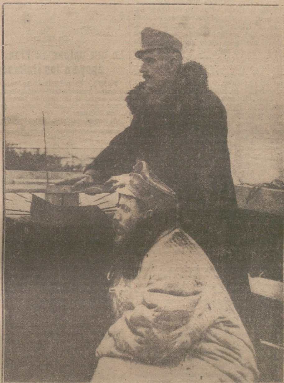
Soldados austrohúngaros en un punto de observación contra aviones, en el frente italiano.

Para poner en claro la situación es necesario conocer las fuerzas austroalemanas que han sido efectivamente concentradas sobre el frente italiano para la actual ofensiva.