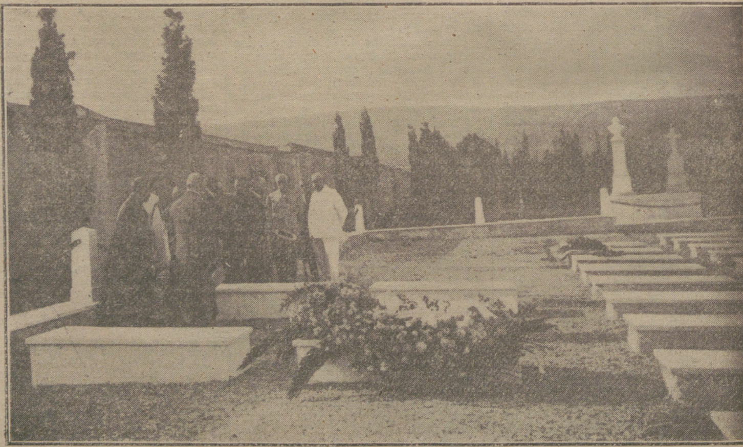
Miembros del Gobierno francés visitando las tumbas de los marineros muertos en campaña.

La noche del 6 pasó tranquila, aunque se oyeron algunos disparos. Se sabe que hubo 32 heridos. Los tranvías circularon durante algunas horas. Las calles de centro de la ciudad estaban desiertas pero en los alrededores la concurrencia era normal. Hacia las diez circuló un au-