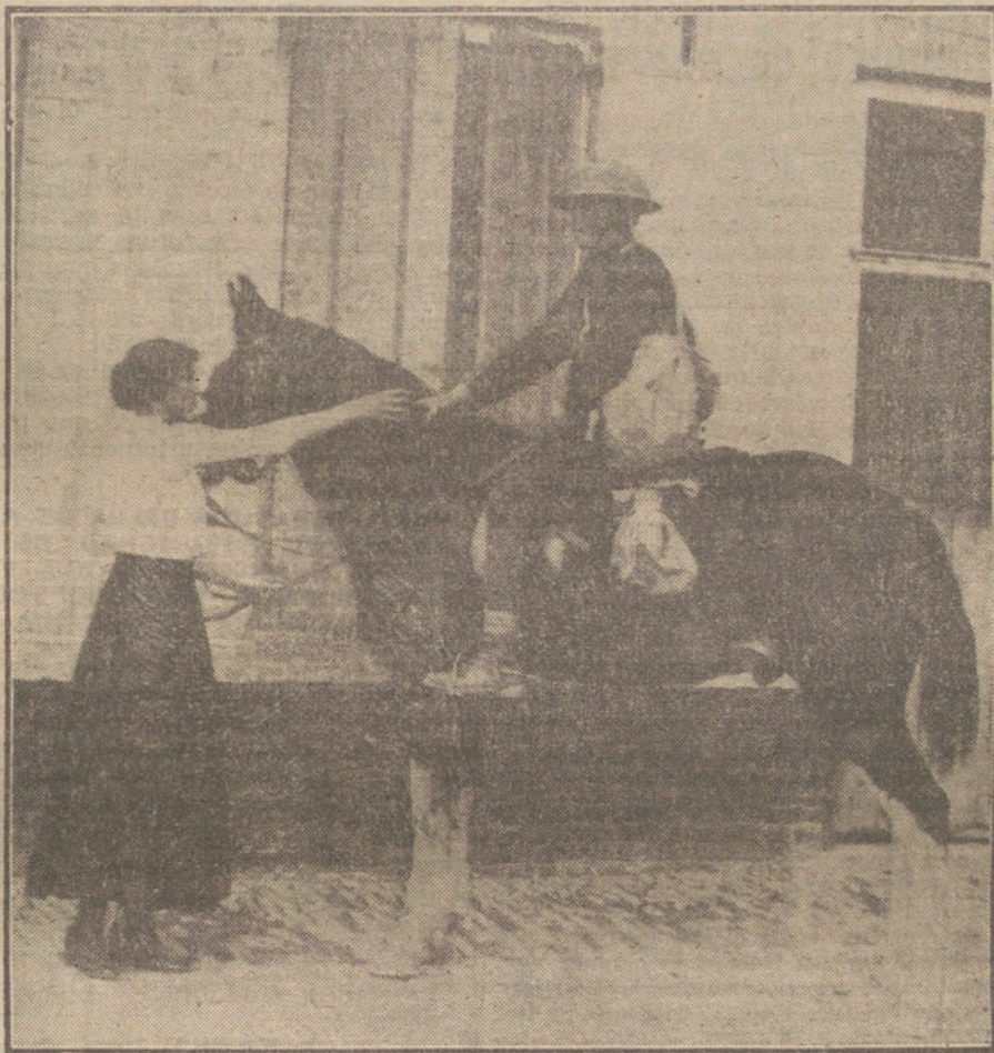
ESCENAS DE LA GUERRA.—Un soldado francés despidiéndose de su esposa en el momento de marchar al frente.

glaterra, y el Brasil, espejo de Inglaterra y de los Estados Unidos, pueden vivir en una comunidad perfecta de manifestos.