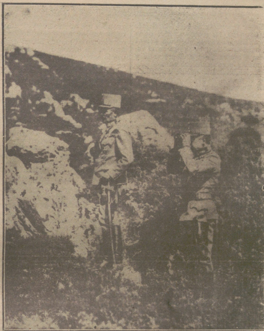
LA LUCHA EN EL FRENTE ITALIANO.—El general austriaco von Boroevic observando al enemigo desde un puesto en las montañas.

Porque tuvimos siempre un especial afecto a «El Imparcial», diario de recto abolengo y noble estirpe periodística, hemos sostenido con él polémicas fuertes, quizás un poco duras, pero siempre respetuosas. Nuestro temperamento no es de una ductilidad tan elástica que pueda conducirse por donde quieran los contrarios. Y en esto podrá haber visto «El Imparcial» alguna ve-