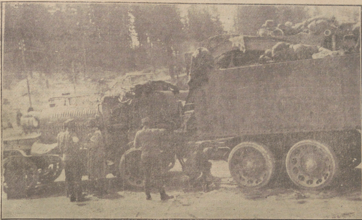
EL EJERCITO AUSTROHUNGARO. - Taller ambulante de un mortero austrohúngaro de grueso calibre, en el frente italiano.

to-camión, ocupado por marinos que distribuía una proclama firmada por los representantes de todas las unidades de la guarnición de San Petersburgo, y en nombre del Consejo de obreros de la capital.