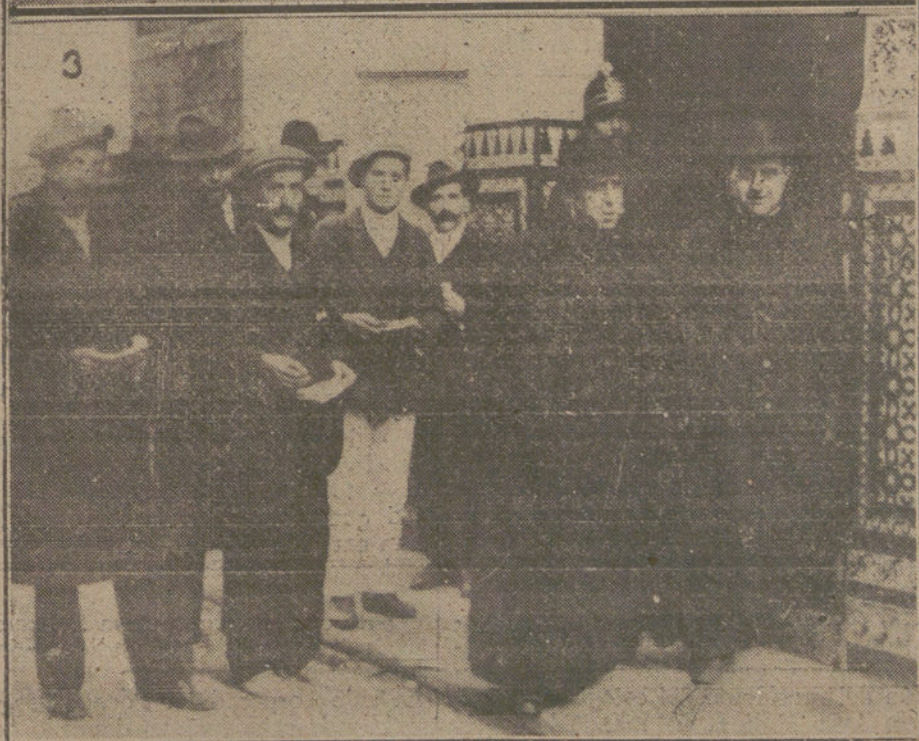
LAS ELECCIONES MUNICIPALES. —Núm. 1. Aspecto de la puerta de un colegio electoral en las primeras horas de la tarde. Núm. 2. Guardias de Seguridad en un retén establecido frente a un colegio. Núm. 3. Dos sacerdotes, saliendo de Los Gables, donde está instalada la sección cuarta del distrito del Congreso.

instaladas en el Hospicio, Tribunal de Cuentas y Escuela de Artes e Industrias, de la calle de San Mateo.