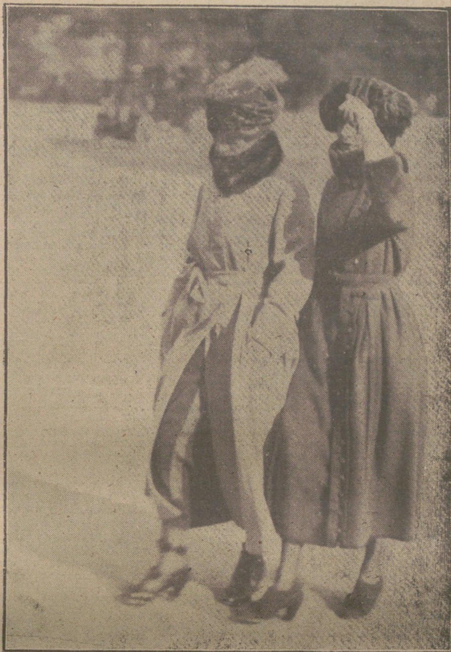
Originales abrigos de invierno, estilo ruso, última creación de la moda francesa.

de intensidad y describe maravillosamente, por su misma recia concisión, son sus notas características, que llegan al máximo grado en «Juventud y Ego-latría».