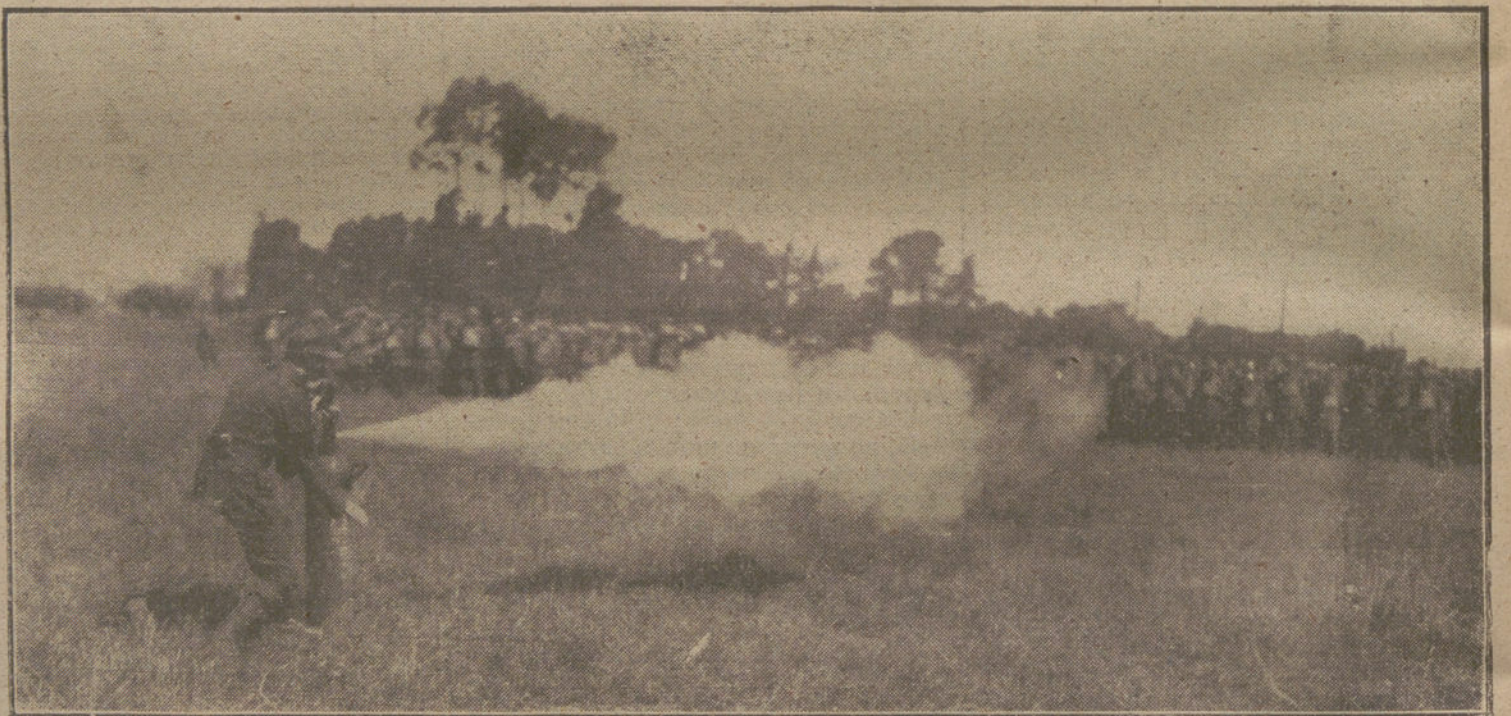
LAS NECESIDADES DE LA GUERRA MODERNA. Aparato para la producción de vapor con objeto de ventilar los movimientos de las tropas.

El general Boroevit, comandante de uno de los Ejércitos que operan con-