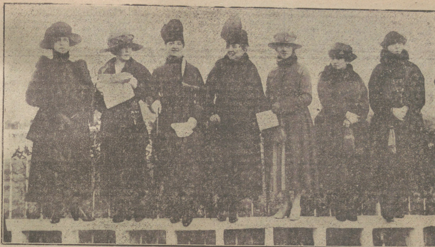
LAS CARRERAS DE CABALLOS DE AYER.—Aspecto de un sector del Hipódromo momentos antes de comenzar las carreras.