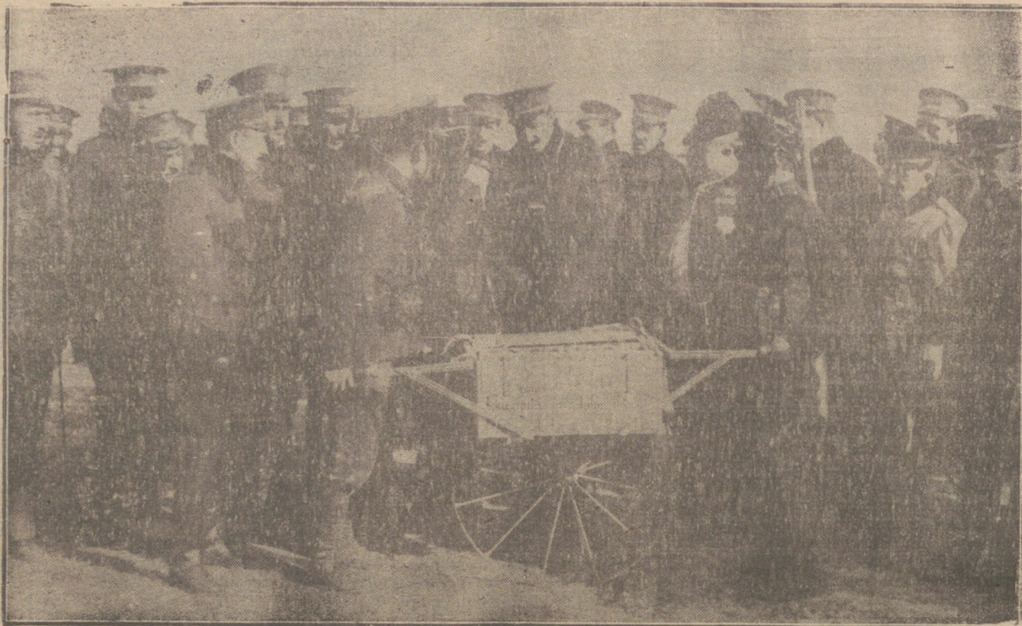
EL REY EN EL CAMPAMENTO DE CARABANCHEL.—S. M. y el ministro de la Guerra, examinando los proyectos para las prácticas de tiro, verificadas esta mañana.

En el pabellón de experiencias, tomó asiento S. M., teniendo a su derecha al ministro de la Guerra, y a su izquierda, al general Weyler, y ante ellos y los demás asistentes al acto, expuso, con sencilla elocuencia, el tema, que luego, en la práctica, se iba a desarrollar, el