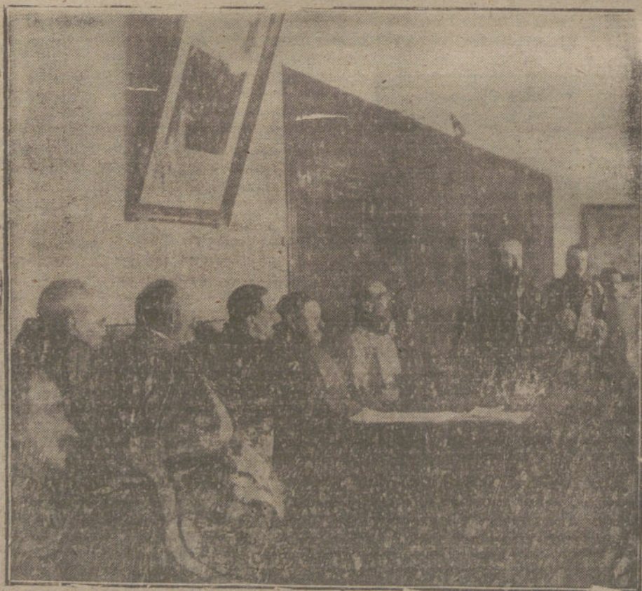
S. M. el Rey con el ministro de la Guerra, don D. Vicente Valero, acerca del tiro, acto verificado esta mañana en Carabanchel.