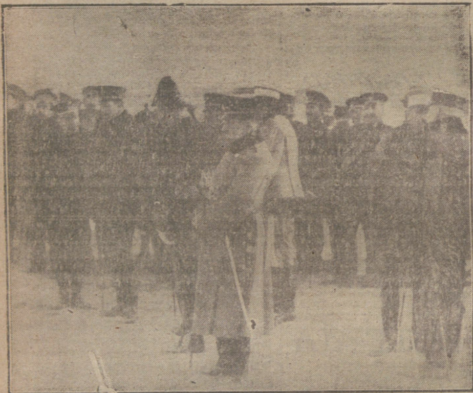
EL REY EN EL CAMPAMENTO DE CARABANCHEL.—S. M. durante las prácticas, conversando con el coronel-director de la Escuela de Tiro.

Ilustrado capitán, profesor de dicho Centro, D. Vicente Valero.