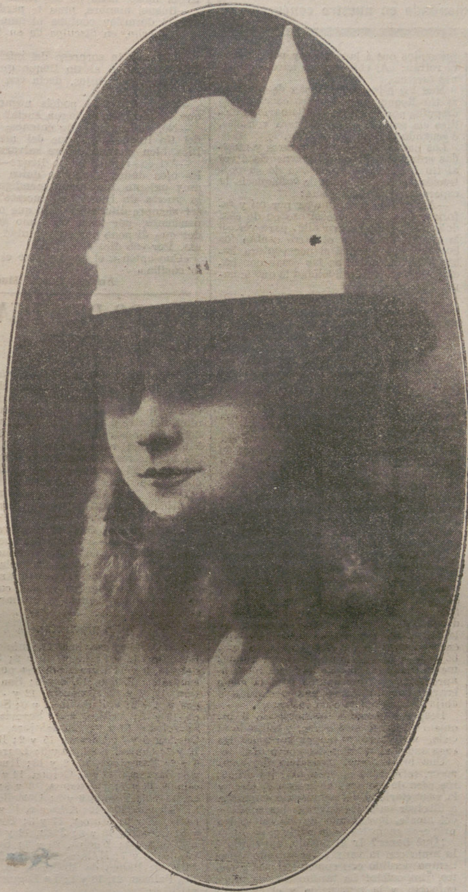
Elegante sombrero, blanco y negro, creación de la Casa Valentino.

servidores; pero nosotros somos todos pueblos libres, que no admitimos ninguna sujeción de otros pueblos, y conciliaremos esta independencia con la unidad en la dirección.