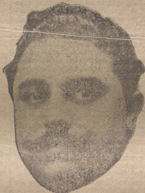
LOS NUEVOS CONCEJALES

LONDRES. Dicen de Nueva York que la calle de Broadway, que tenía reputación de ser la mejor iluminada del mundo, está a oscuras actualmente, a partir de las once de la noche, por virtud de una orden de Mr. Garfield, administrador de combustibles.