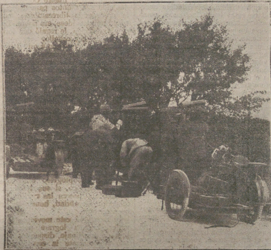
LAS NECESIDADES DE LA GUERRA. Soldados italianos montando un puesto de observación.

regional de regirse por sí mismos, con una autonomía amplia que no haya de rendir cuentas estrechas, siquiera el propósito se corrobore con unos vaticinios de mal gusto, que juzgamos impropios del Sr. Cambó, significa que la corriente popular del regionalismo sigue pensando como pensaba cuando fué aceptada por los más ilustres estadistas. El anhelo de que la paz no nos sorprenda con el desconcierto interior, sino preparados para hacer cara á los nuevos acontecimientos exteriores, nos parece, además, muy legítimo y práctico.