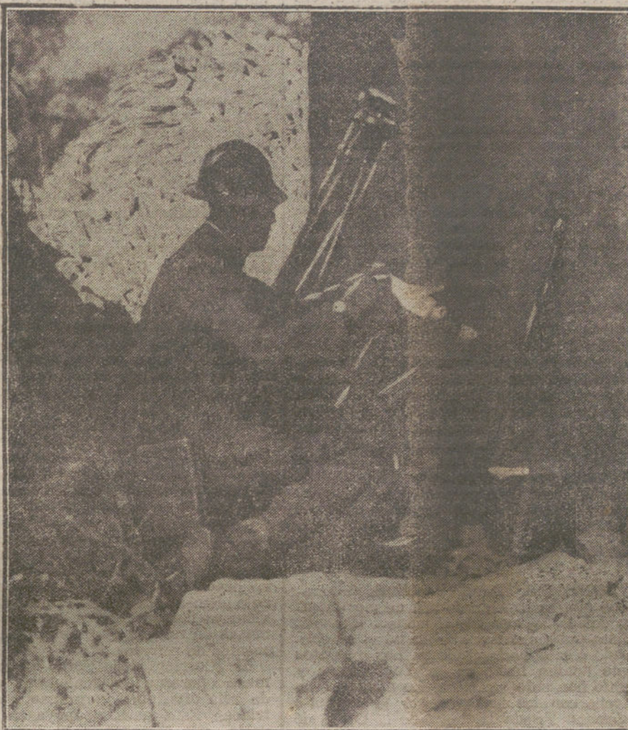
LA LUCHA EN EL FRENTE ITALIANO.—Un sanitario asistiendo á un herido, en las proximidades del campo de batalla.

En Ultramar, lo sabe muy bien M. Margueritte — ó lo siente, que es igual —, la prosa francesa es champr-