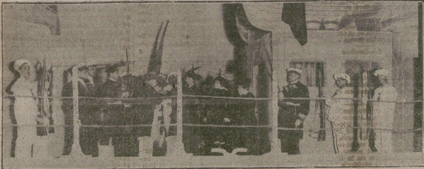
Una escena de «Los años del mar», obra estrenada anoche en el teatro de Price.

SANTANDER. Un pailebot, cuya nacionalidad se desconoce, ha encallado frente á Suances, habiendo salido de él á varios pesqueros á fin de prestarle auxilios.