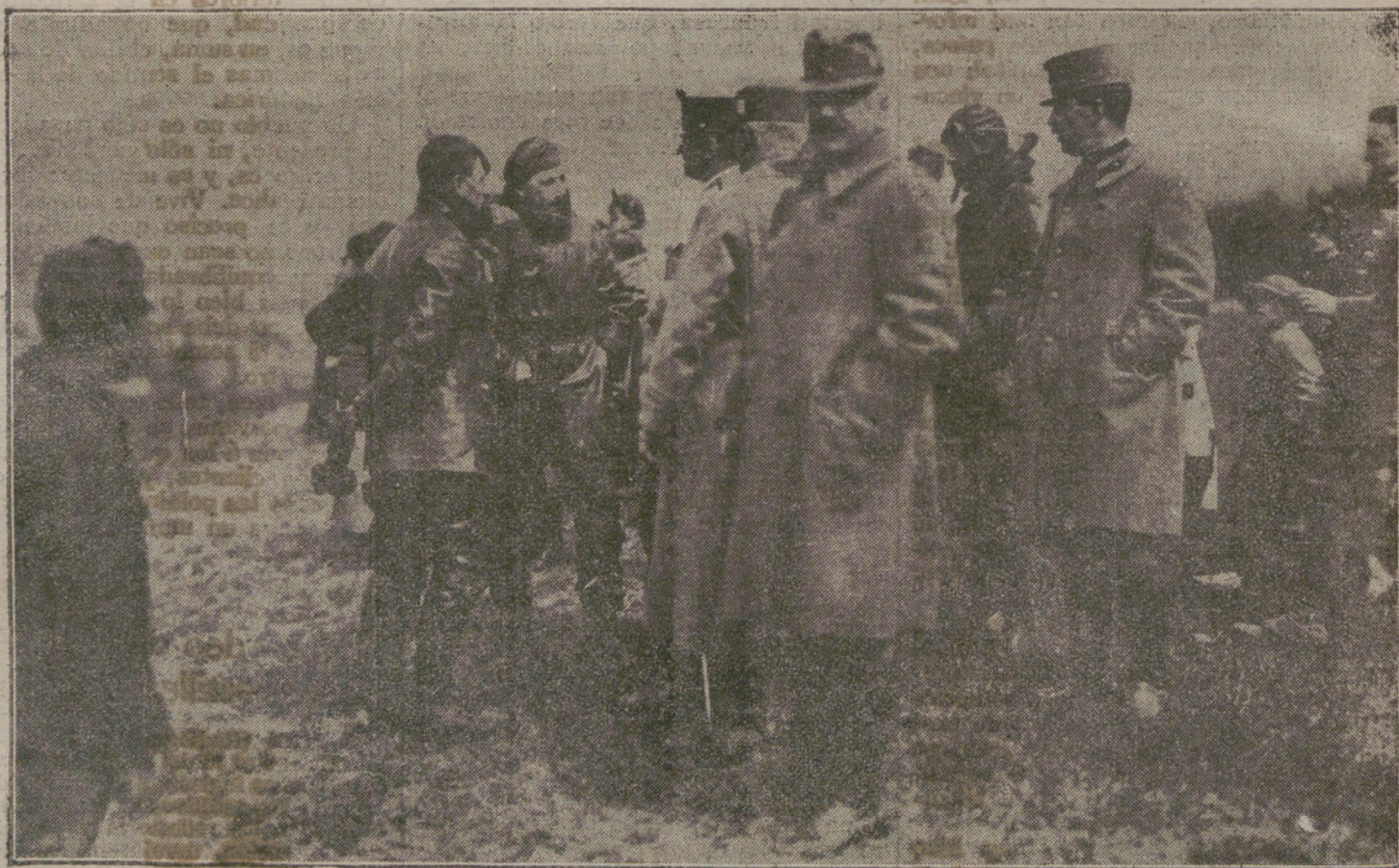
LA LUCHA EN EL FRENTE ITALIANO.—Oficiales austro-húngaros, interrogando á los aviadores italianos prisioneros.

«El enemigo ha resuelto el problema de la unidad de acción por la disciplina brutal; con un pueblo dueño y los otros