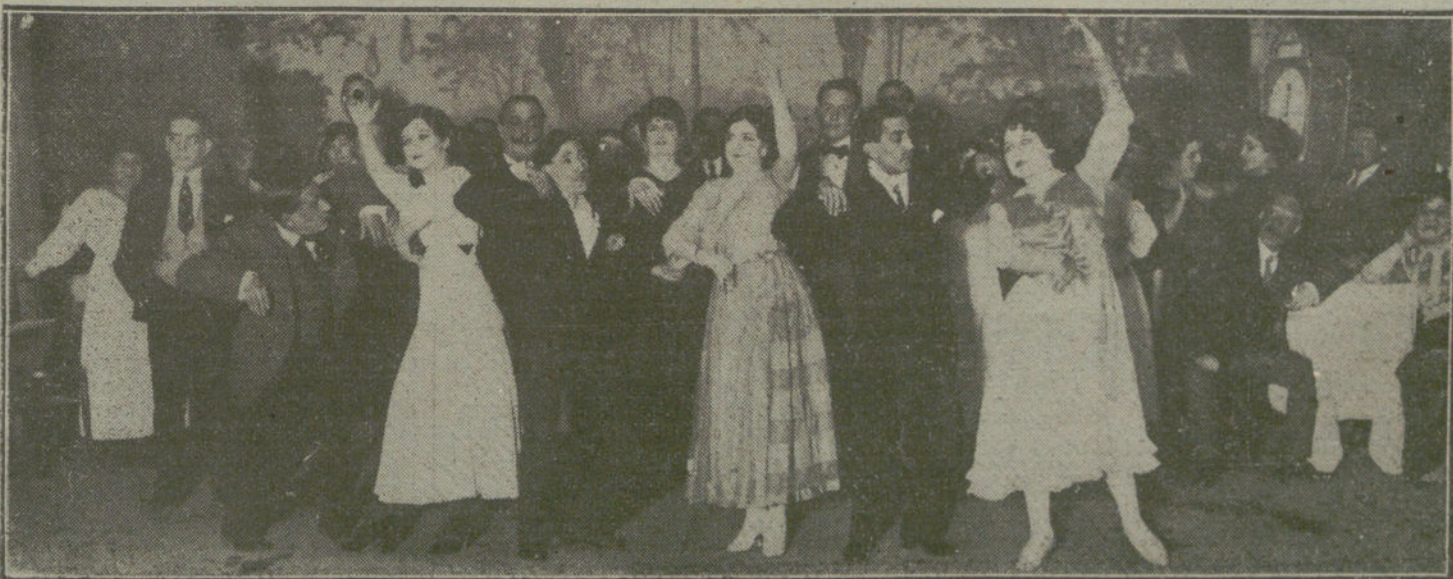
Una escena del sainete «Ya se casó la Isabel», que se estrana esta noche en el teatro de Marín.