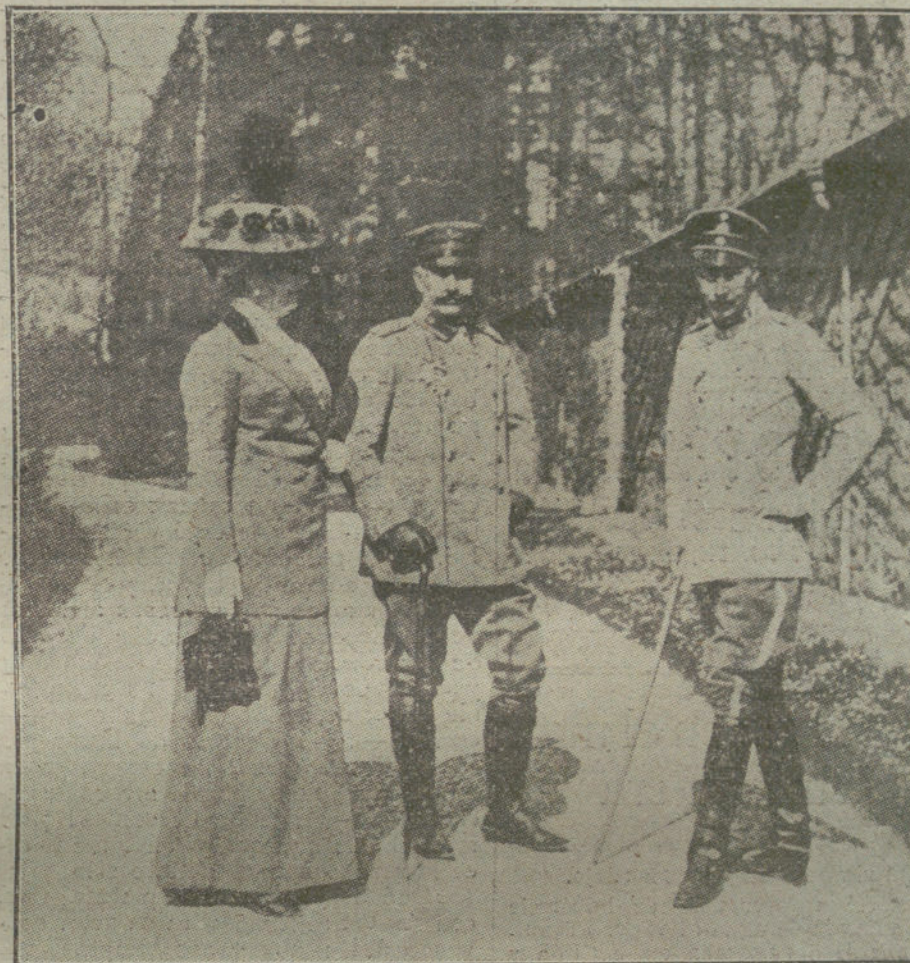
LOS JEFES DE ESTADO EN LA GUERRA. —SS. MM. el Emperador y Emperatriz alemanes en el Cuartel general de su hijo, el Príncipe heredero, en el teatro occidental.

En España no se ha realizado todavía ninguna convulsión intensa que lleve el sello nacional. Nuestras izquierdas se han inspirado en los ideales de Francia y de Inglaterra; han sido revolucionarios españoles con mentalidad extranjera. Examinad a cualquier agitador de las izquierdas y veréis que, más que en necesidades de su país, se basa su revolucionarismo en concepciones de escritores y filósofos extranjeros. Lo nacional no aparece por ninguna parte. El deseo de buscar en las mismas entrañas de la raza los materiales para su trans-