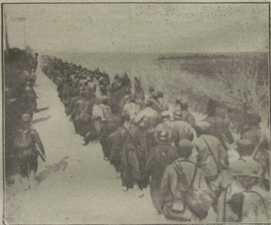
LA LUCHA EN FRANCIA.—Conducción de prisioneros franceses, hechos por los alemanes, a un campo de concentración.

VIENA. Comunican del Cuartel de Prensa, que según todas las noticias recibidas, sería demasiado temerario aceptar como realidad completa la vic-