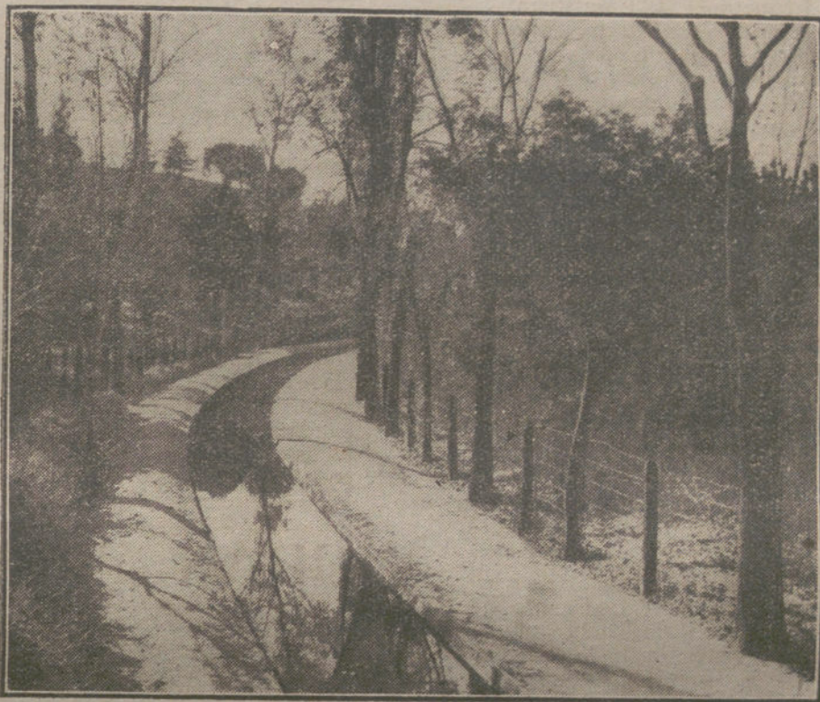
Un aspecto del canalillo.

LA FELICIDAD, LOS GOBIERNOS CIVILES Y LOS VERSOS DEL CLASICO.—COMO SE OPINA EN LA DEHESA DESPUES DE COMER.—YO ME ARRIME A UN PINO VERDE...—LA PUERTA DEL SOL, LOS CUATRO CAMINOS Y EL PINAR.—MIENTRAS LOS NIÑOS MUEREN...—UNA «IDEICA» PARA EL FUTURO ALCALDE