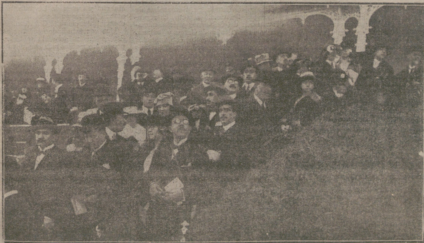
LAS CARRERAS DE AYER.—Aspecto de un sector del Hipódromo, durante las últimas carreras. (Fot. VIDAL)

Por si en efecto el «busilis» de que habla el «Heraldo» sigue inspirando la próxima campaña izquierdista, bueno será que los incautos electores no olviden lo que á raíz de los sucesos escribían esos colegas que hoy escriben todo lo contrario.