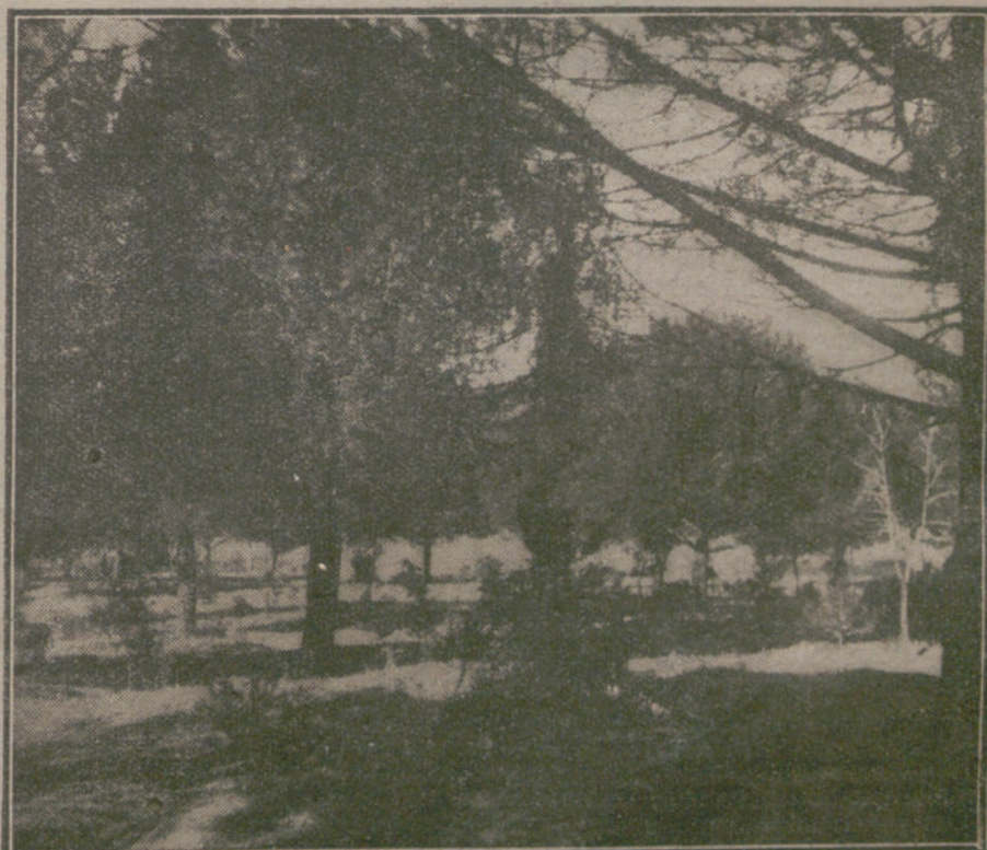
Uno de los más sugestivos paisajes de la Dehesa.

¿Por qué no van los niños á la Dehesa de la Villa? Nos pasamos la vida clamando contra las malas condiciones que reúnen las casas de Madrid. De tiempo en tiempo, cuando una trágica estadística nos dice que aquí mueren los niños por millares, escribimos