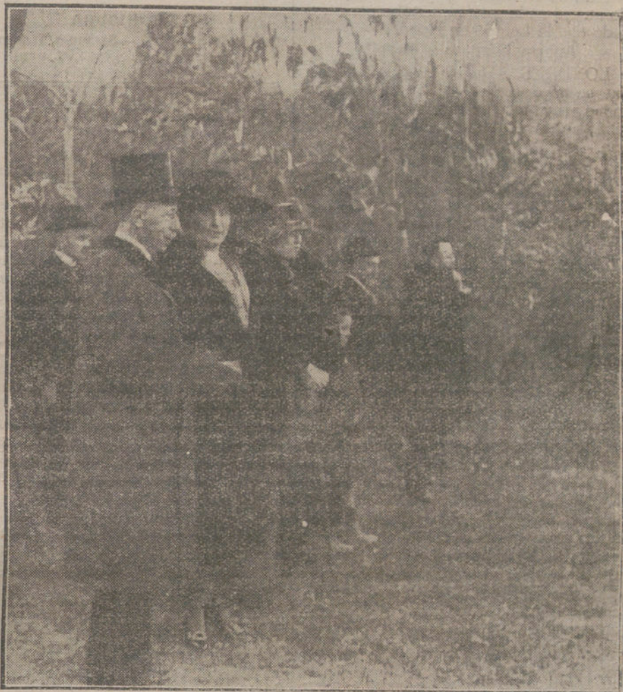
AYER EN LAS CARRERAS.—S. M. la Reina Victoria con el marqués de la Mota, viendo el paso de los caballos.

las izquierdas tengan motivo para hacer la campaña á favor de la amnistía, y sobre todo que puedan agitar esa bandera en unas elecciones generales!»