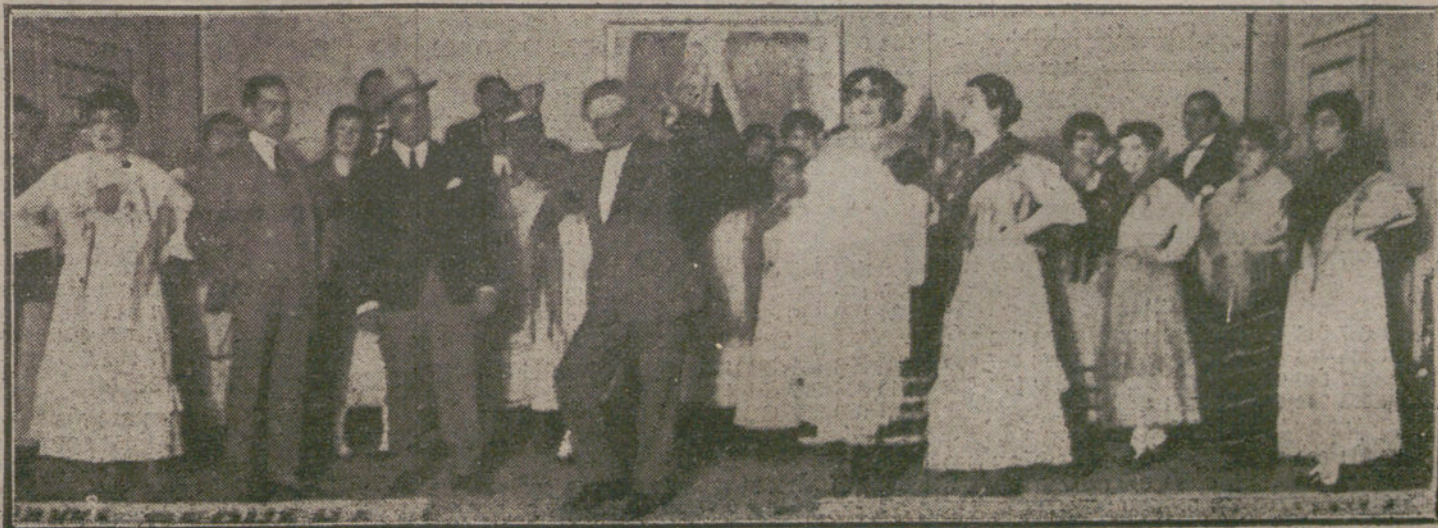
Una escena de «El bautizo del nanos», sainete estrenado ayer en el teatro de Martín.

La causa ha despertado honda expectación.