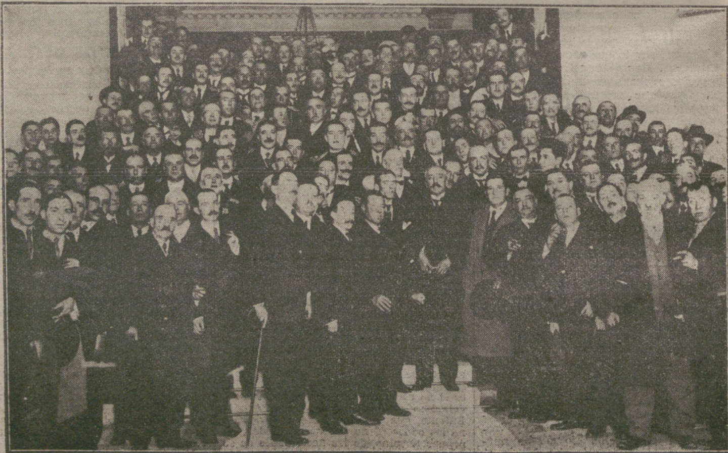
Grupo de asistentes al banquete con que ayer fué obsequiado, en el Palacio Hotel, el ministro de Fomento, Sr. Alcalá Zaldívar.