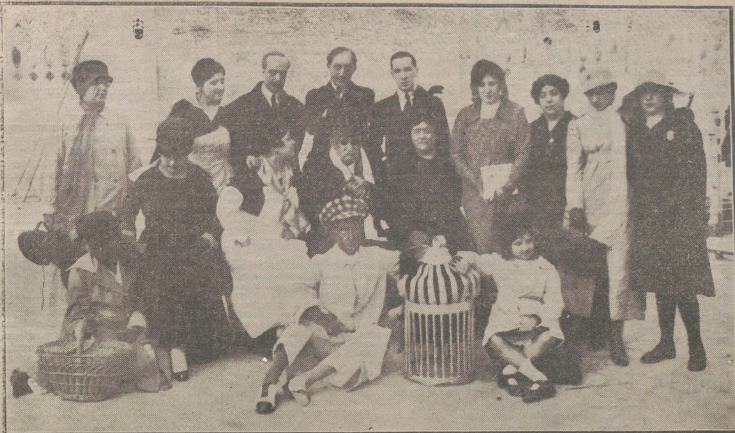
D. Benito Pérez Galdós y los intérpretes de la adaptación escénica de «El amigo Manso», estrenada anoche en el Odeón.

El autor funda sus muy interesantes manifestaciones con rico material estadístico, del que se desprende que ni Francia, ni Italia, ni Rusia, ni tampoco Inglaterra pueden prescindir de sus relaciones comerciales con Alemania, sin causarse con ello los mayores perjuicios.