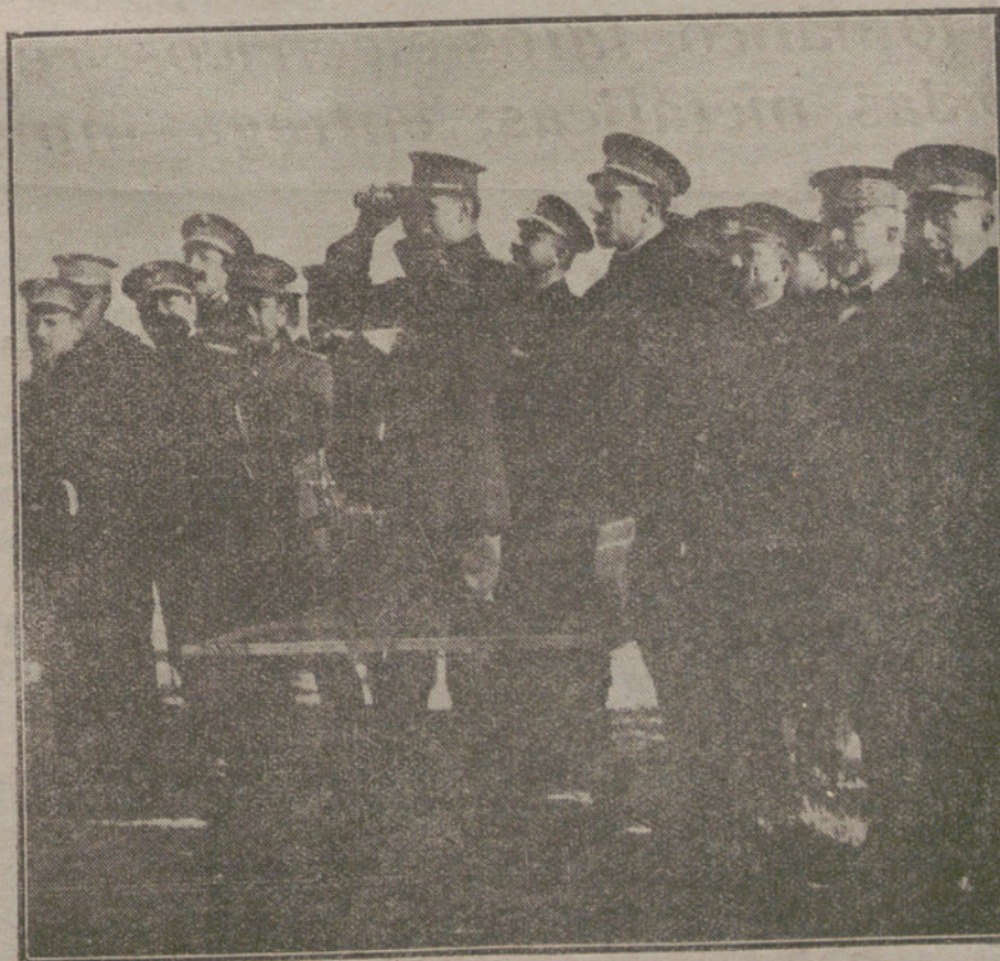
LAS PRACTICAS MILITARES EN OARABANCHEL. S. M. el Rey y el ministro de la Guerra, presenciando la destrucción de una alambrada por medio de la electricidad.

GRAUS. Con motivo de los festejos de Santa Cecilia y subsiguientes, el Orfeón de Graus celebró varios actos, que resultaron interesantísimos.