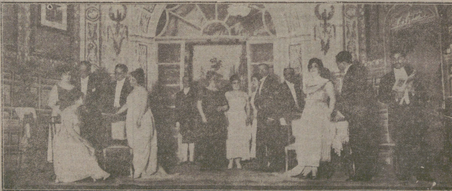
Una escena de «La aventura del coche», obra estrenada anoche en el teatro de Cervantes.

Si hubiéramos enviado solamente la mitad de los efectivos que en Septiem-