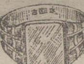
Núm. 5.—Gramos ocho, Ptas. 30.