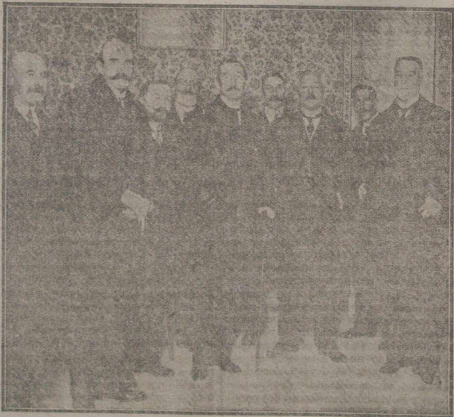
El ministro de Fomento con el vizeconde de Eza y demás oradores que han tomado parte en las conferencias de Seguros Agrícolas, cuya sesión de clausura se ha verificado esta mañana.

Ponemos en el consejo todo el respeto que nos merece la persona y toda la antipatía que nos producen sus desaguisados.