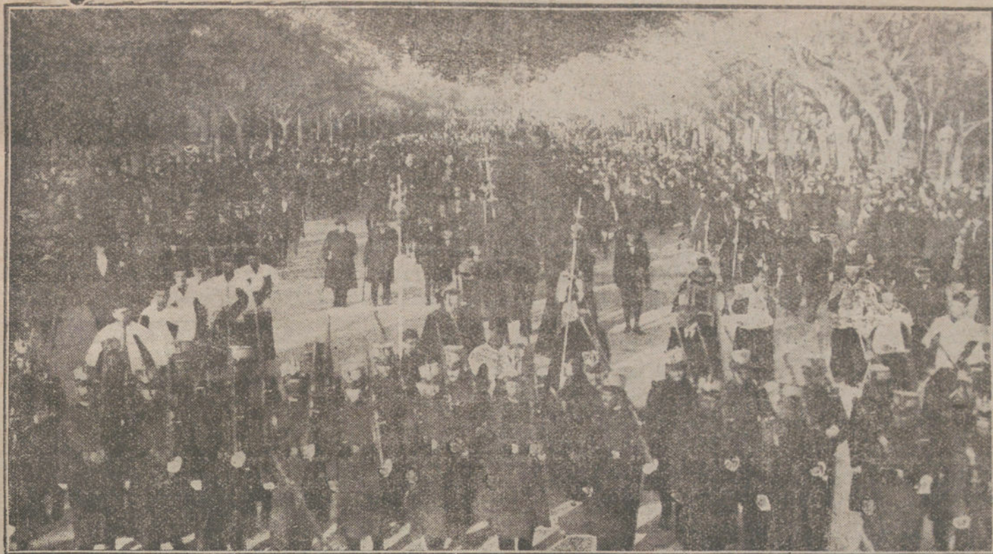
EL ENTIERRO DEL GENERAL ECHAGÜE.—La fúnebre comitiva á su paso por Recoletos.

detenidamente los cinco modelos de cocina de campaña y recorrió todos los locales y dependencias de la Maestranza y talleres, quedando muy complacido de la visita.