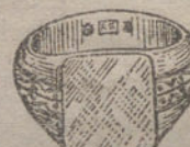
Núm. 11.—Gramos doce, Ptas. 45.