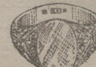
Núm. 13.—Gramos trece, Ptas. 48,75.