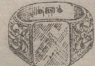
Núm. 10.—Gramos once, Ptas. 41,25.