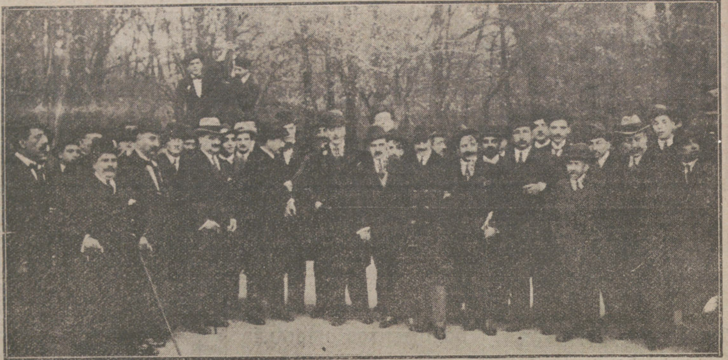
EL BANQUETE MAURISTA. Grupo de asistentes al acto celebrado ayer tarde en el Ideal Retiro, en honor de los nuevos concejales.

PARIS. Participan desde Ginebra que se da como seguro que para el próximo Enero comenzará una nueva campaña submarina, dirigida especialmente contra Inglaterra.