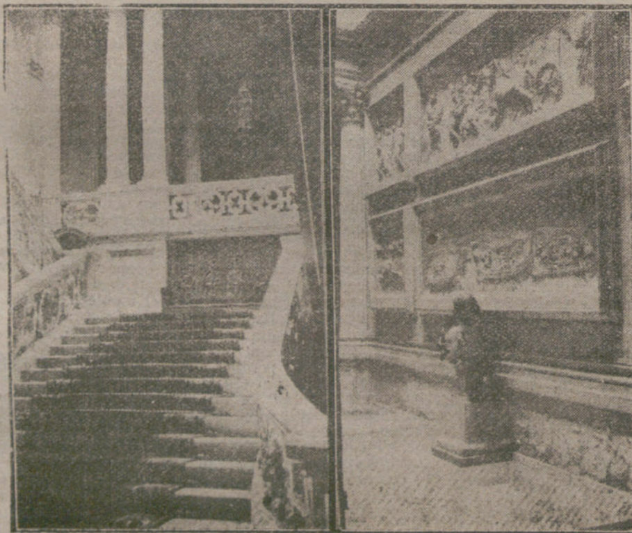
INCENDIO DEL PALACIO DE MEDINACELI. Aspecto de la escalera principal. Detalle de una de las fuentes, obra de Benlliure.

Una Comisión de los Centros hispano-marroquíes ha visitado al señor ministro de Hacienda para exponerle la conveniencia de que la Aduana marroquí aplique el decreto dictado por el Maghzen sobre la admisión temporal; la necesidad de aplicar al dictamen de la Comisión que el ministerio de Estado nombró para lo relativo a la producción nacional; que pase por nuestros territorios africanos de tránsito para la zona española; que las subastas sean anunciadas con un plazo prudencial para que la industria y comercio español tengan tiempo de conocer las condiciones; que las facilidades que disfrutaban los productos onasados que exportamos a Portugal se apliquen también a las que enviamos a Marruecos. También han hablado del modo y forma en que se aplica la disposición octava del Arancel, pues a pesar de que esta disposición declara libre de derechos las pieles, lanas, etc., procedentes de nuestras posesiones del Norte de África y Río de Oro, las Aduanas exigen actualmente el pago de derechos arancelarios a estos artículos como si