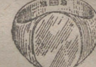
Núm. 15.—Gramos veinte, Ptas. 75.

Factura de garantía en todas las compras.