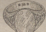
Núm. 4.—Gramos 7,5, Ptas. 28,15.