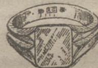
Núm. 3.—Gramos siete, Ptas. 26,25.