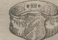
Núm. 6.—Gramos 8,5, Ptas. 31,90.