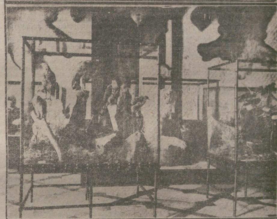
EL INCENDIO DEL PALACIO DE MEDINACELI. Un detalle del despacho del duque.—Angulo de interesante Museo de Historia Natural.

piró á pulmón abierto y luego dió un pequeño grito y pensó que «aquello» pudo ser una encerrona, en la que cayó como un colegial, y ¡zas!, apresuró el paso, que había acortado mientras meditaba, y se presentó en la Comisaría, donde formuló una denuncia.