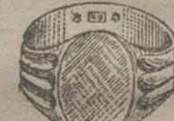
Núm. 9.—Gramos once, Ptas. 41,25.