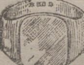
Núm. 14.—Gramos quince, Ptas. 56,25.