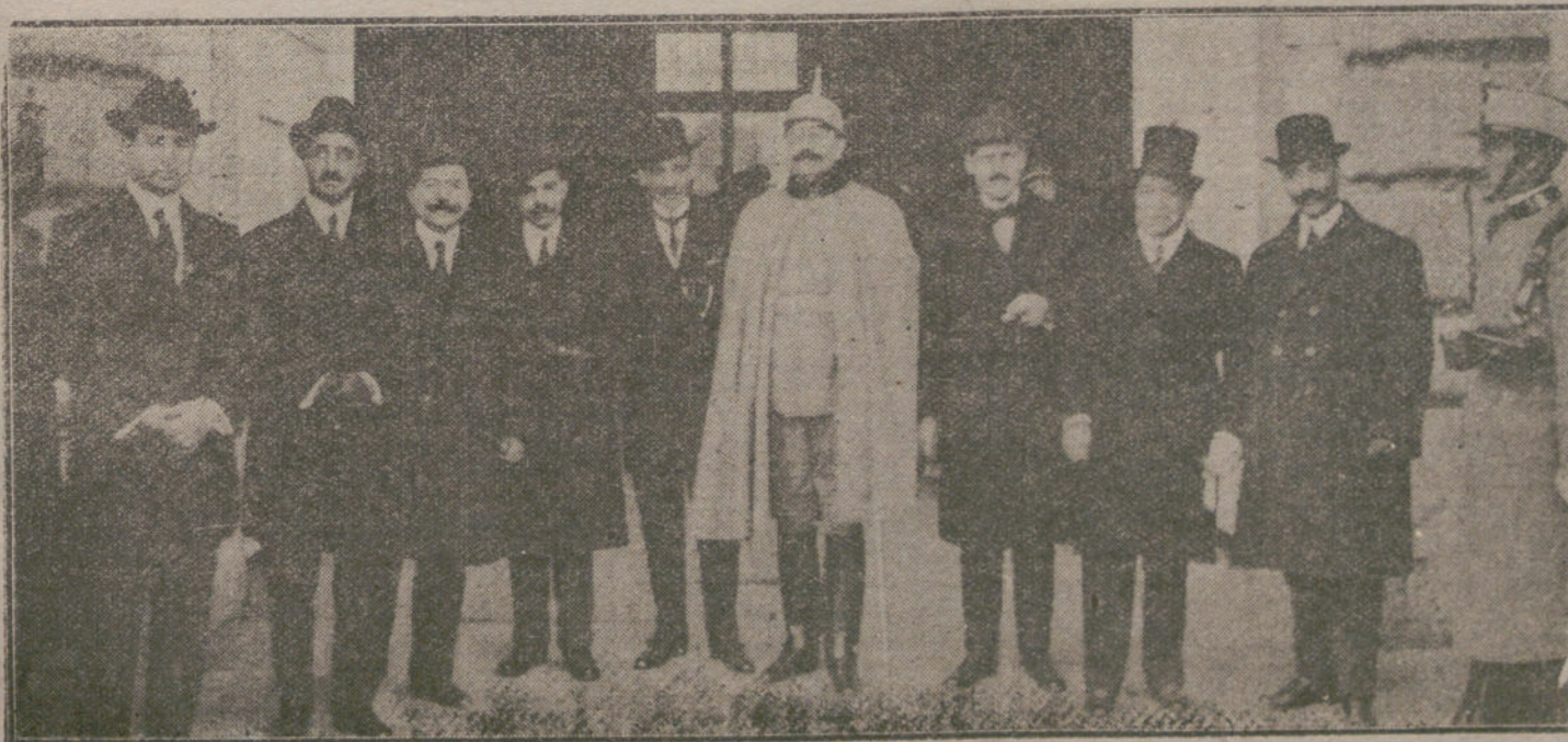
La Dignificación de la «Quinta de la Alianza», al salir ayer de Palacio, después de invitar á S. M. á la inauguración del Sarcófago que se ha construido en Barcelona.