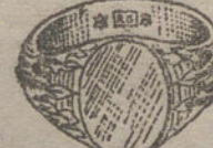
Núm. 12.—Gramos 12,5, Ptas. 46,90.