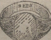
Núm. 8.—Gramos diez, Ptas. 37,50.