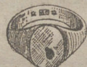
Núm. 2.—Gramos seis, Ptas. 22,50.