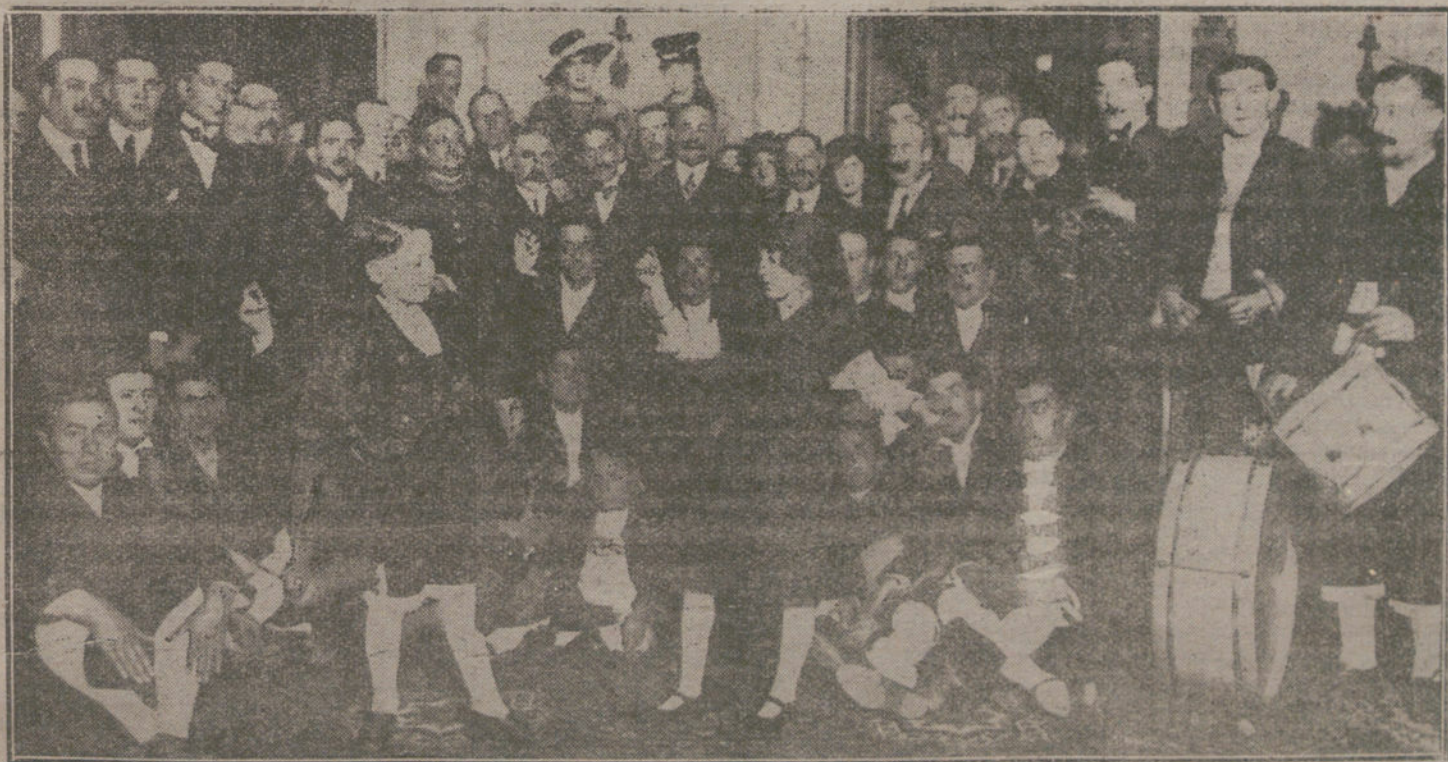
El famoso coro lucense, que ayer visitó la Casa de la Villa, donde fué obsequiado por el Ayuntamiento.

No creemos que la fuerza poderosa de la Entente abandonara este problema vital, que entristece y deprime a sus heroicos luchadores. En cambio, cada día se mantiene más pujante y más vigoroso el espíritu de la población civil y militar de los Imperios centrales, organizando maravillosamente su avituallamiento y sosteniendo la baratura de las subsistencias.