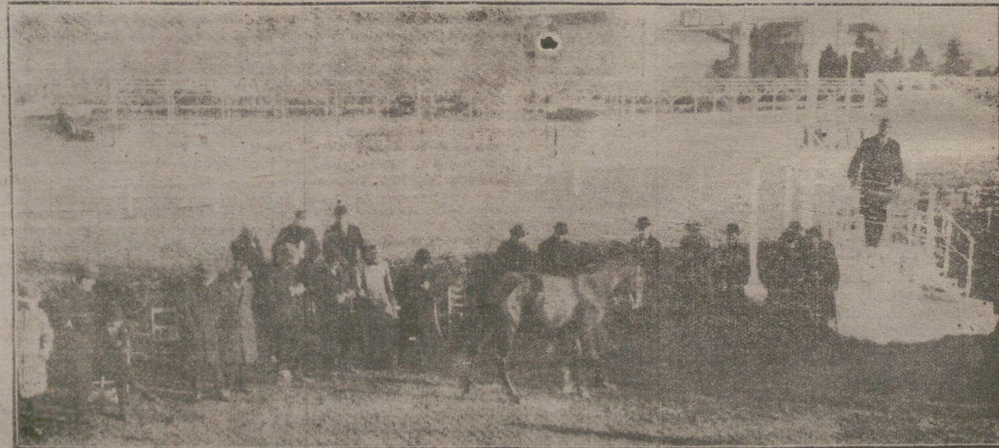
DESPUES DE LAS CARREBAS.—Venta de caballos de carrera, verificada ayer tarde en el Hipódromo.

En ese centro de resistencia colaborarán tropas rusas que no simpatizan con