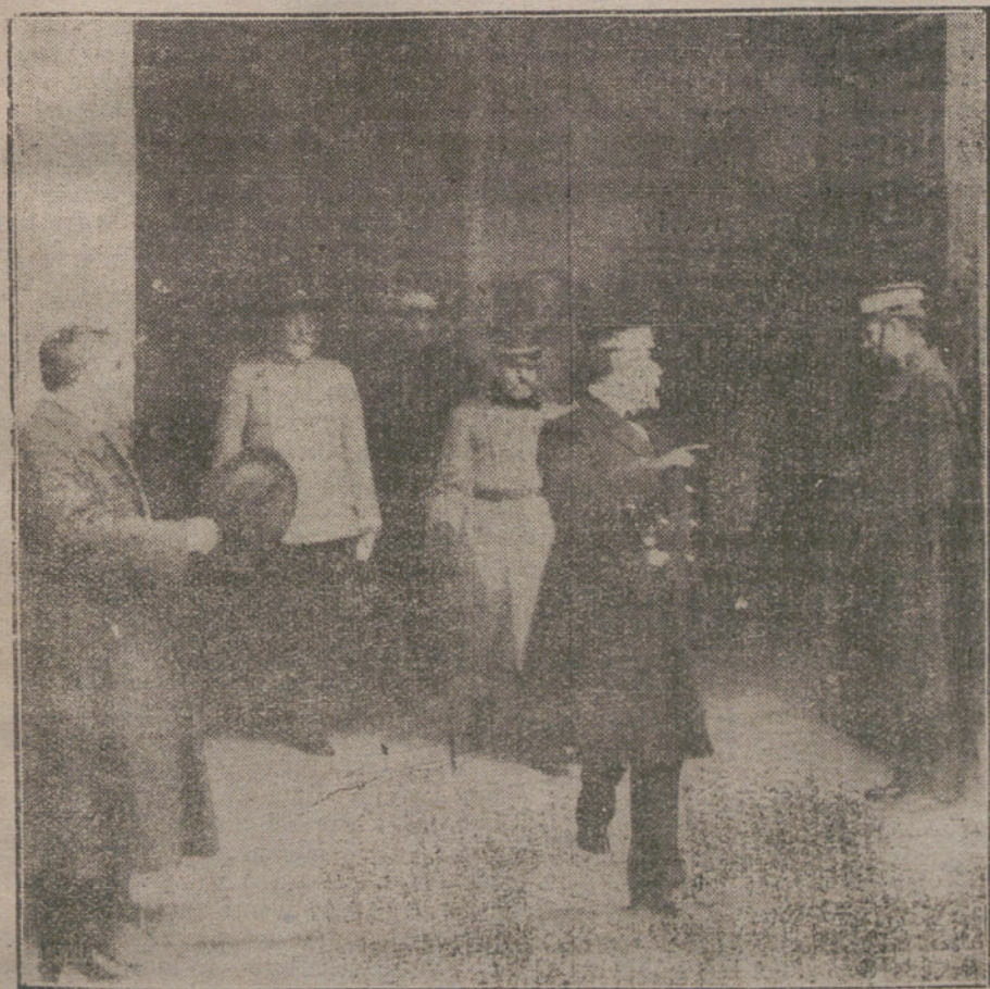
El ministro de la Guerra, Sr. La Cierva, saliendo de visitar la Escuela Superior.

El Sr. Alcalá Zamora les expuso el plan que tiene en proyecto para la defensa de los intereses comerciales é industriales, y que se propone llevar inmediatamente á la práctica.