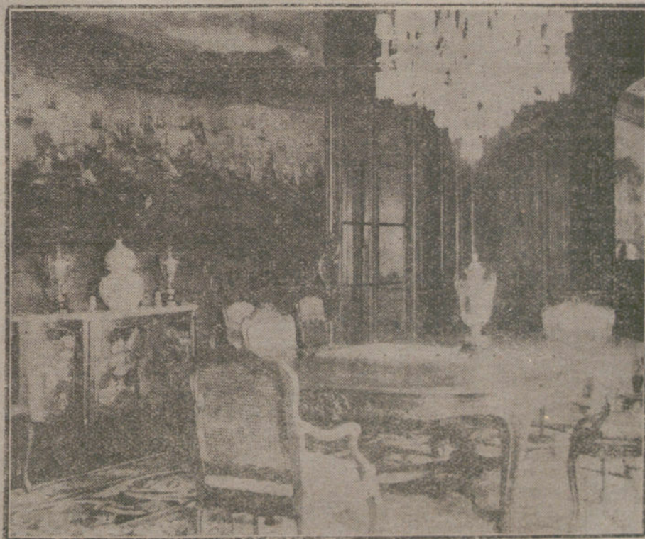
EL INCENDIO DEL PALACIO DE MEDINACELI.—Un ángulo del suntuoso comedor. Aun se ve el famoso cuadro de «Las batallas», que con gran exposición pudo ser salvado del siniestro.

El «Post» ve en el proyecto el triunfo del espíritu puramente democrático,