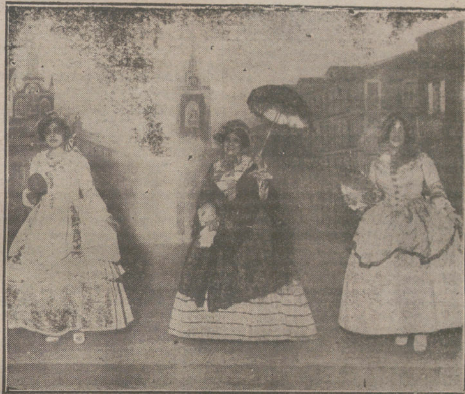
Una escena del primer cuadro de «La villa de los gatos», que se estrenó anoche en el teatro Cósmico.

Tropieza el Sr. Dato para realizar el propósito que se le atribuye con obstáculos serios. Mientras dentro del grupo se manifiesta la tendencia patrocinada por el Sr. González Besada de reor-